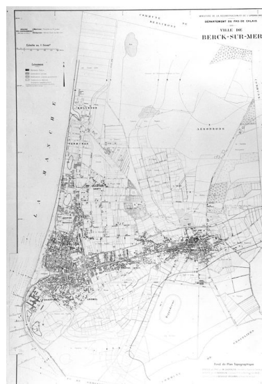
Plan topographique de la commune de Berck établi en 1945 par H. Sarrazin, géomètre, pour le compte du ministère de la reconstruction et de l'urbanisme, avec indication des immeubles détruits et des immeubles seulement sinistrés, vue générale.

IVR31_20056200138V