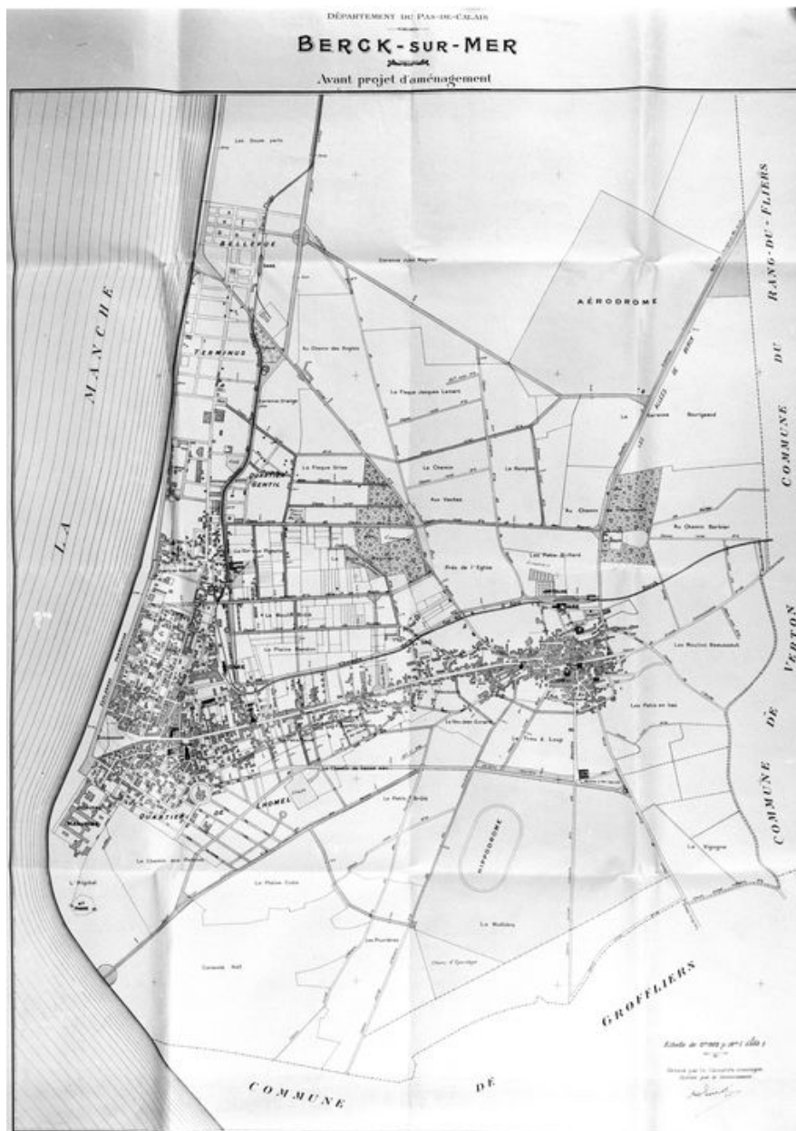
Plan topographique de la commune de Berck, dressé vers 1928, constituant un avant-projet d'aménagement visant à améliorer la voirie par rectification du tracé de certaines rues et routes existantes et par l'ouverture de nouvelles voies.