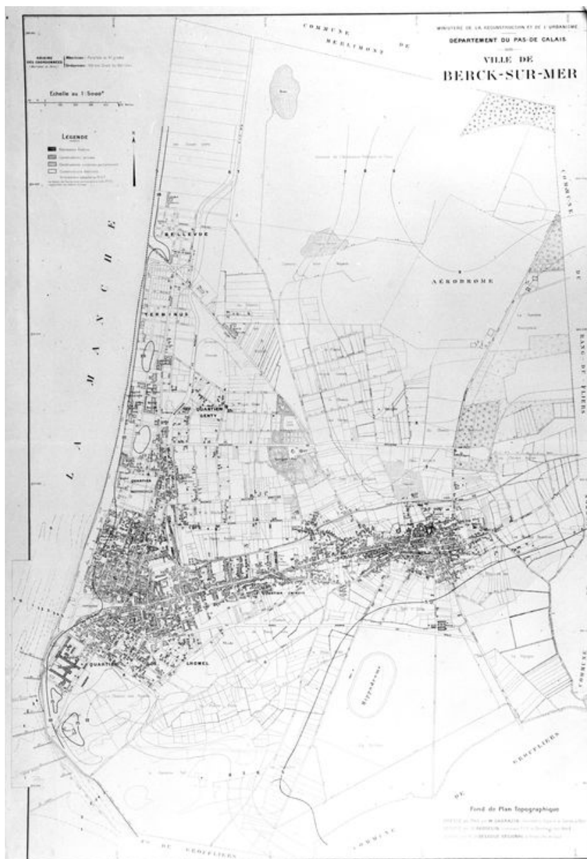
Plan topographique de la commune de Berck établi en 1945 par H. Sarrazin, géomètre, pour le compte du ministère de la reconstruction et de l'urbanisme, avec indication des immeubles détruits et des immeubles seulement sinistrés, vue générale.