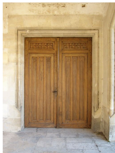
Vue de la porte d'entrée à deux vantaux.