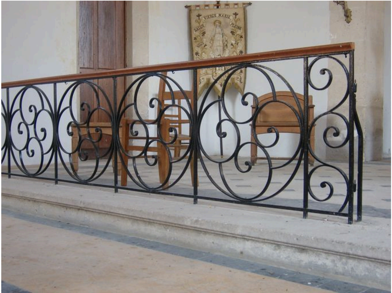
Vue de la clôture de chœur.