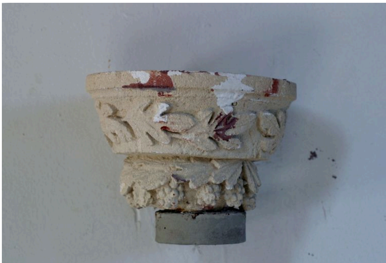
Vue du bénitier.