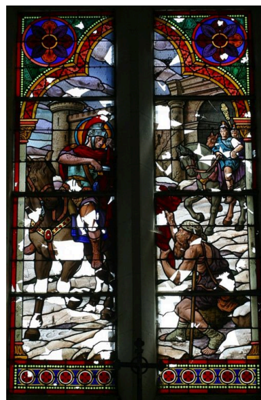
Vue du vitrail présentant la Charité de saint Martin.