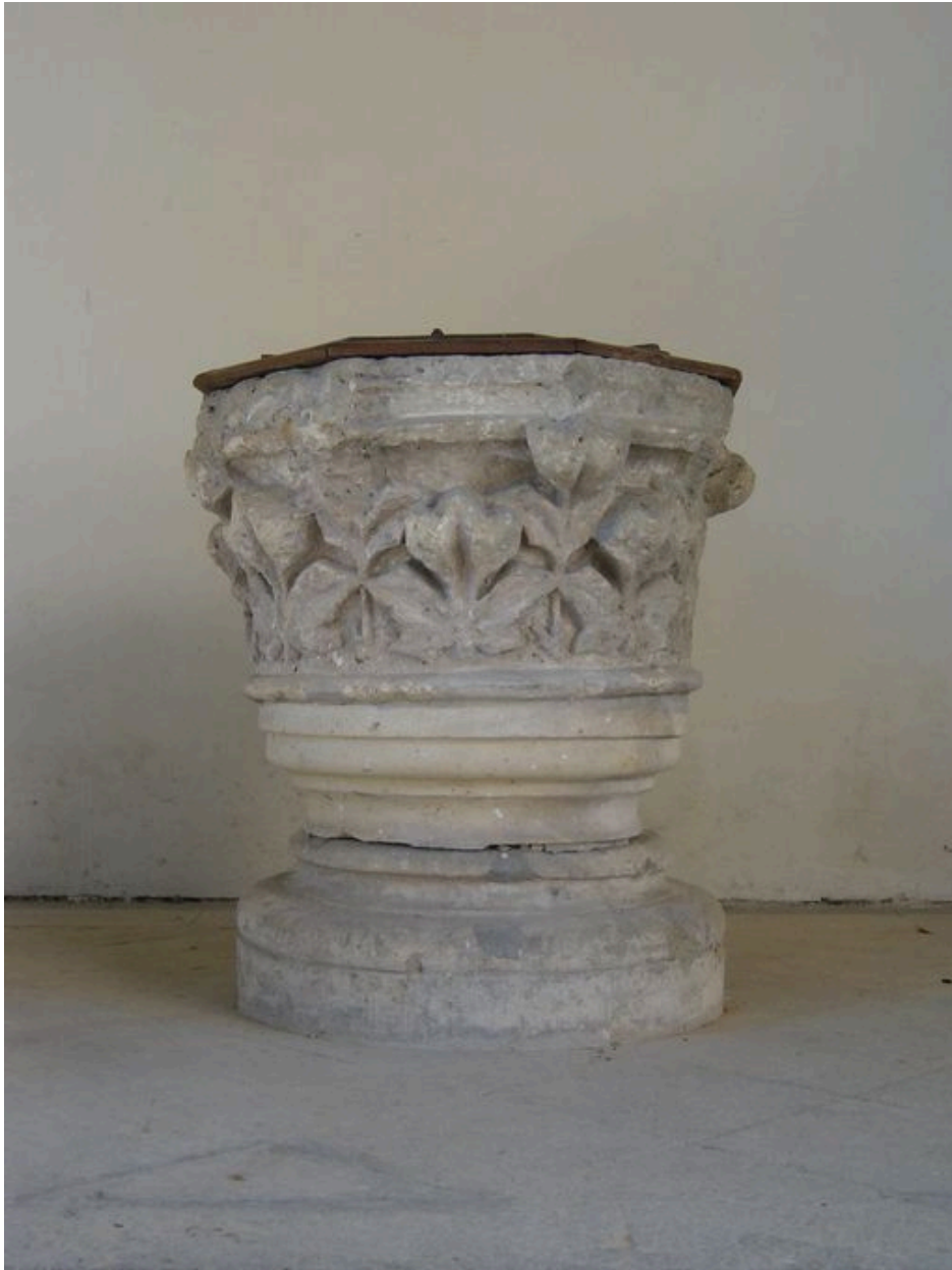
Vue des fonts baptismaux.