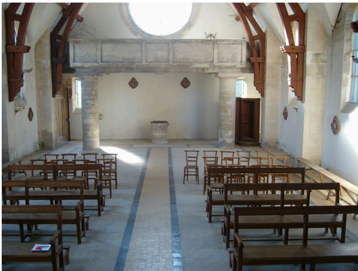
Vue de la tribune.