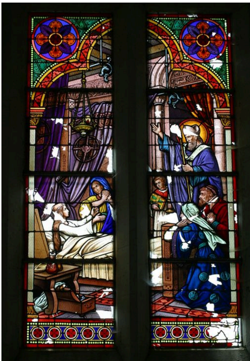
Saint Martin guérissant la jeune fille.