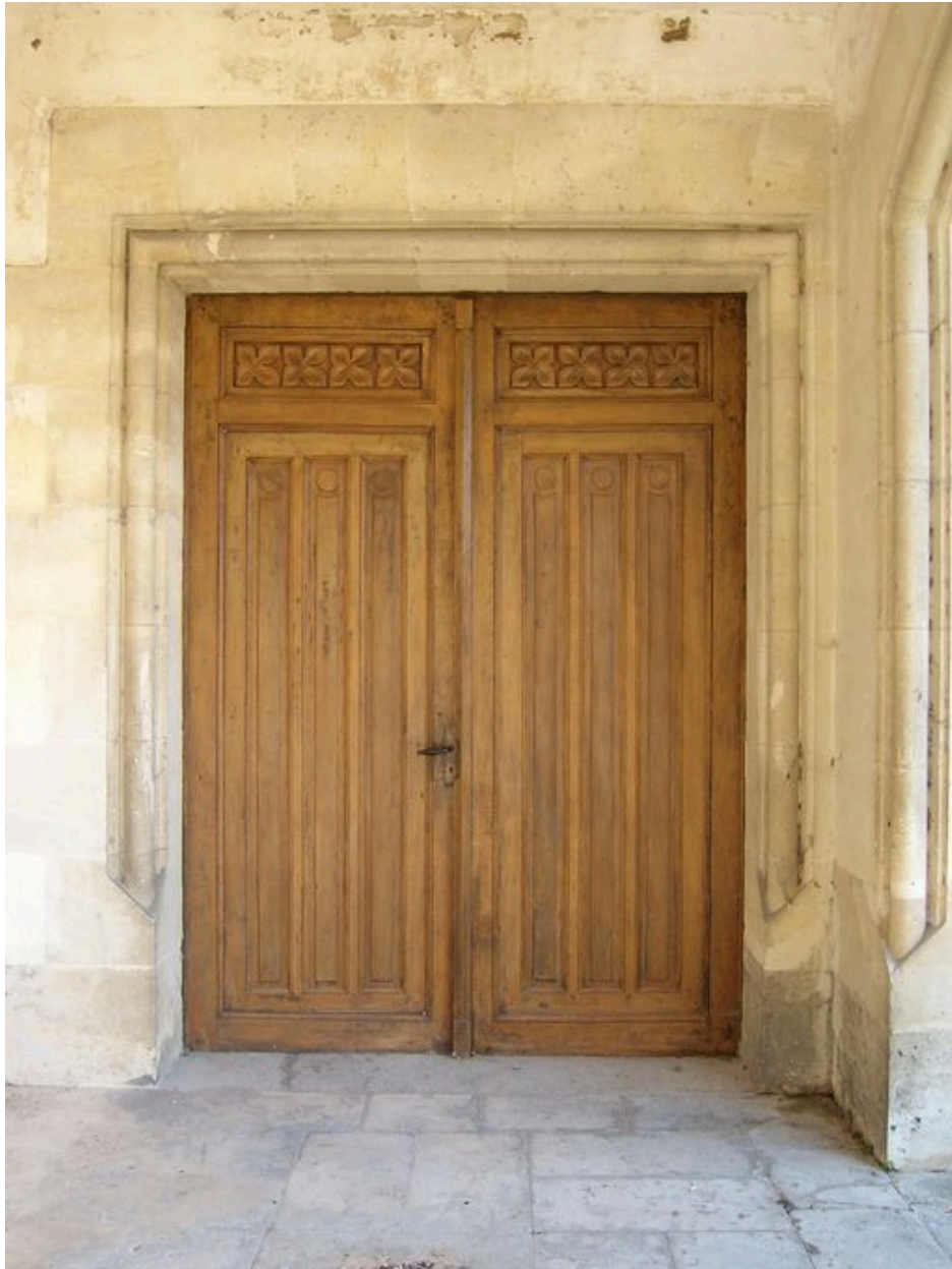
Vue de la porte d'entrée à deux vantaux.