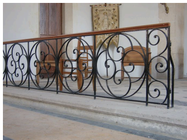
Vue de la clôture de chœur.