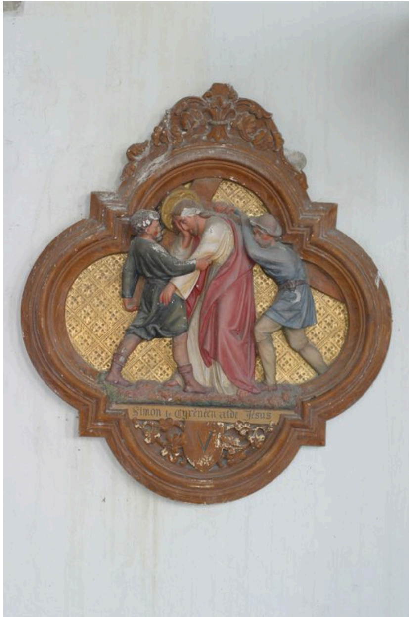
Vue du chemin de croix.