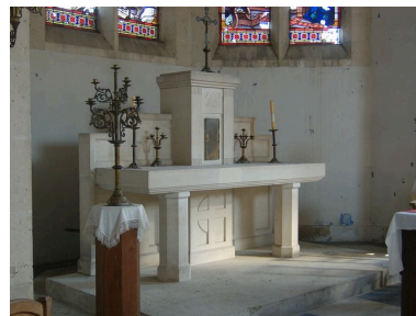
Vue du maître-autel.