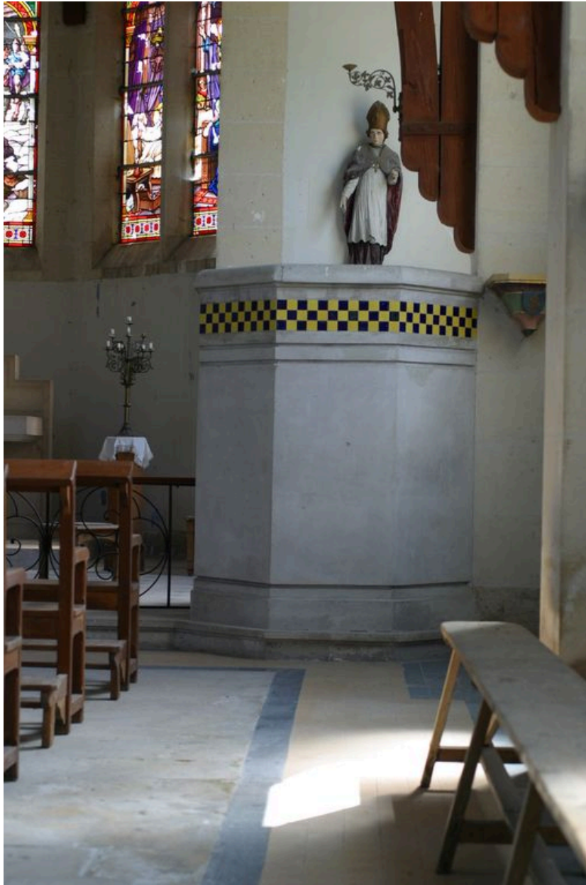
Vue de la chaire à prêcher.