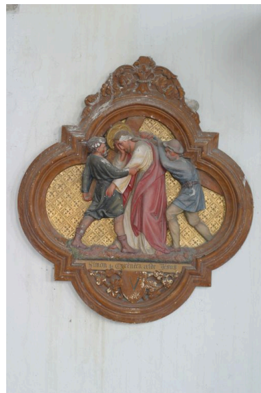
Vue du chemin de croix. IVR22_20030202853NUCA