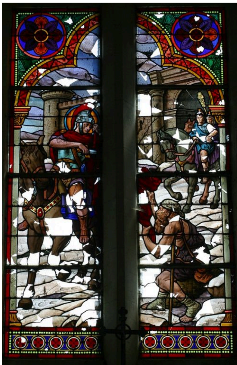
Vue du vitrail présentant la Charité de saint Martin.