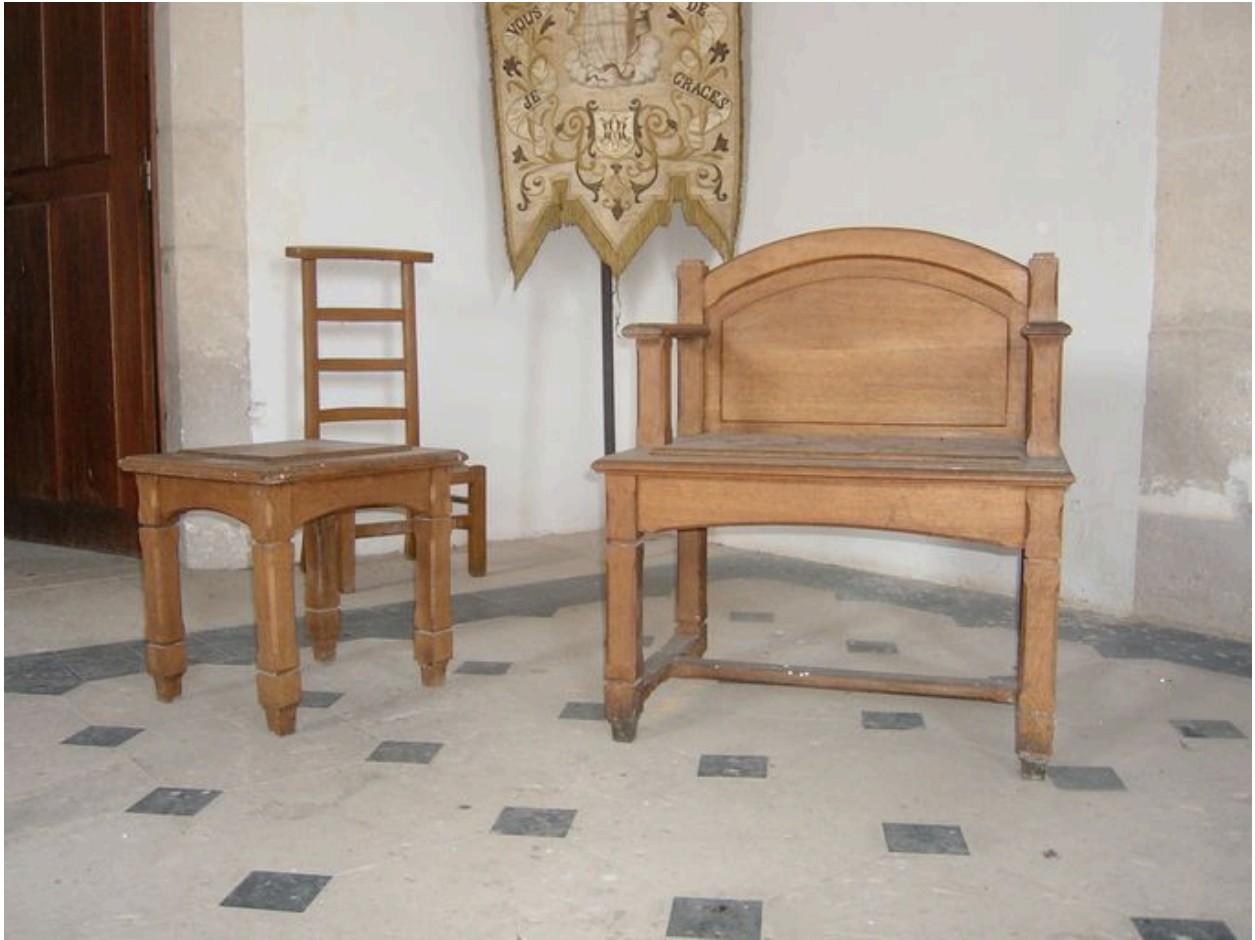
Vue du fauteuil de célébrant et son tabouret.