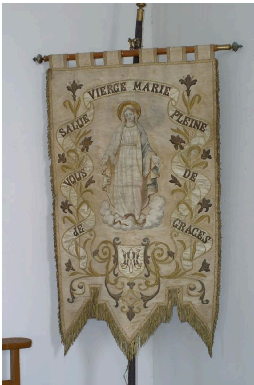
Vue de la bannière de la Vierge.