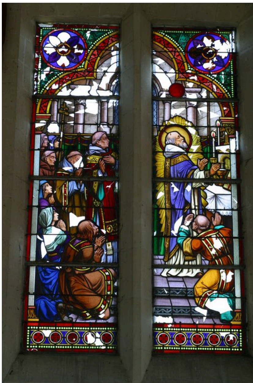
Vitrail présentant saint Martin priant devant un autel, entouré de témoins.