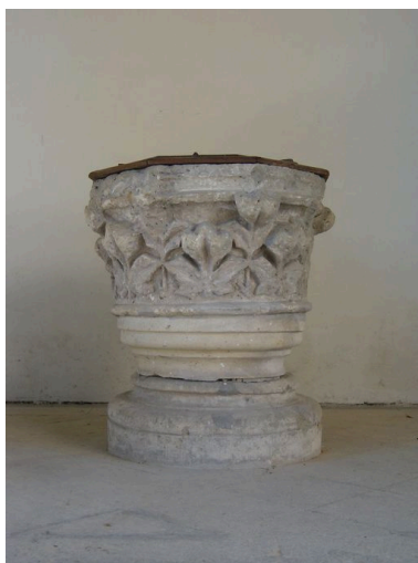
Vue des fonts baptismaux. IVR22_20030202856NUCA