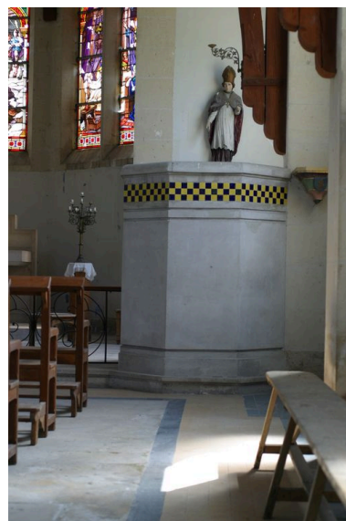
Vue de la chaire à prêcher.