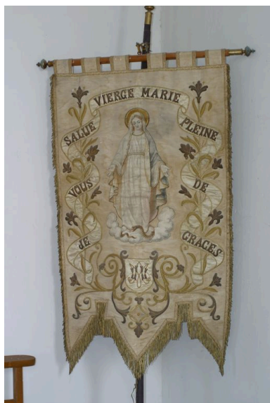
Vue de la bannière de la Vierge. IVR22_20030202850NUCA