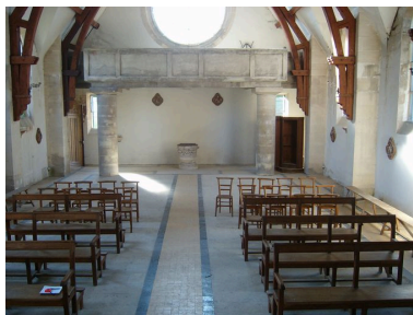
Vue de la tribune. IVR22_20030202859NUCA