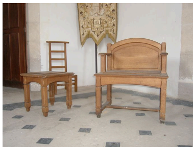
Vue du fauteuil de célébrant et son tabouret.