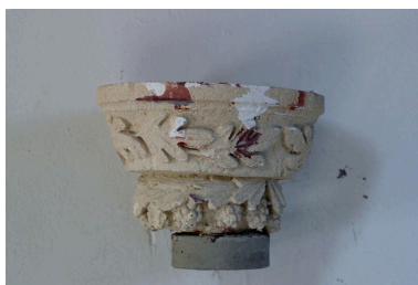
Vue du bénitier. IVR22_20030202851NUCA