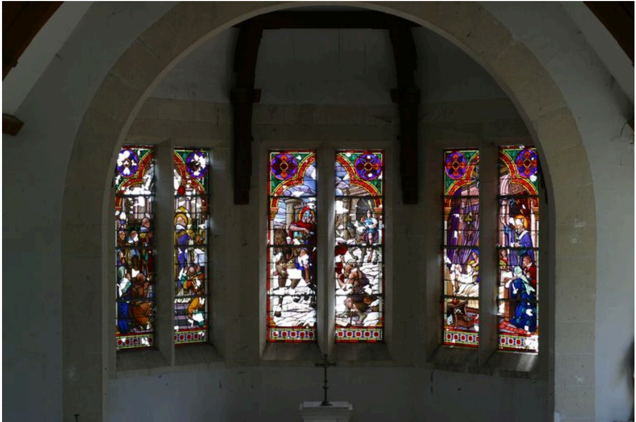
Vue générale des vitraux du chœur.