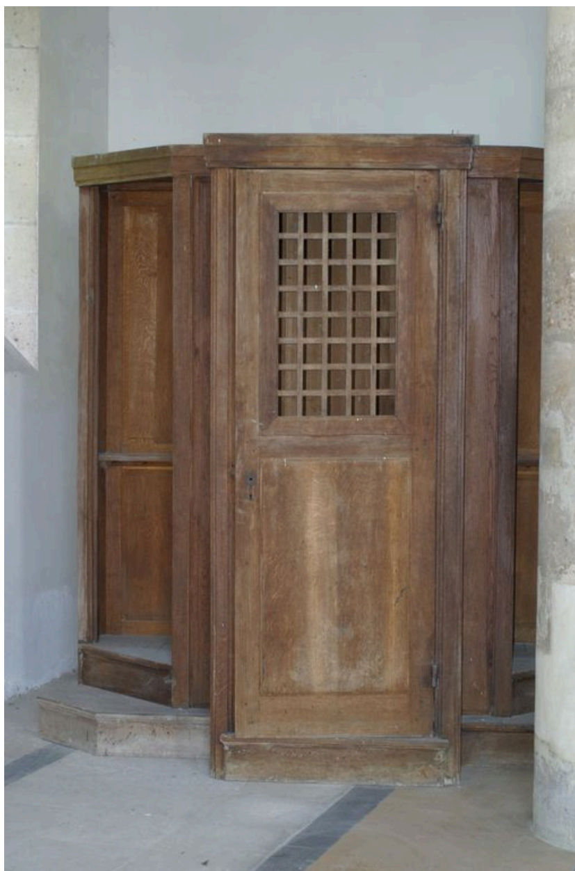
Vue du confessionnal.