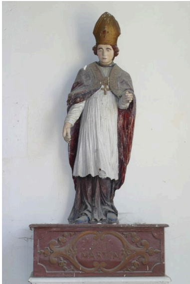
Statue de saint Martin devant l'arc triomphal. IVR22_20030202849NUCA