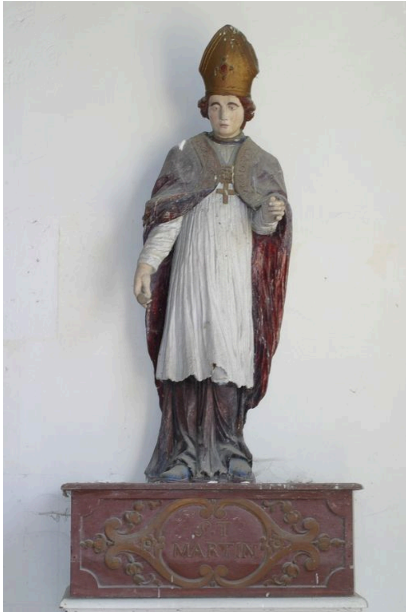
Statue de saint Martin devant l'arc triomphal.