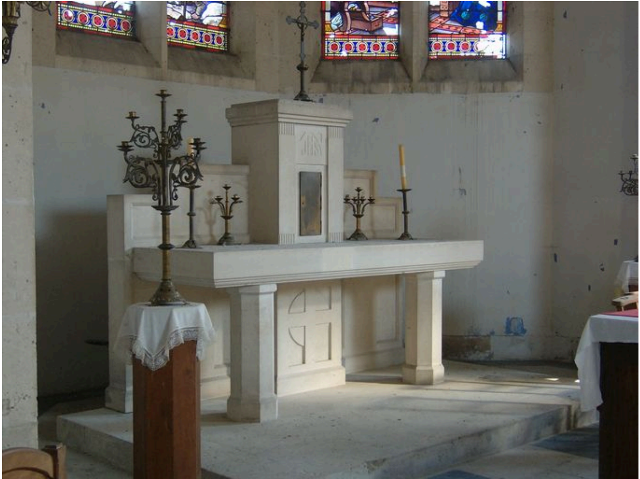
Vue du maître-autel.