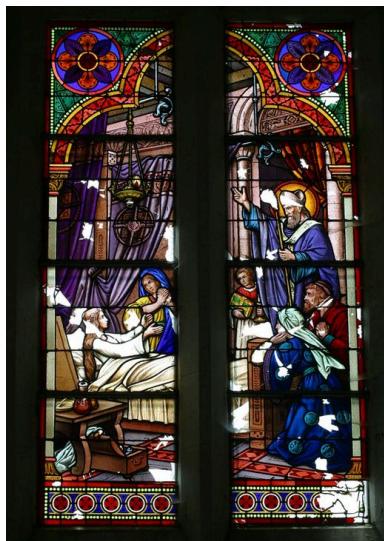
Saint Martin guérissant la jeune fille.