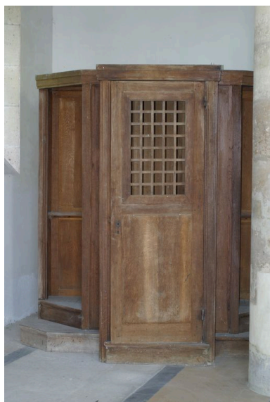
Vue du confessionnal. IVR22_20030202854NUCA