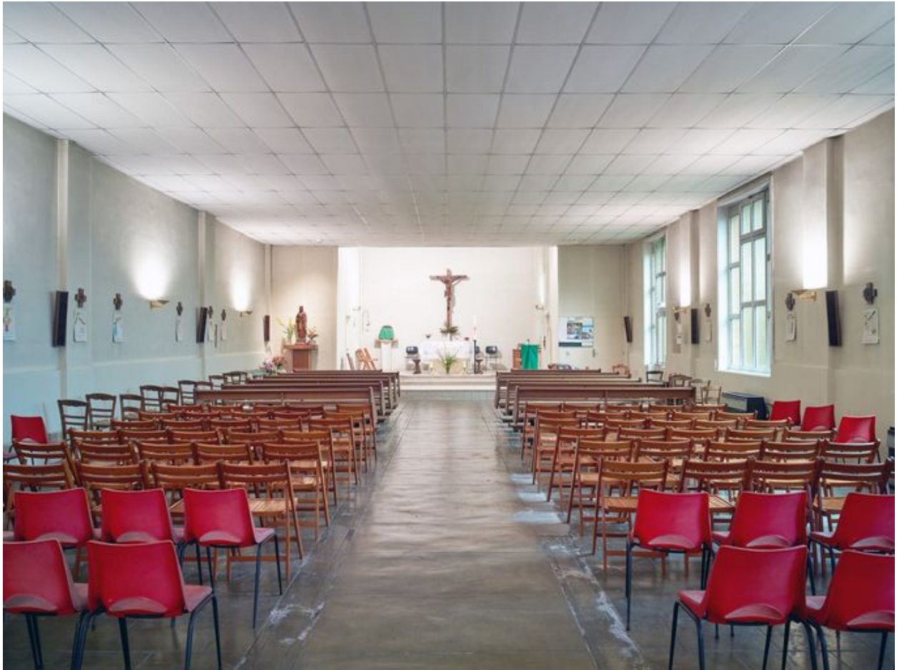
Vue générale vers le chœur.