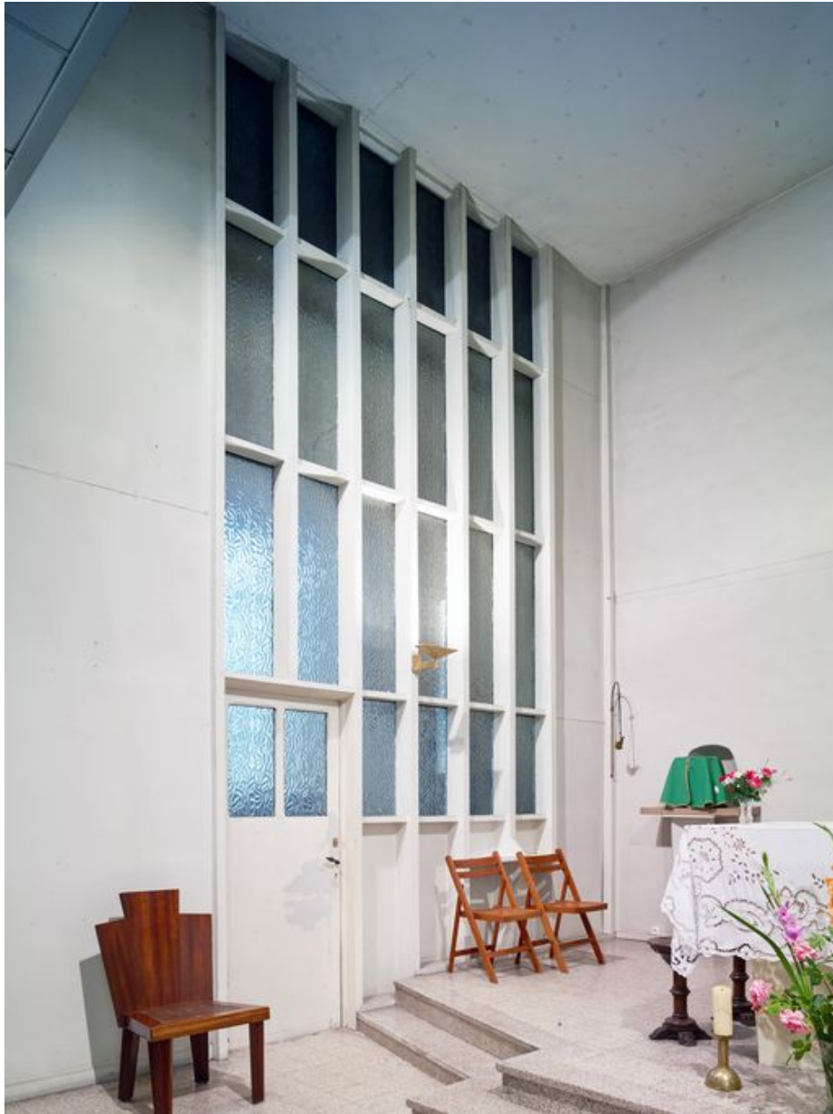
Séparation du chœur et de la sacristie.