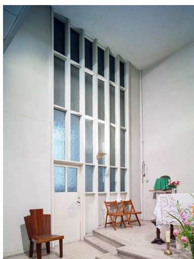
Séparation du chœur et de la sacristie. IVR31_20155901558NUCA