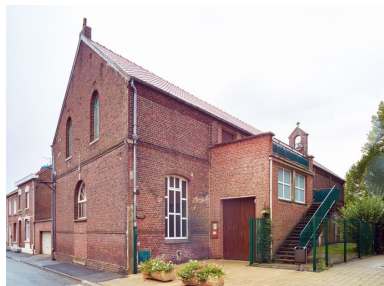
Élévation antérieure de l'église, de trois quart.