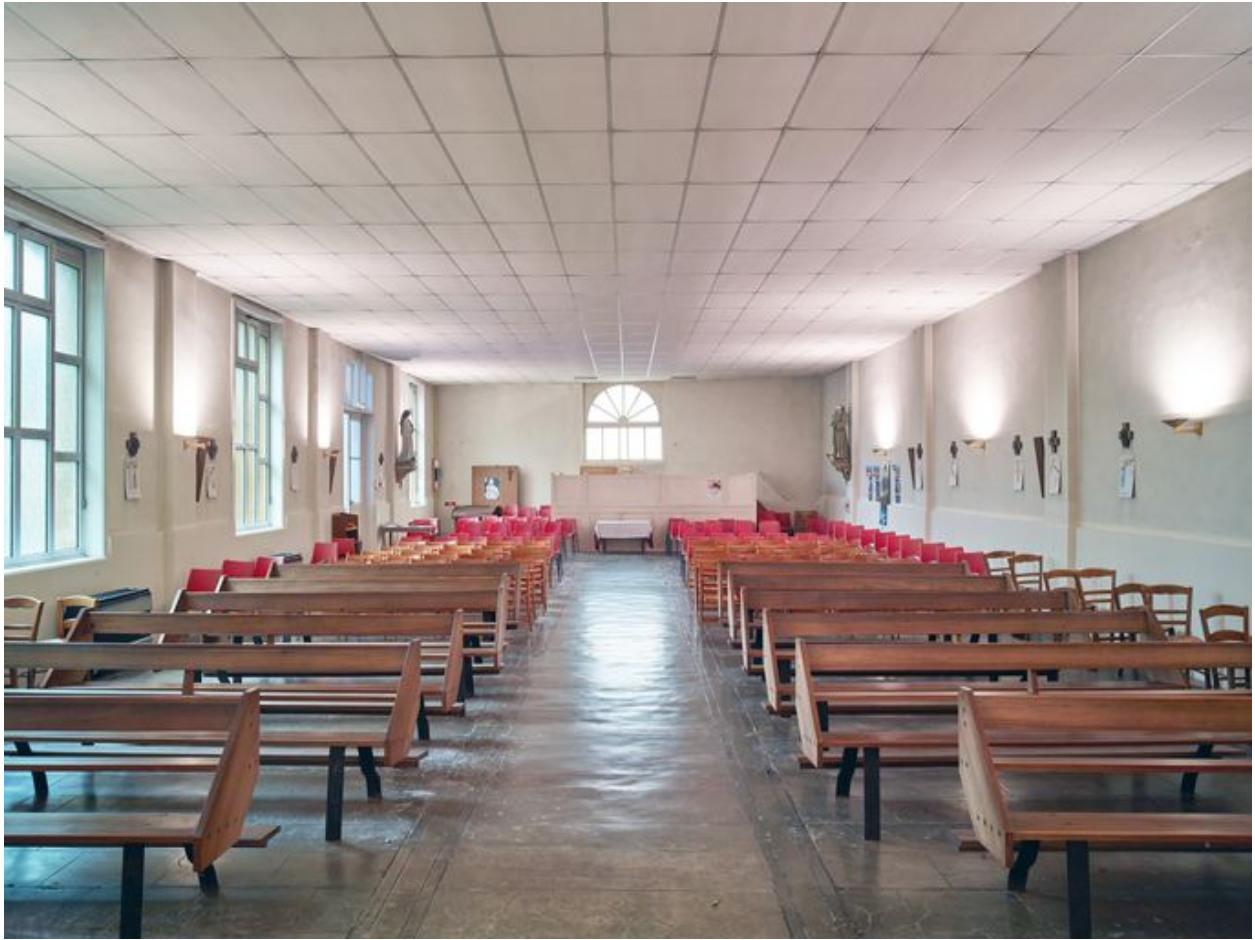
Vue générale depuis le chœur.