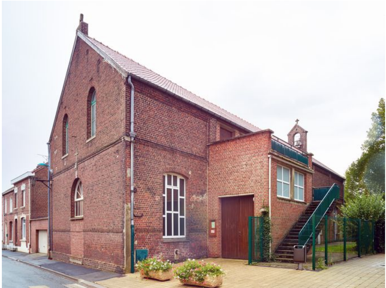
Élévation antérieure de l'église, de trois quart.