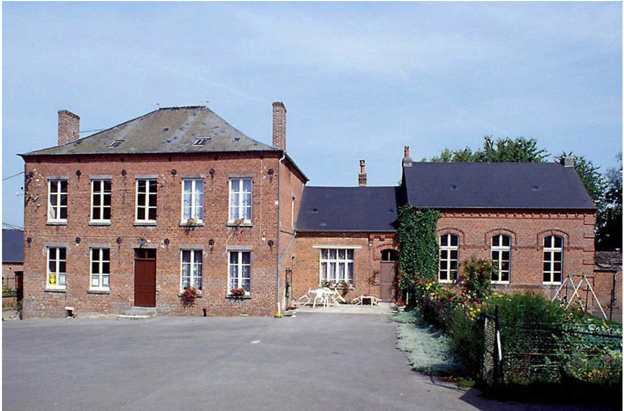
Vue d'ensemble des bâtiments : sur la gauche la mairie, sur la droite le logement de l'instituteur et la salle de classe.