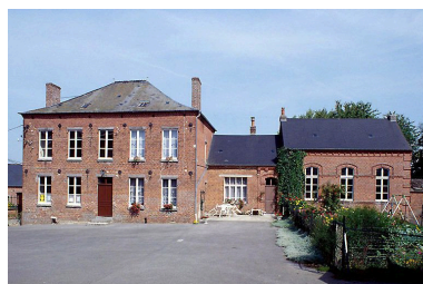
Vue d'ensemble des bâtiments : sur la gauche la mairie, sur la droite le logement de l'instituteur et la salle de classe. IVR22_19920201756ZA