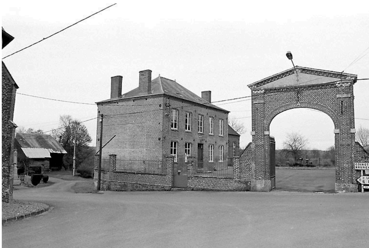
Mairie vue depuis l'ouest et portail d'entrée.