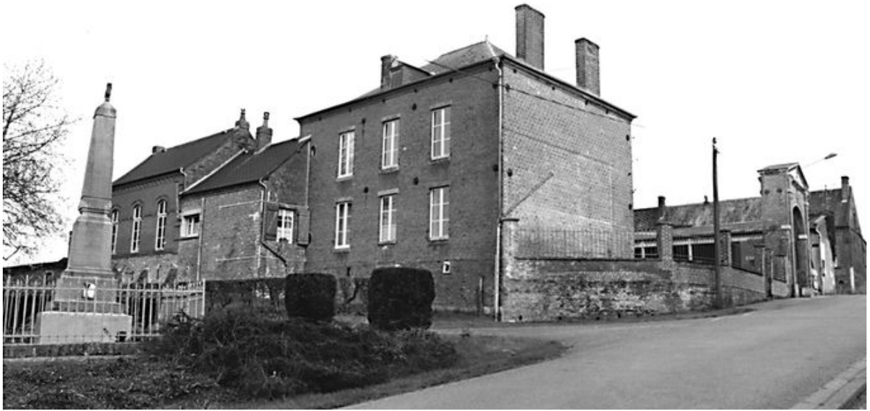
Elévation postérieure de la mairie et de la salle de classe.