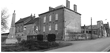
Elévation postérieure de la mairie et de la salle de classe.