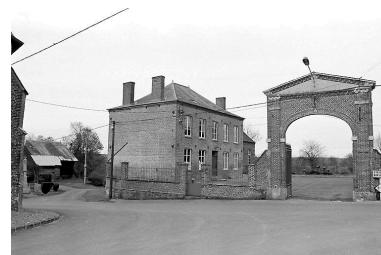
Mairie vue depuis l'ouest et portail d'entrée.