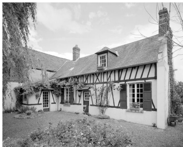
Logis. Vue générale. IVR22_19856000985V