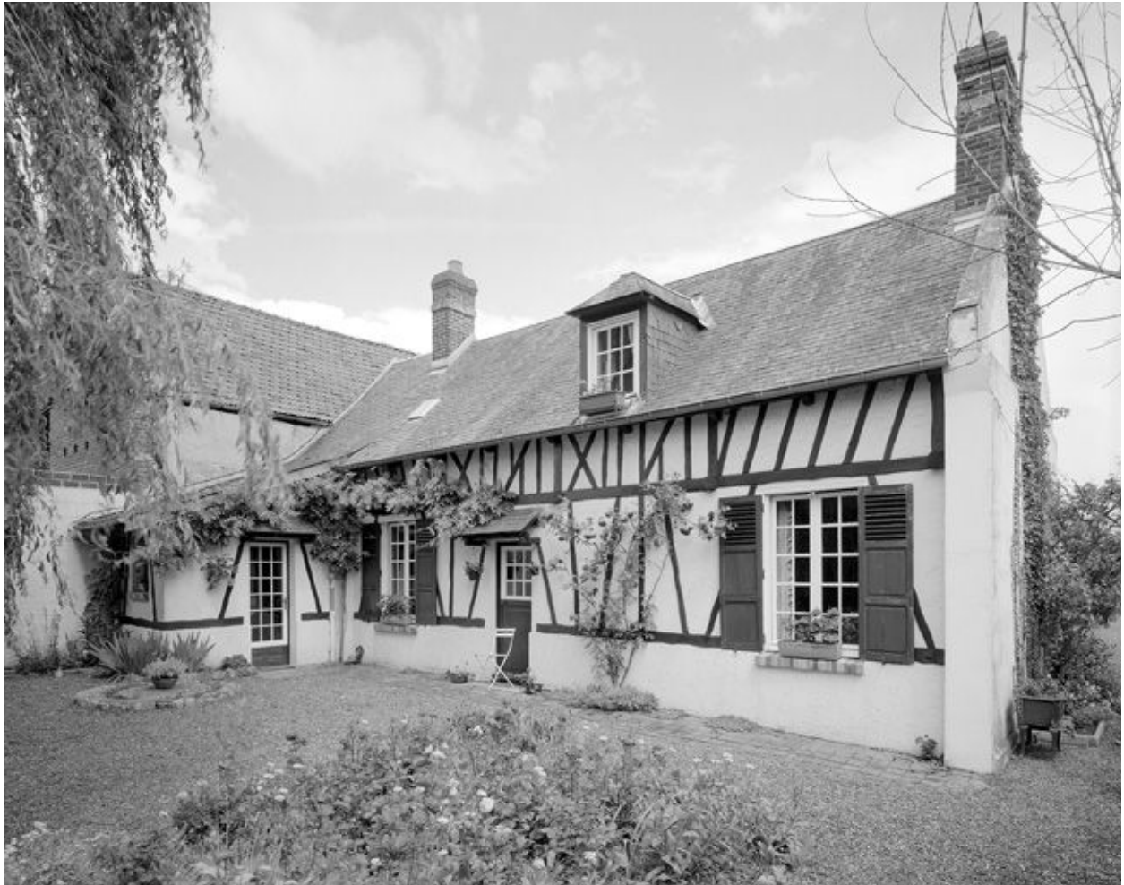
Logis. Vue générale.