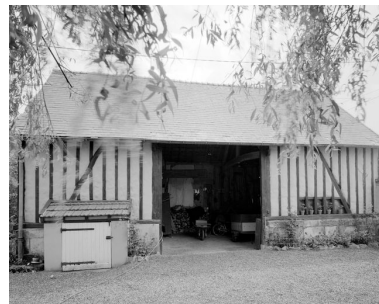
Grange. IVR22_19856000986V