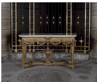
La seconde crédence, vue de face.