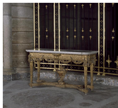
La seconde crédence, vue de trois-quarts.