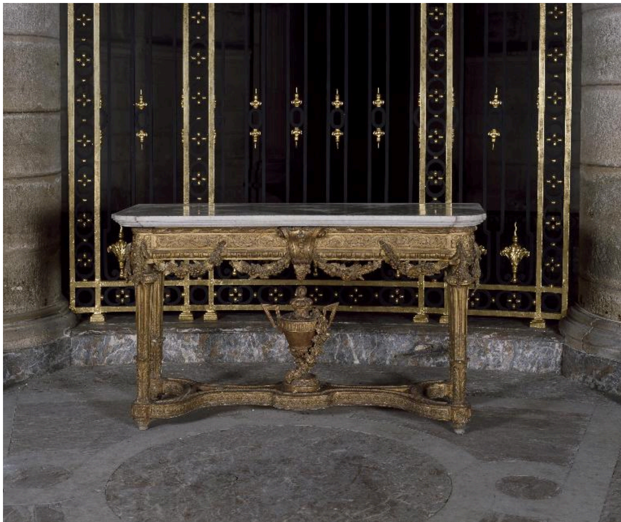
La seconde crédence, vue de face.