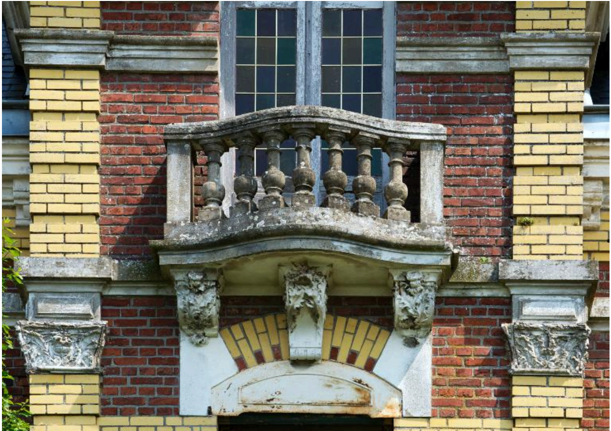
Détail du balcon de la façade sur rue.