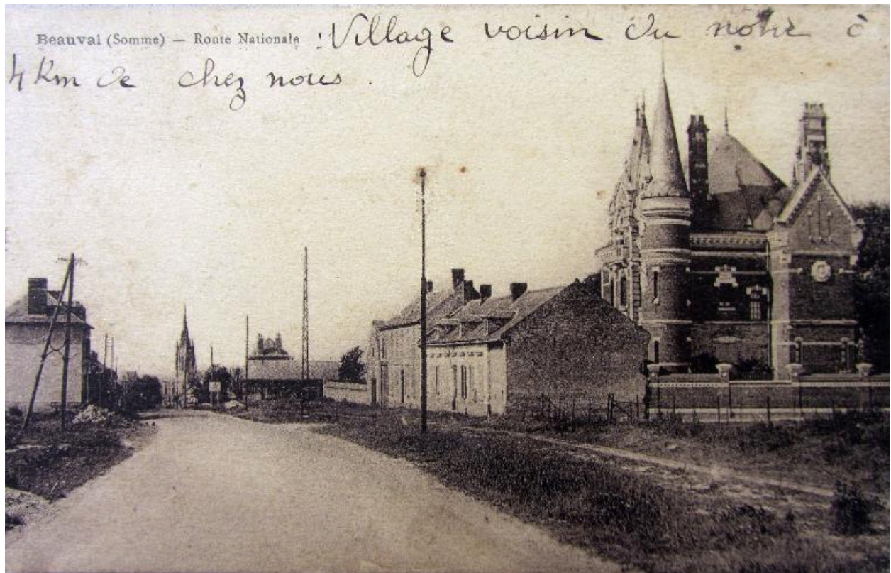
Vue de côté de la villa Hordequin depuis la route nationale, vers 1920 (Coll. part.).