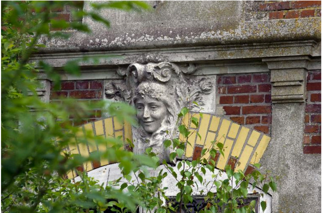
Détail du mascaron en agrafe.