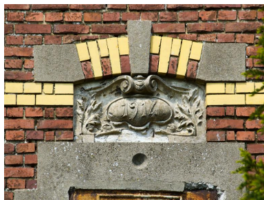
Détail du cartouche portant la date de 1914.