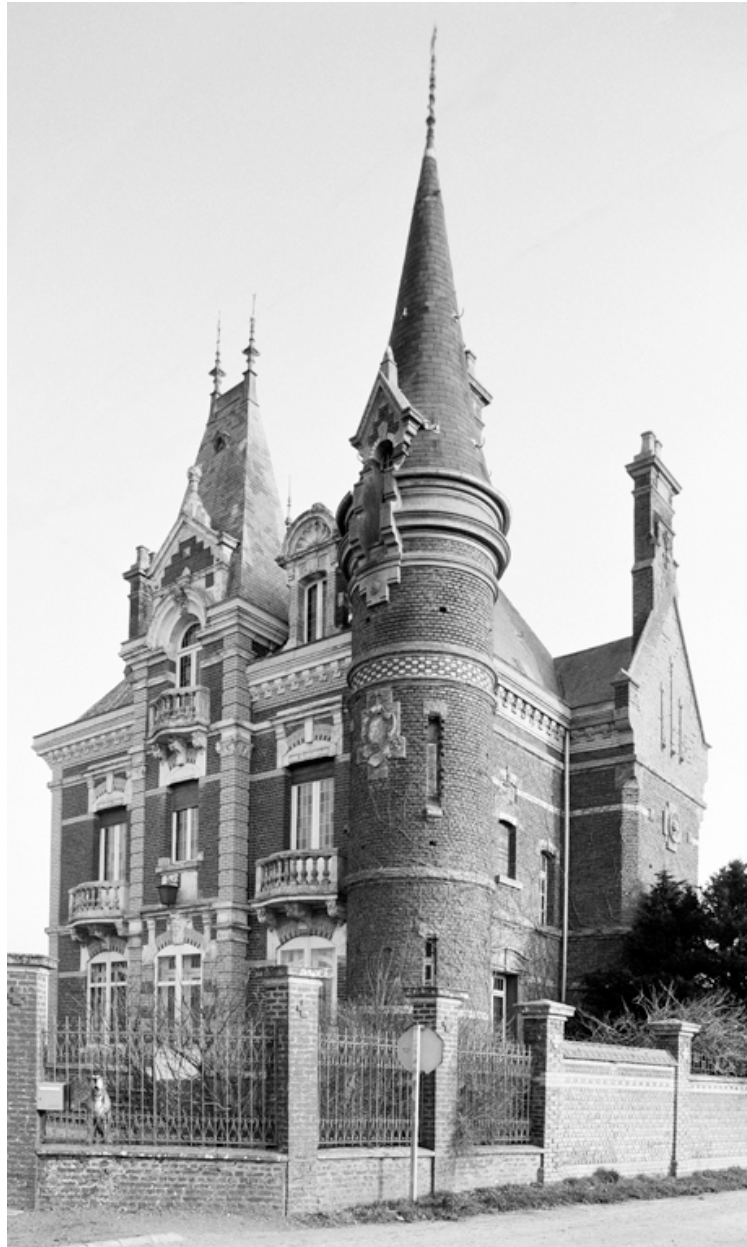
Vue du logement patronal en 1991.