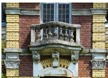
Détail du balcon de la façade sur rue.