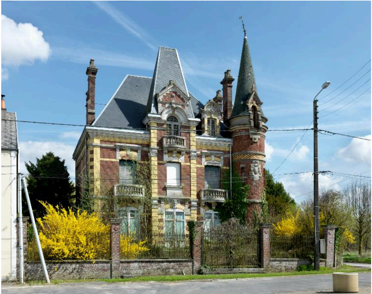
Vue d'ensemble sur rue, de face.

IVR22_20138000075NUC2A