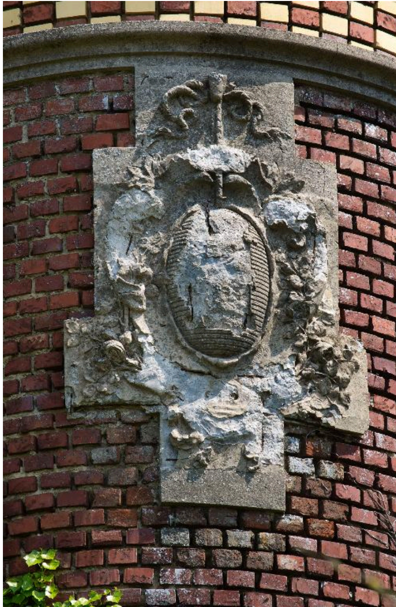
Détail des armoiries buchées.