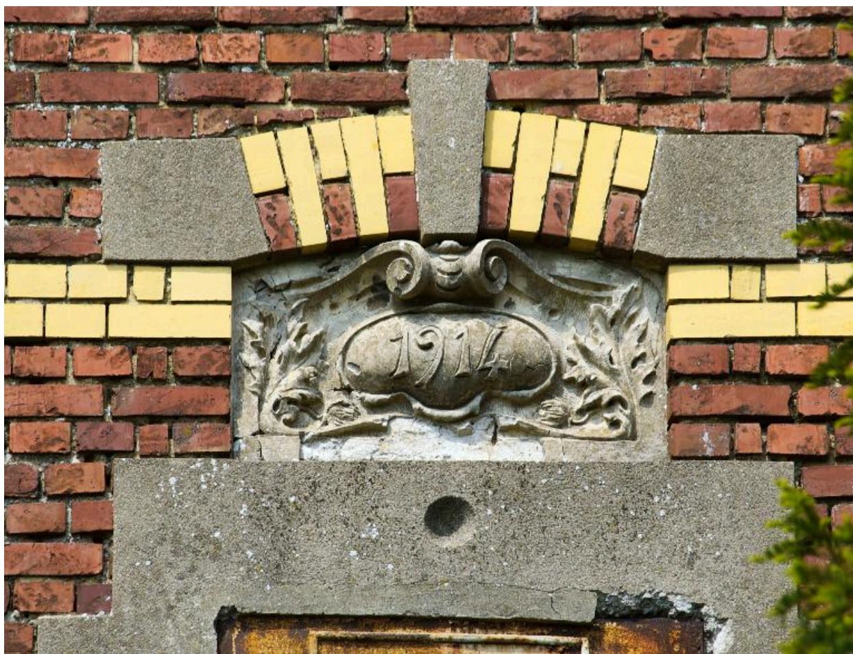
Détail du cartouche portant la date de 1914.