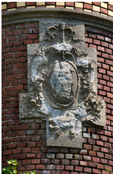
Détail des armoiries buchées.