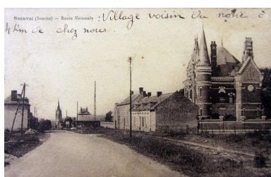
Vue de côté de la villa Hordequin depuis la route nationale, vers 1920.