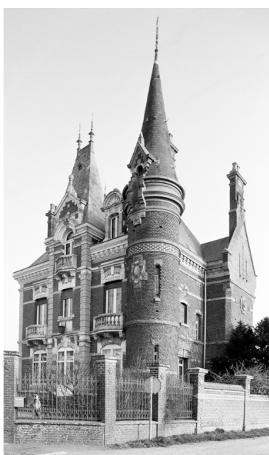
Vue du logement patronal en 1991.