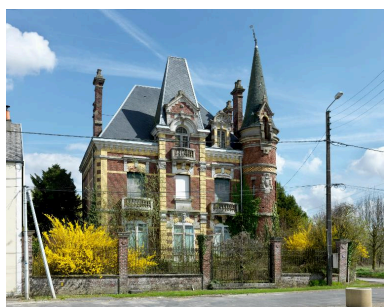
Vue d'ensemble sur rue, de face.