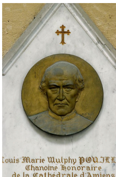
Vue de détail sur le médaillon. IVR22_20068000276NUCA