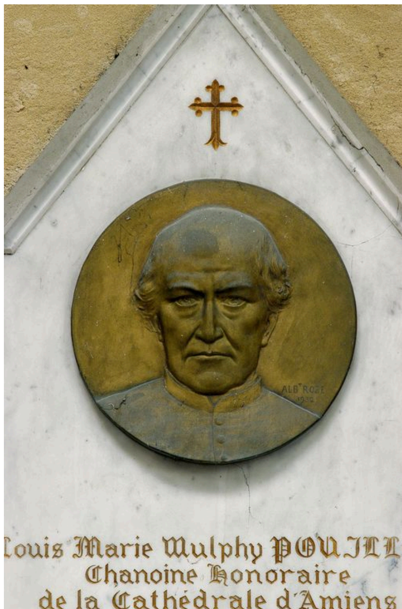
Vue de détail sur le médaillon.