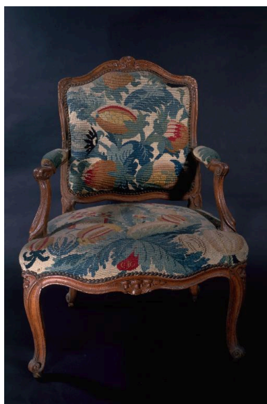
Vue d'un des fauteuils, de face. IVR22_19956000462XA