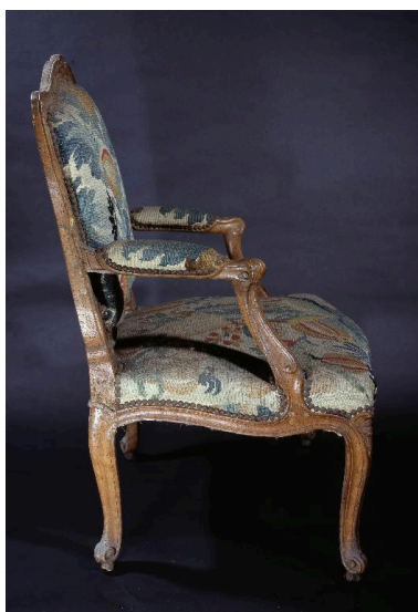
Vue d'un des fauteuils, de profil. IVR22_19956000463XA