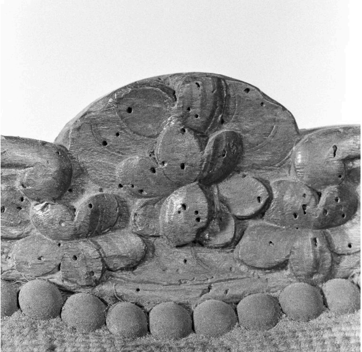
Vue de détail : motif au sommet du dossier.