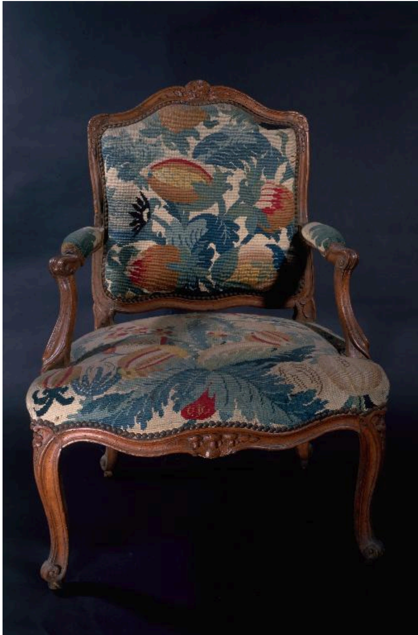
Vue d'un des fauteuils, de face.