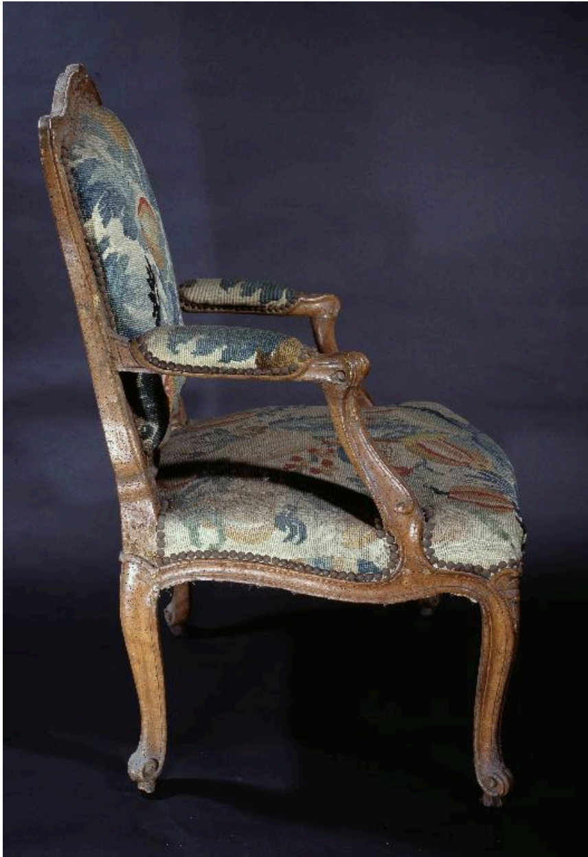
Vue d'un des fauteuils, de profil.