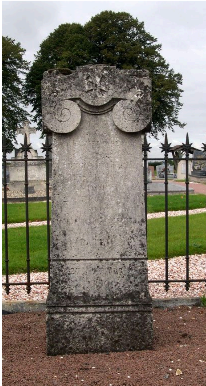
Vue de la face antérieure du monument.