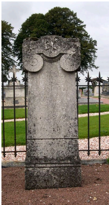
Vue de la face antérieure du monument.