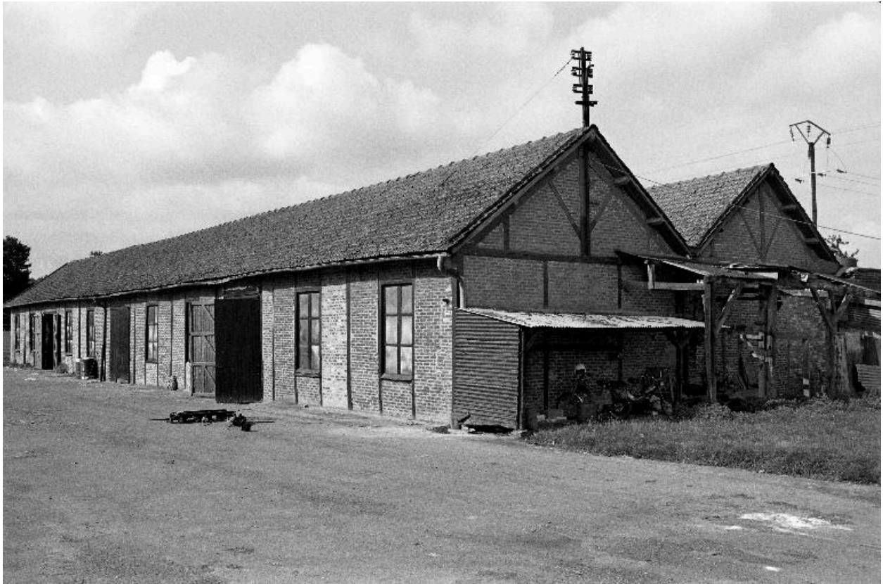
Atelier de battage, flanc ouest.