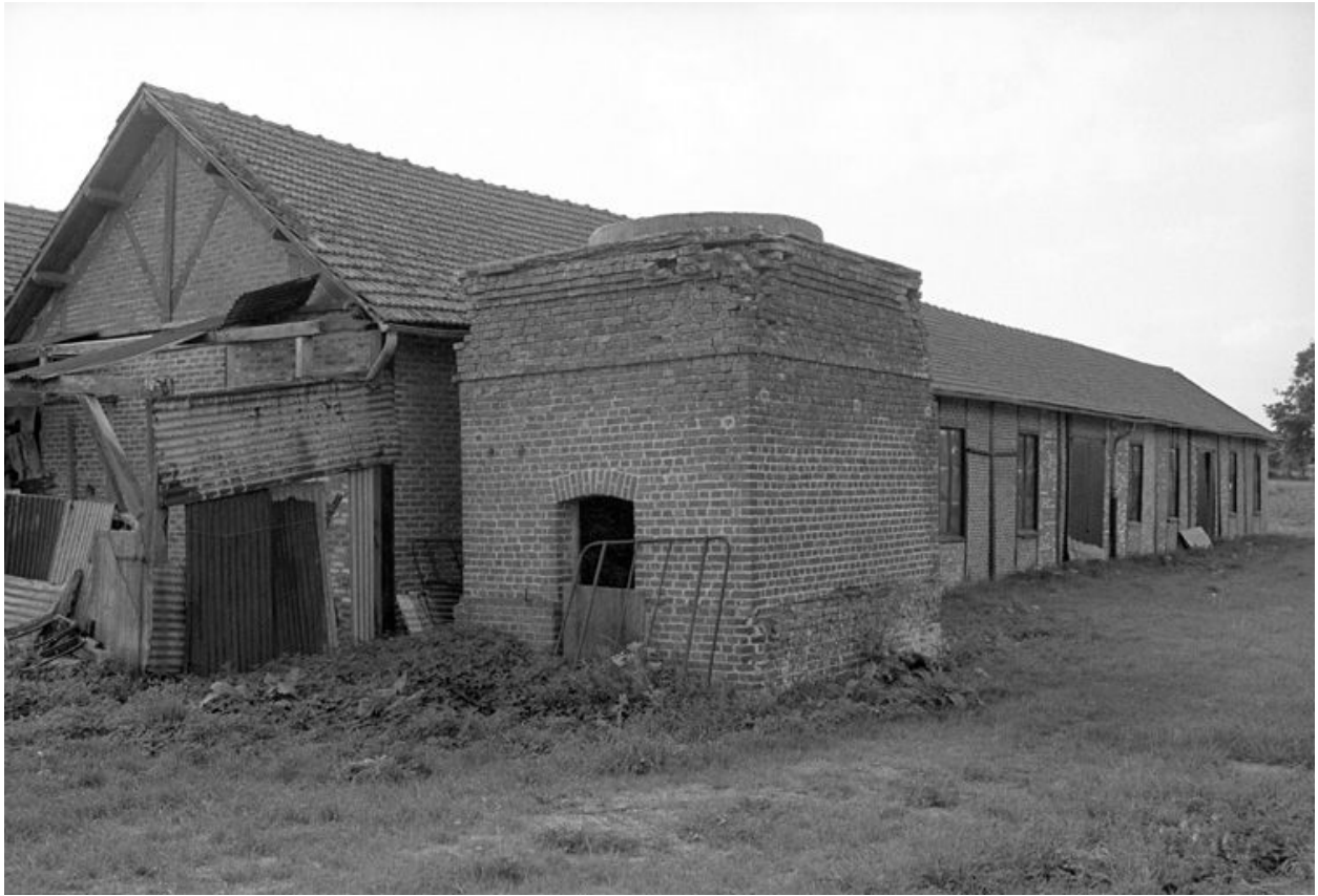
Atelier de battage, flanc ouest.