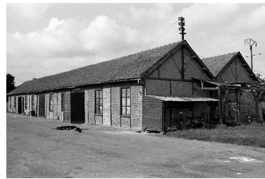
Atelier de battage, flanc ouest.