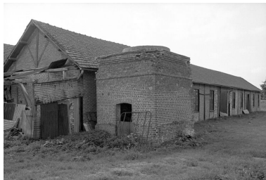
Atelier de battage, flanc ouest.