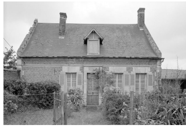
Logis. Elévation antérieure. IVR22_19846000959X