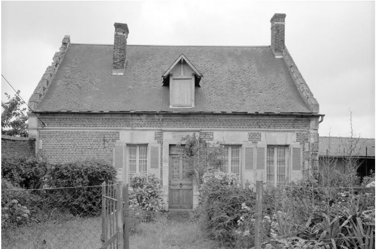
Logis. Elévation antérieure.