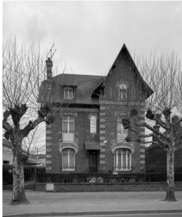
Élévation antérieure. IVR22_19866000062V