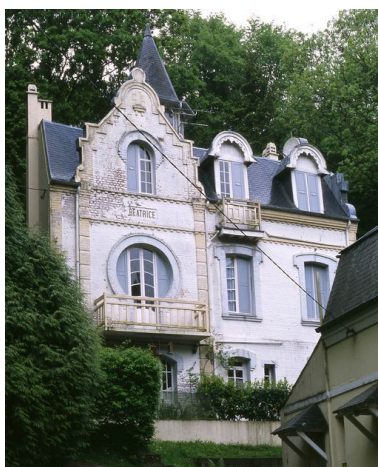
Vue d'ensemble depuis l'avenue. IVR22_20058001057XA