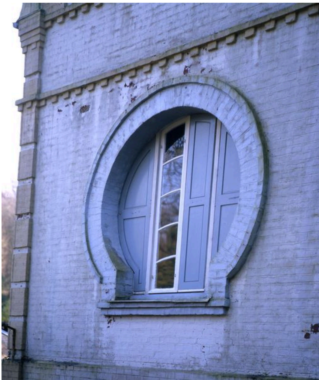
Détail de la baie de la façade latérale droite.