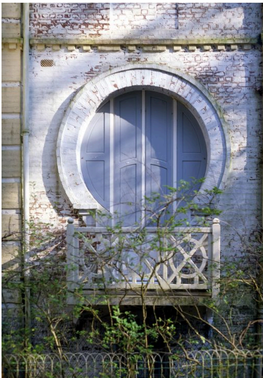
Détail d'une baie de la façade postérieure, devancée par un balcon en bois.