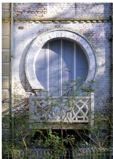
Détail d'une baie de la façade postérieure, devancée par un balcon en bois.