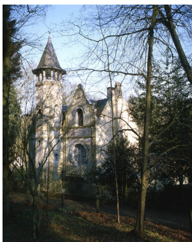
Elévation postérieure. IVR22_20058000142XA