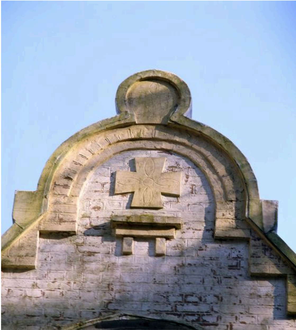
Détail d'un fronton-pignon en façade.