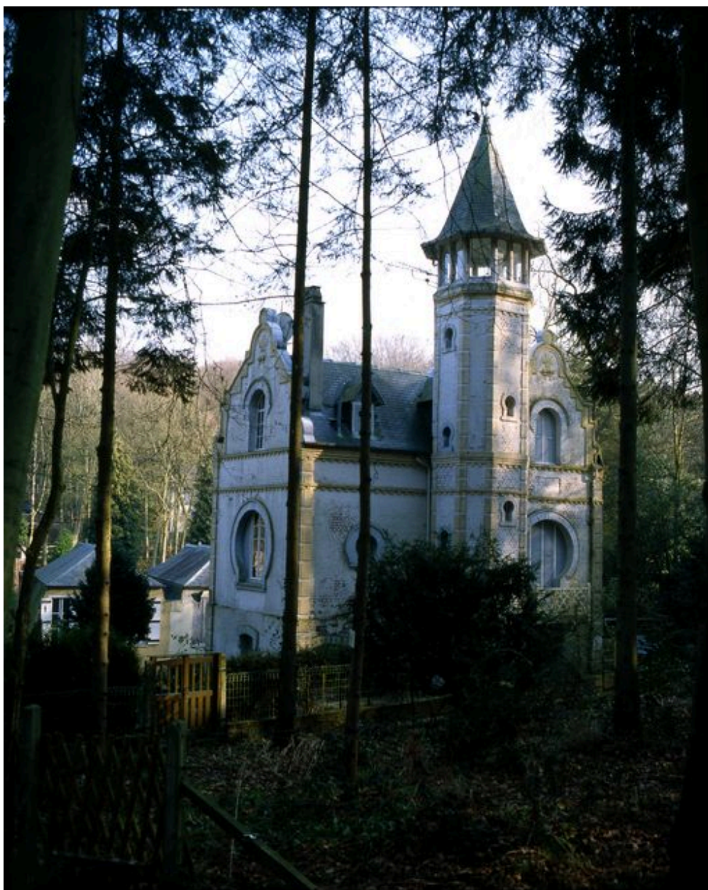
Vue de trois-quarts sur les élévations latérale droite et postérieure.