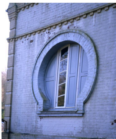
Détail de la baie de la façade latérale droite. IVR22_20058000146XA