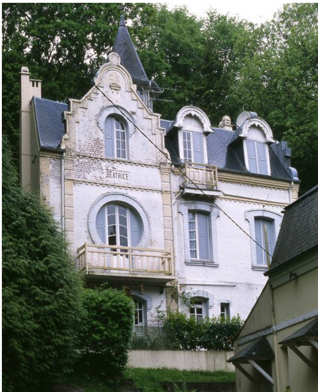
Vue d'ensemble depuis l'avenue.