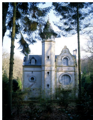
Elévation postérieure. IVR22_20058000143XA