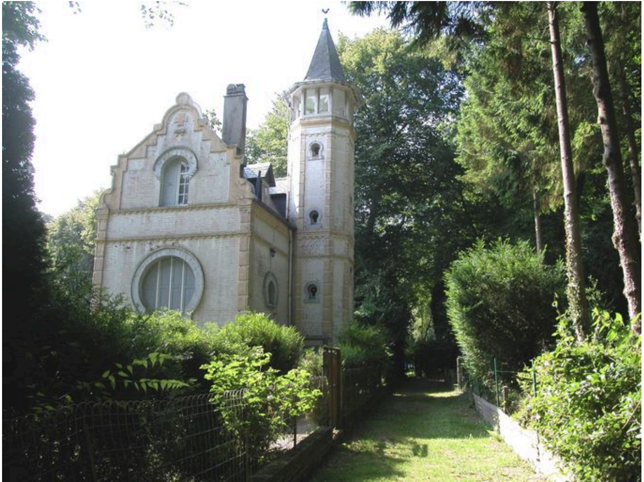
Vue d'ensemble depuis l'allée Marie.