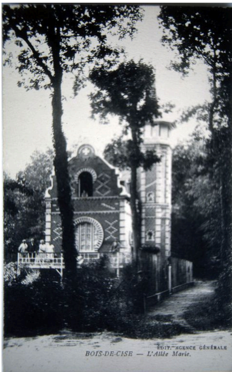
La maison vue depuis l'allée Marie, carte postale, 1er quart 20e siècle.