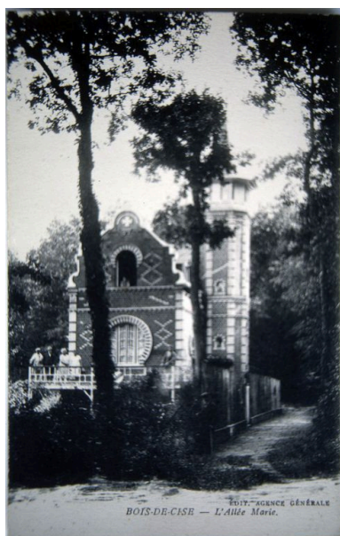
La maison vue depuis l'allée Marie, carte postale, 1er quart 20e siècle (coll. part.). IVR22_20058000542XAB