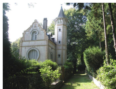
Vue d'ensemble depuis l'allée Marie. IVR22_20058003312NUCA