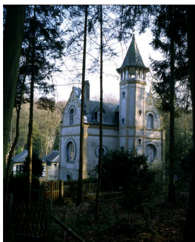
Vue de trois-quarts sur les élévations latérale droite et postérieure. IVR22_20058000144XA