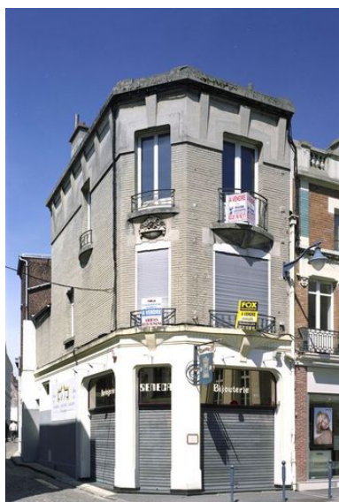
Vue générale. IVR31_20086200148XE