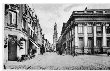
Rue Saint-Géry (actuellement Désiré-Delansorne).