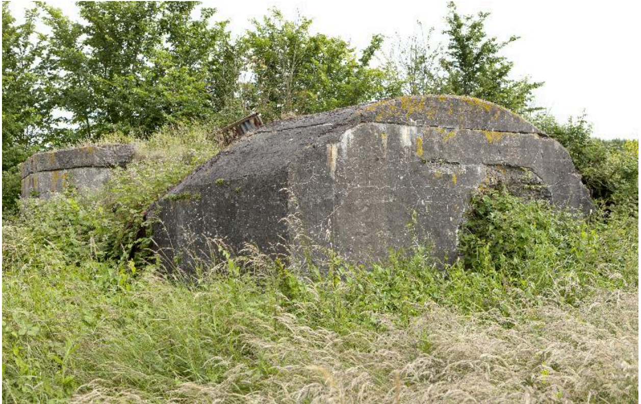
Vue générale vers le sud