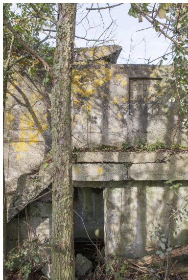
Elévation ouest, escalier, banquette de tir et cartouche IVR31_20155901991NUCA