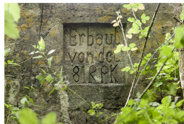
Elévation est, détail du cartouche IVR31_20145904054NUCA