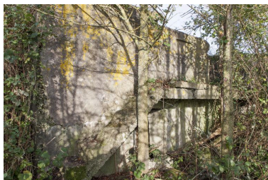
Elévation sud. Escalier menant à la banquette de tir