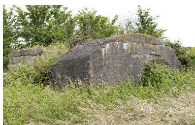
Vue générale vers le sud