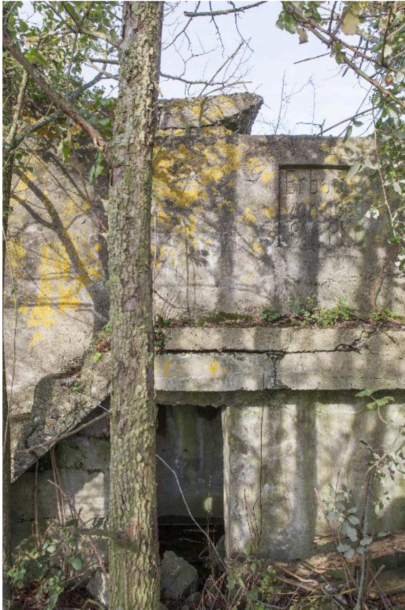
Elévation ouest, escalier, banquette de tir et cartouche