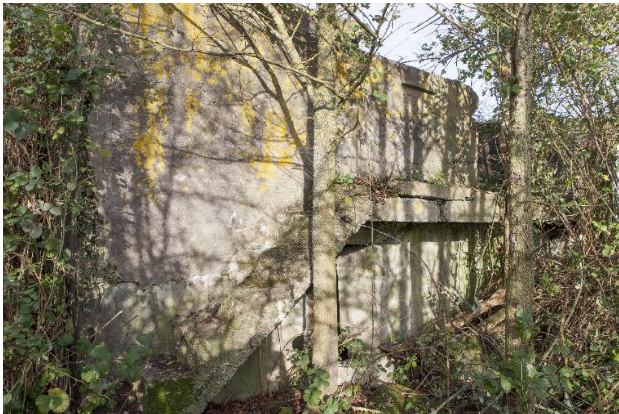
Elévation sud. Escalier menant à la banquette de tir