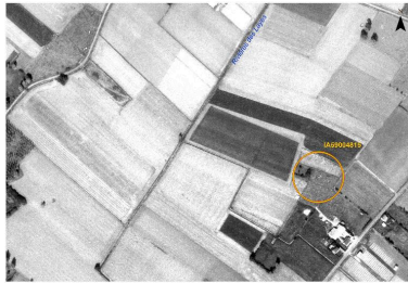
Situation de l'édifice (cercle orange). Montage d'après une photographie aérienne de 1978 (IGN, Geoportail). IVR32_20175900163NUCA