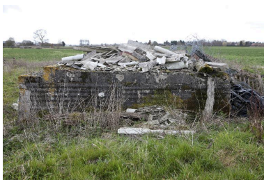
Vue latérale, vers l'ouest IVR31_20145904052NUCA