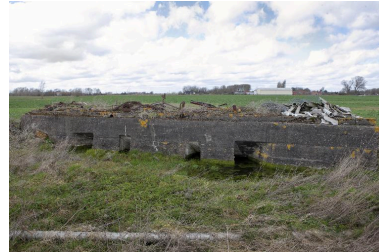
Elévation antérieure (sud-est). On aperçoit les entrées latérales et les resserres à mitrailleuses