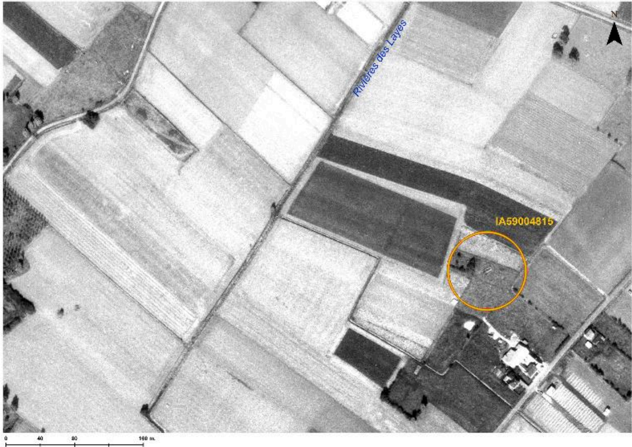
Situation de l'édifice (cercle orange). Montage d'après une photographie aérienne de 1978.