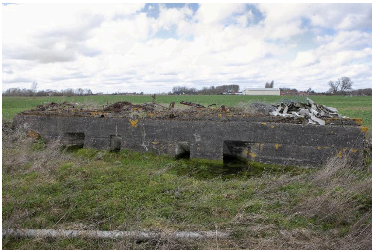
Elévation antérieure (sud-est). On aperçoit les entrées latérales et les resserres à mitrailleuses