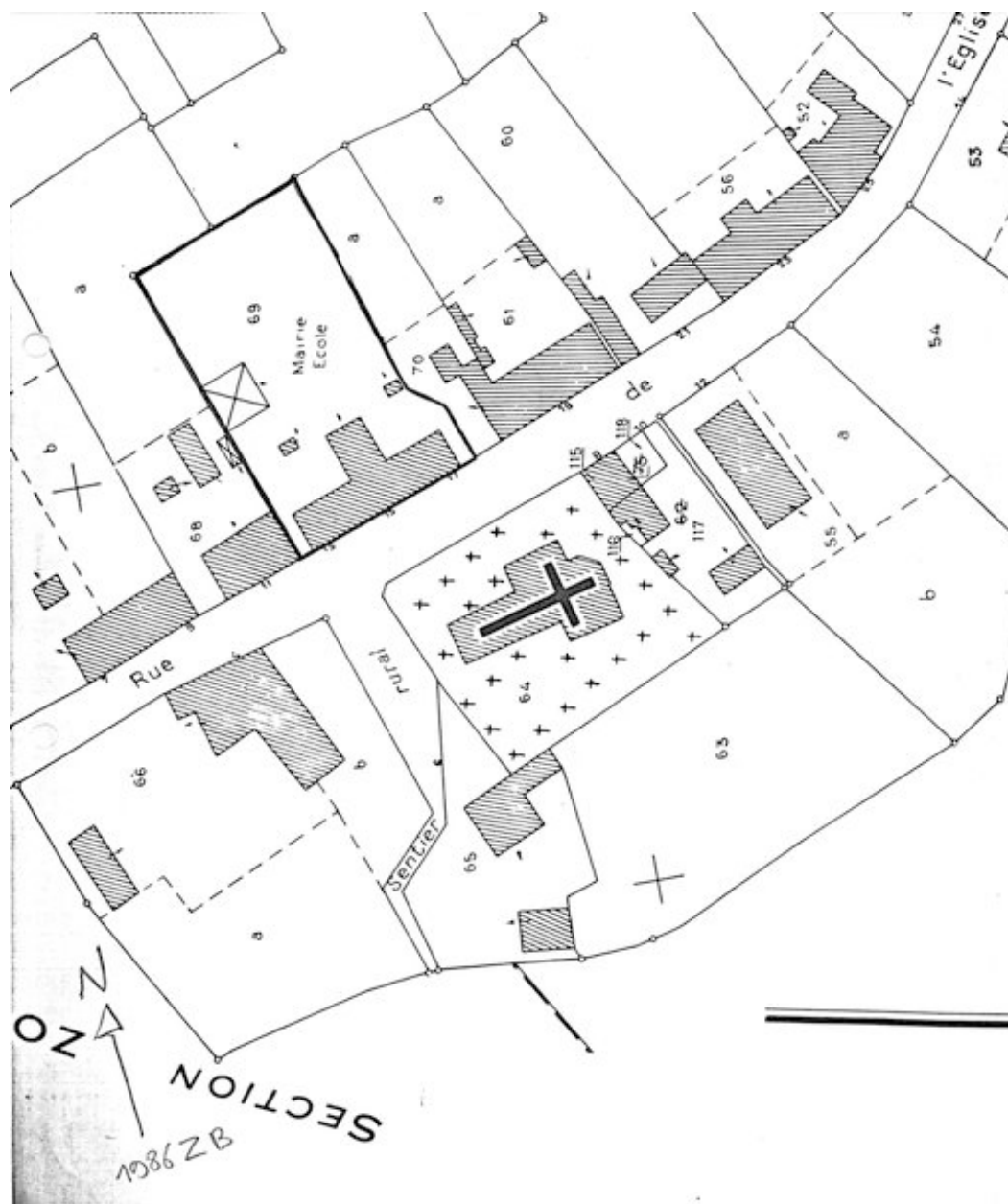
Plan de situation. Extrait du plan cadastral de 1986, section ZB.