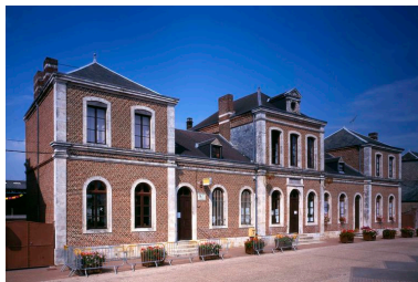
Vue générale depuis le sud ouest. IVR22_20000202252VA