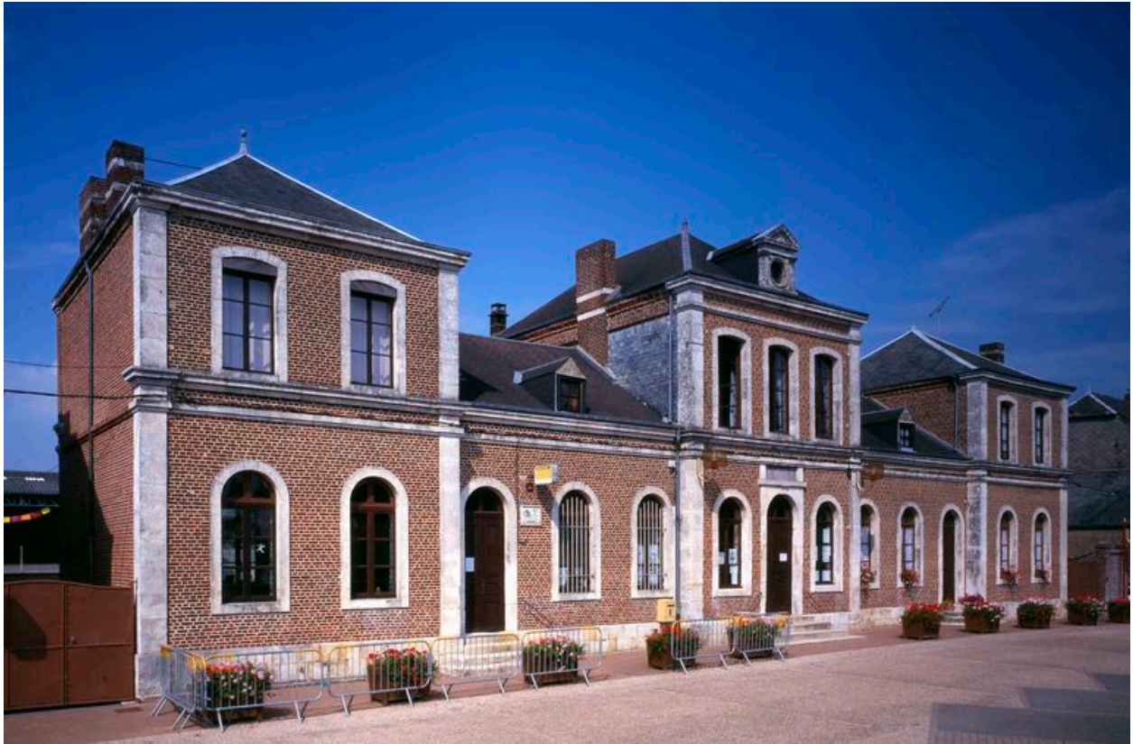
Vue générale depuis le sud ouest.