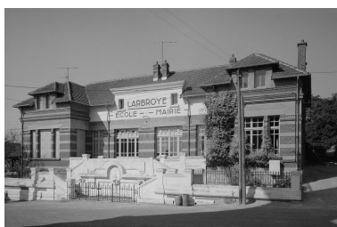
Elévation antérieure. IVR22_19856001006X

Plan de situation. Extrait du plan cadastral de 1982, section AC 15. IVR22_20096000127NUCA