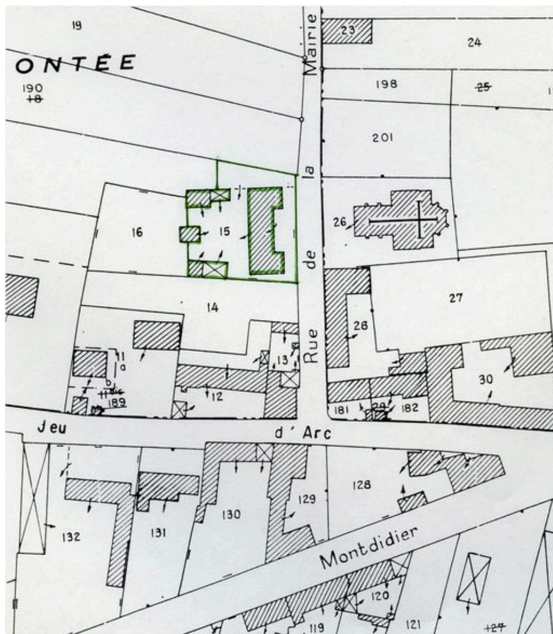
Plan de situation. Extrait du plan cadastral de 1982, section AC 15.