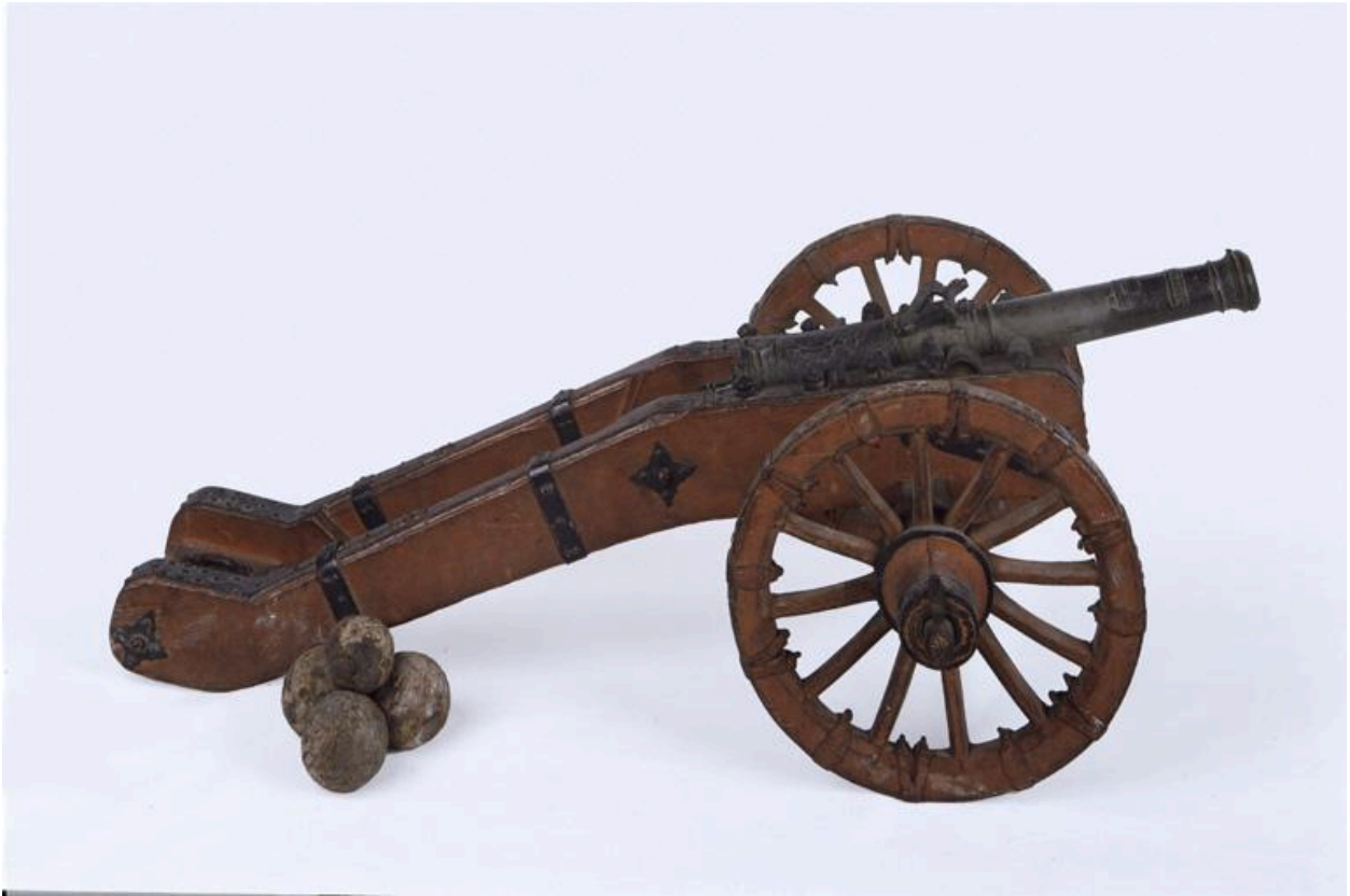
Vue générale du canon, dit l'Intrépide.