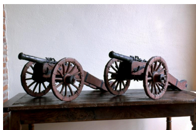
Vue des deux canons.