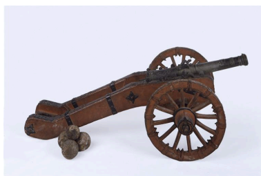
Vue générale du canon, dit l'Intrépide. Vue de profil du canon, dit l'Intrépide.