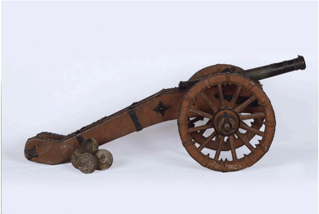
Vue de profil du canon, dit l'Intrépide.