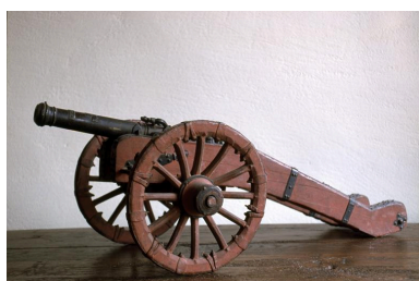
Vue du canon, dit le Furieux.