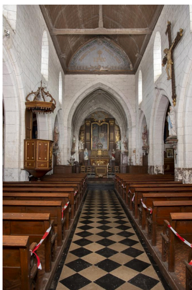
Vue de la nef depuis l'entrée occidentale. IVR32_20216000663NUCA