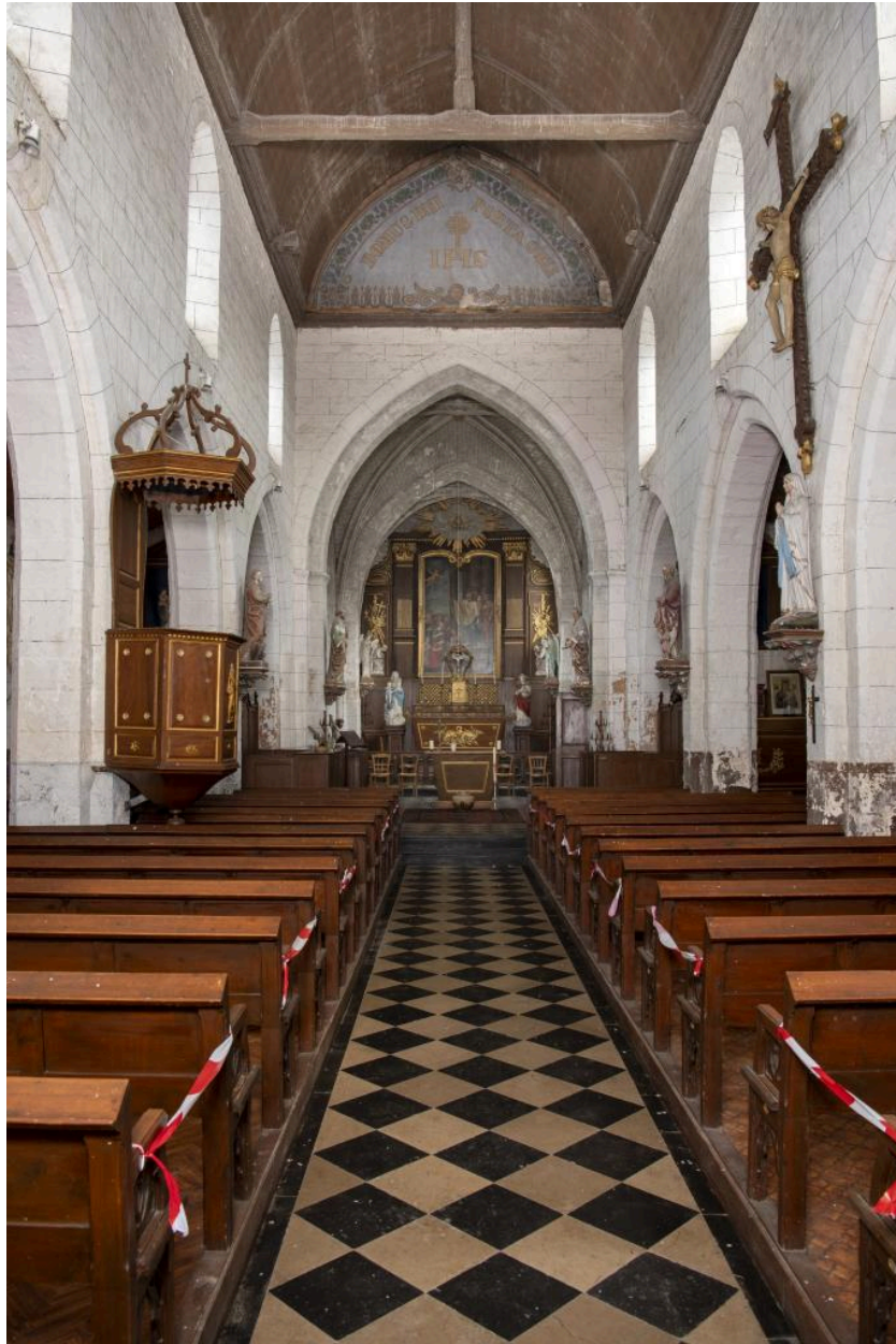
Vue de la nef depuis l'entrée occidentale.