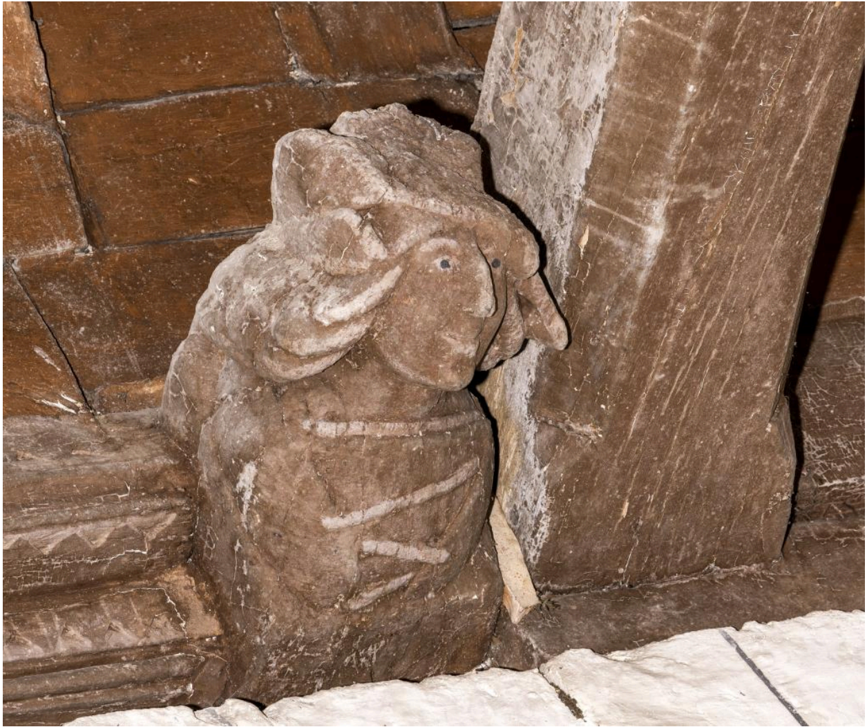
Détail d'un blochet sculpté: buste d'homme.