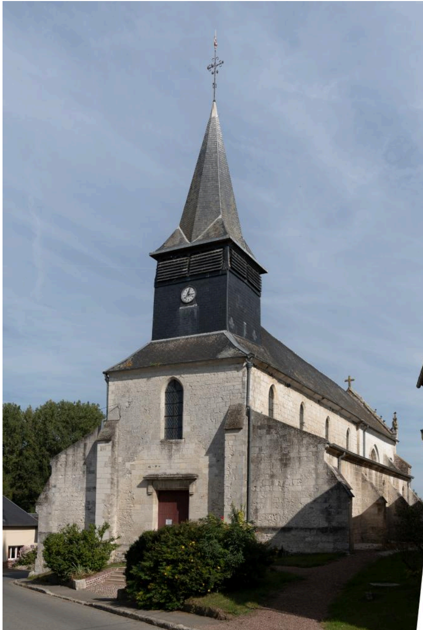
Vue de la façade occidentale.