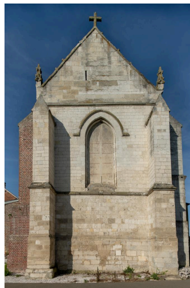
Vue du chevet plat avec sa baie aveugle.