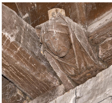
Détail d'un blochet sculpté: buste de femme. IVR32_20216000660NUCA