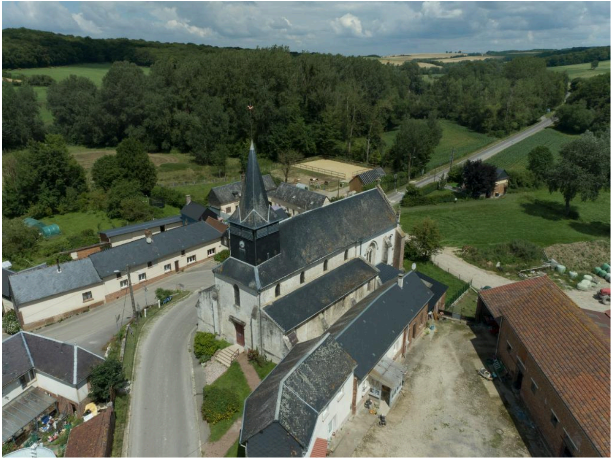
Vue générale aérienne de l'église depuis le sud-ouest.