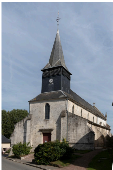
Vue de la façade occidentale. IVR32_20216000926NUCA