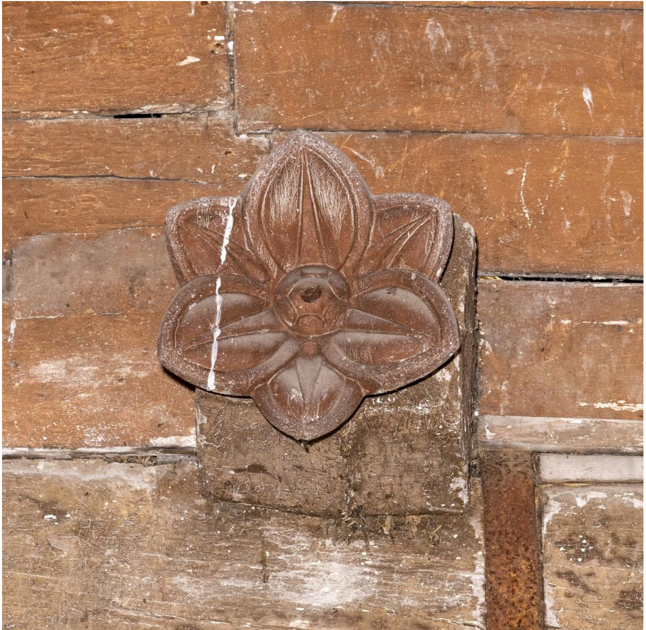
Détail d'un blochet sculpté: fleur.