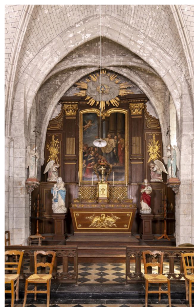
Vue du chœur. IVR32_20216000664NUCA