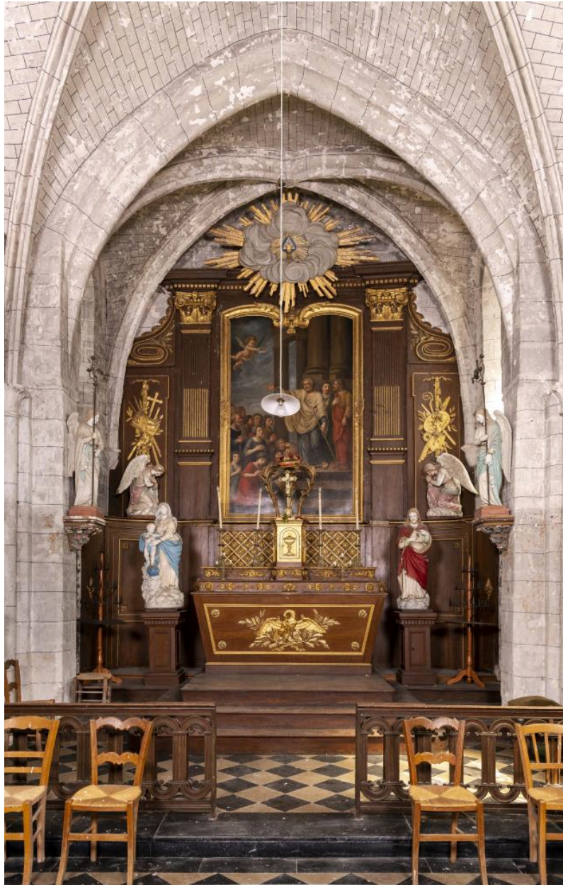
Vue du chœur.