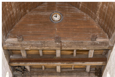
Vue du premier étage du clocher avec blochets sculptés. IVR32_20216000657NUCA