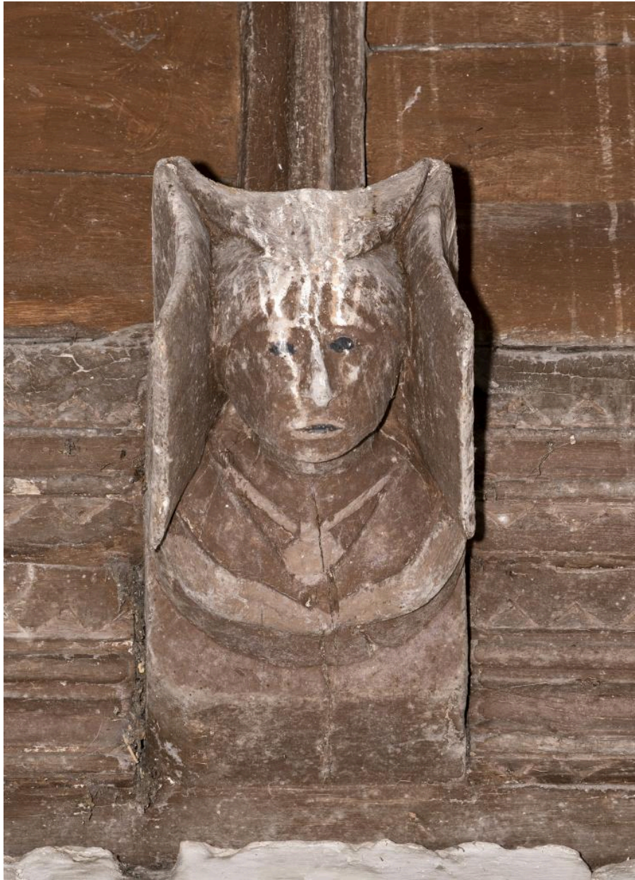
Détail d'un blochet sculpté: buste de femme.