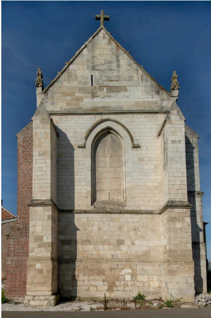
Vue du chevet plat avec sa baie aveugle.