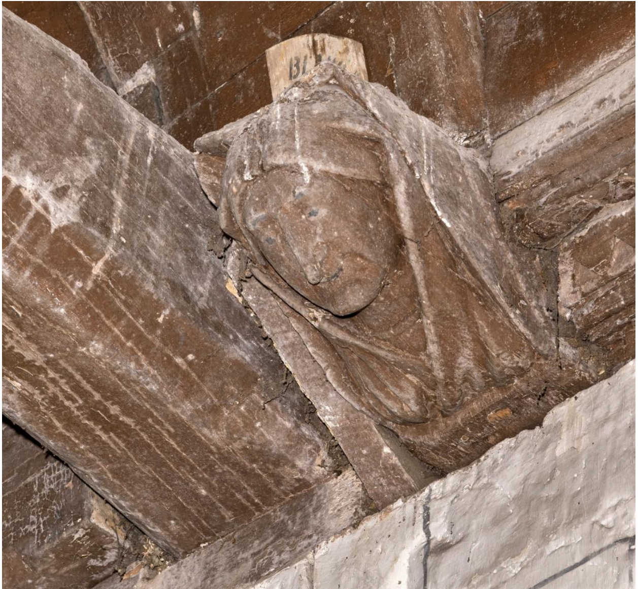
Détail d'un blochet sculpté: buste de femme.