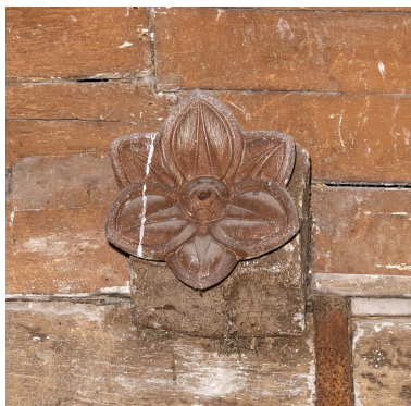
Détail d'un blochet sculpté: fleur.