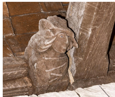
Détail d'un blochet sculpté: buste d'homme.