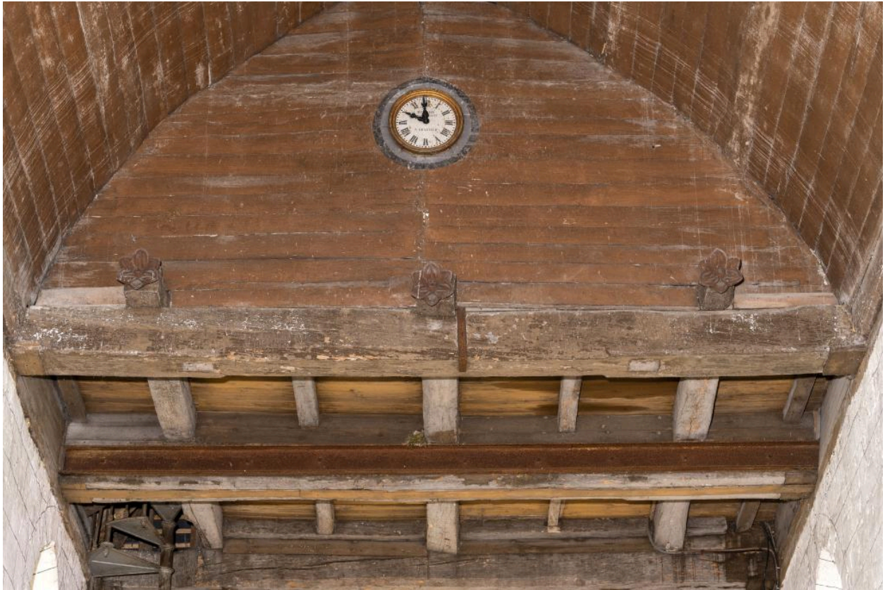
Vue du premier étage du clocher avec blochets sculptés.