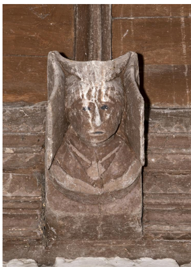
Détail d'un blochet sculpté: buste de femme.