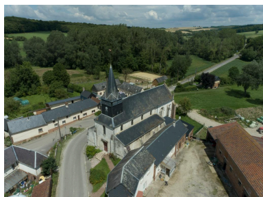
Vue générale aérienne de l'église depuis le sud-ouest.