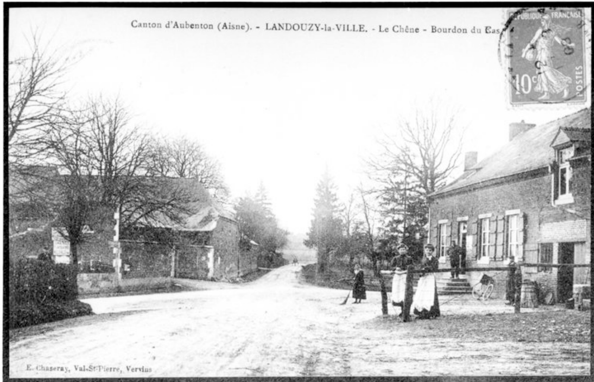
Vue des fermes à l'entrée du hameau du Chêne-Bourdon-de-Bas (AP).