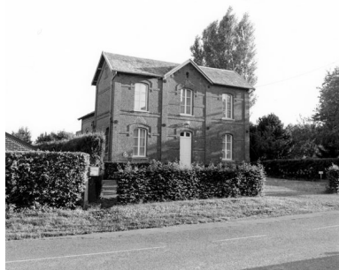
Ancienne école communale, 32 hameau de la Cense-des-Nobles IVR22_19980202394Z