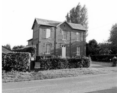
Ancienne école communale, 32 hameau de la Cense-des-Nobles