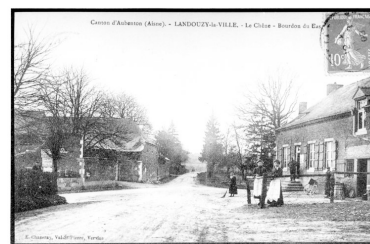
Vue des fermes à l'entrée du hameau du Chêne-Bourdon-de-Bas (AP). IVR22_19980202489ZB