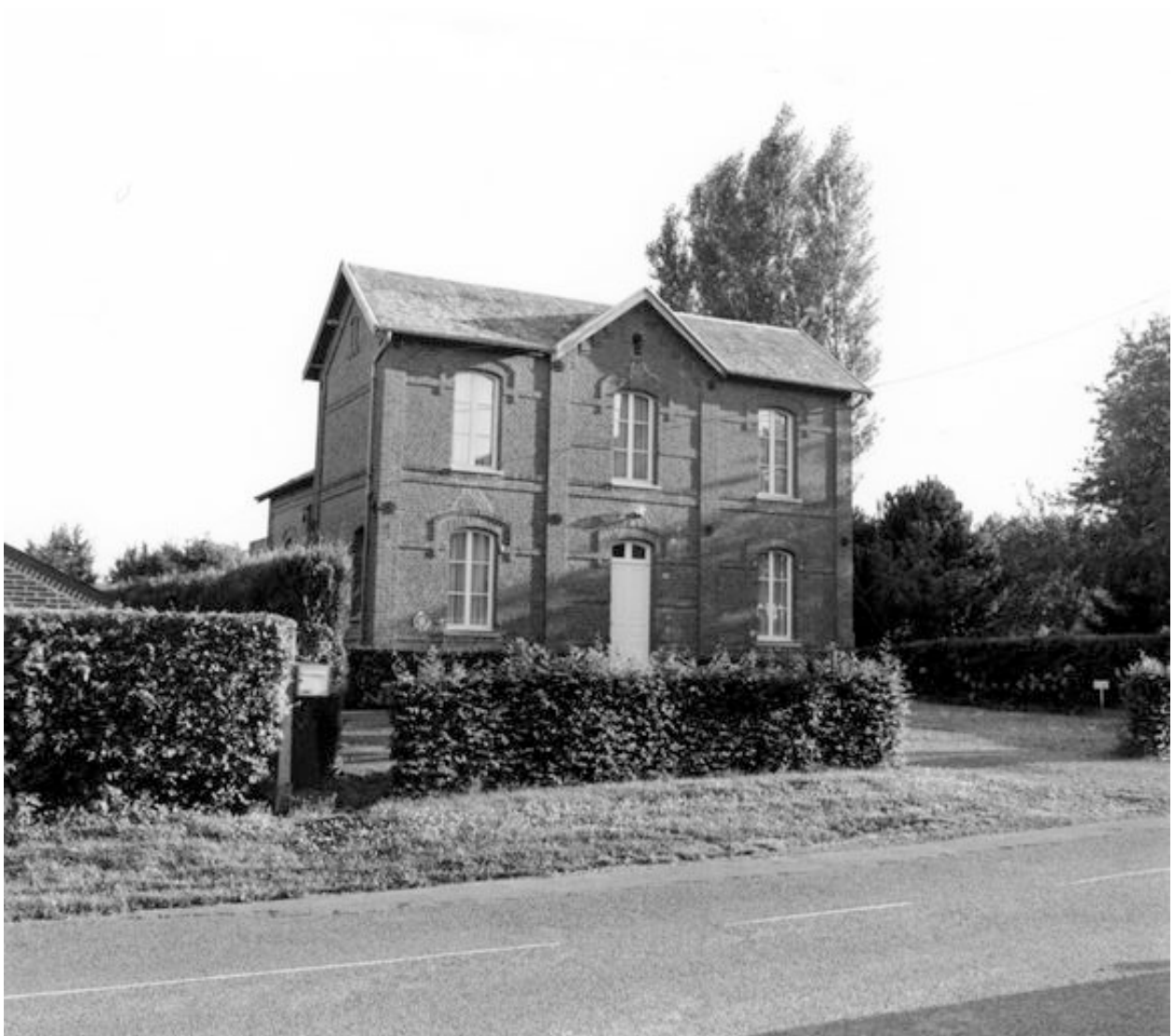
Ancienne école communale, 32 hameau de la Cense-des-Nobles