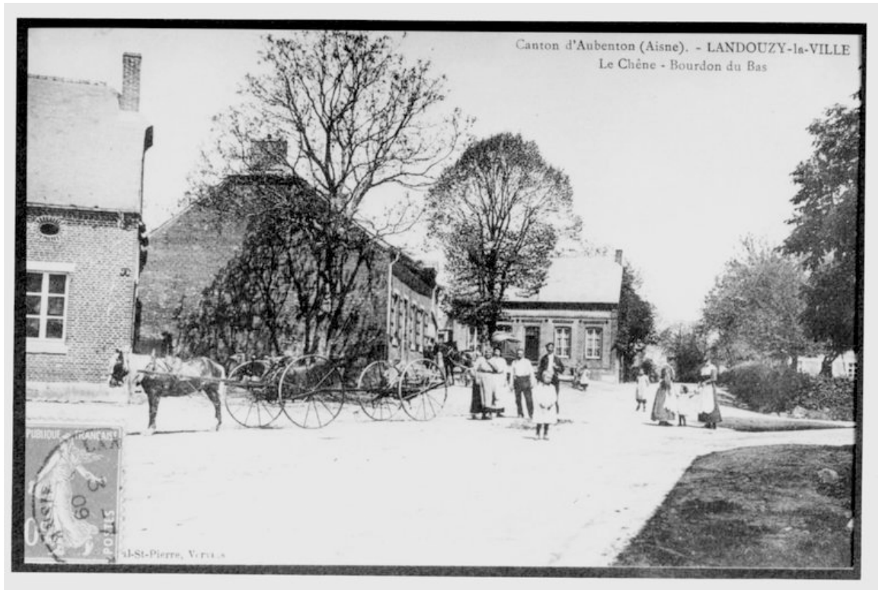
Vue des fermes à l'entrée du hameau du Chêne-Bourdon-de-Bas, depuis le carrefour (AP).