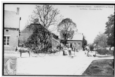
Vue des fermes à l'entrée du hameau du Chêne-Bourdon-de-Bas, depuis le carrefour (AP).