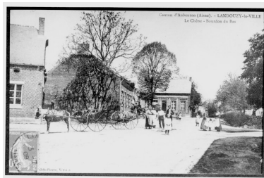
Vue des fermes à l'entrée du hameau du Chêne-Bourdon-de-Bas, depuis le carrefour (AP).