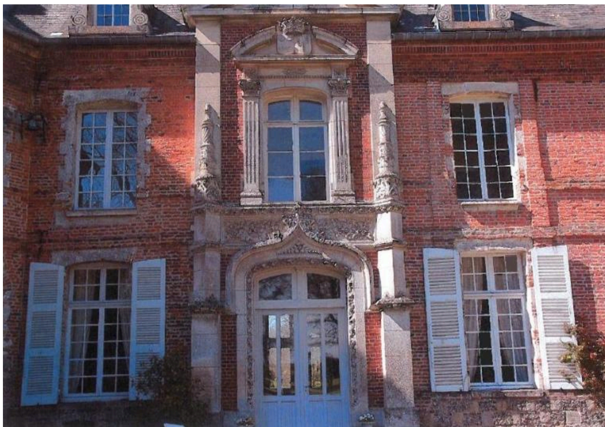
Travée centrale de la façade postérieure.