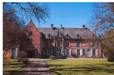
Façade postérieure.