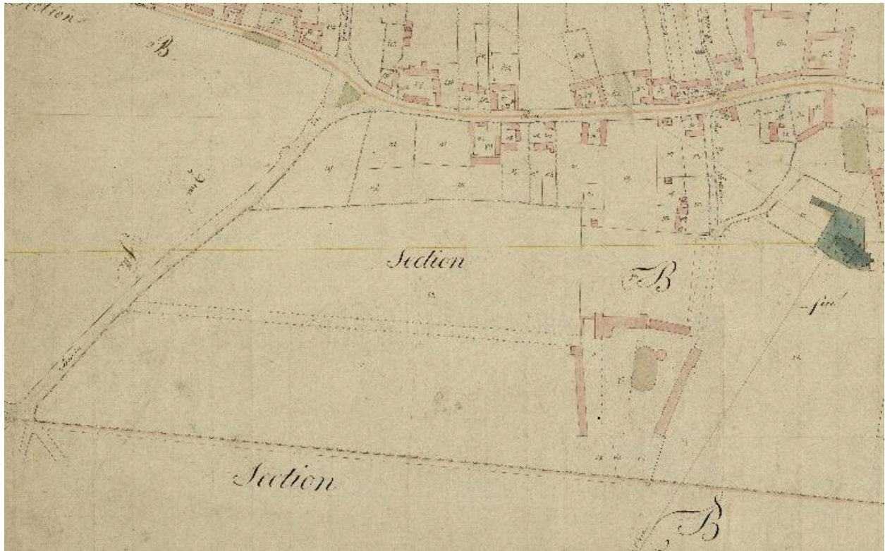
Détail du cadastre napoléonien de 1825 (AD Somme ; 3 P 1513/3).