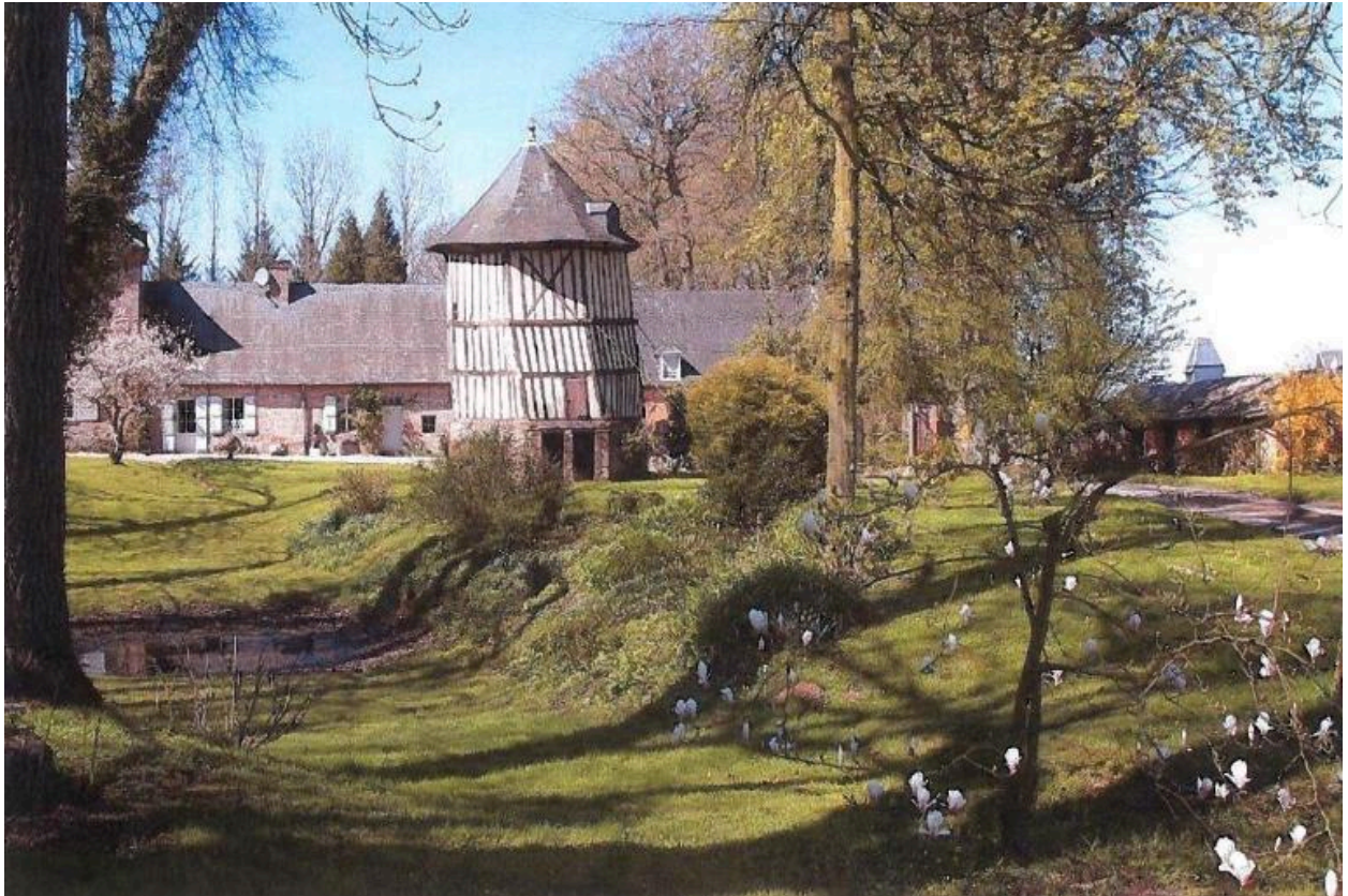
Jardin et pigeonnier.