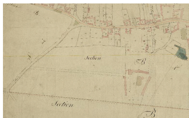
Détail du cadastre napoléonien de 1825 (AD Somme ; 3 P 1513/3).