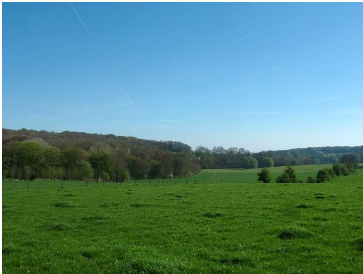
Le vallon dit le Fond du Quin à l'orée du bois de Martaineville.