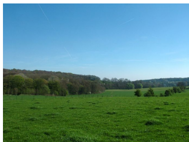
Le vallon dit le Fond du Quin à l'orée du bois de Martaineville.