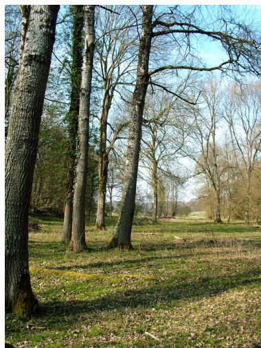
Site du hameau aujourd'hui boisé.