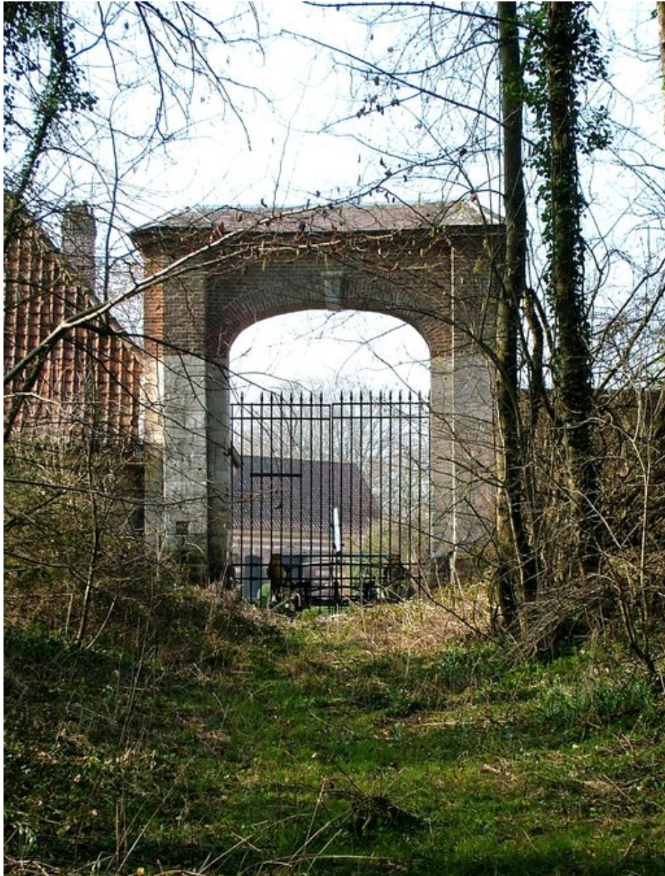
Allée menant au portail du château.