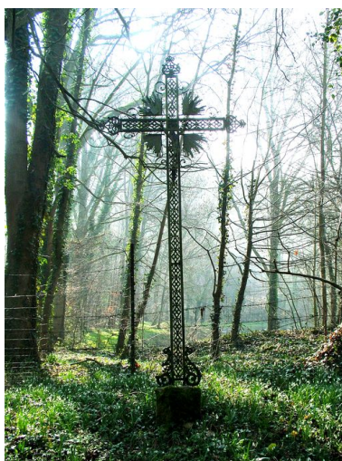
Croix érigée par la famille Roussel, fin du 19e siècle.