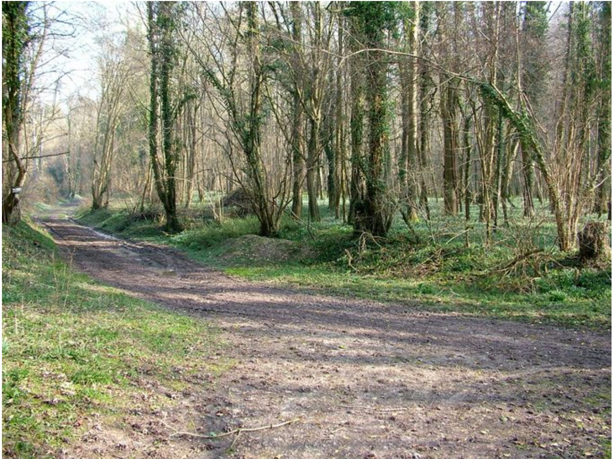
Ancienne rue de Houdencourt, dite chemin des Postes.