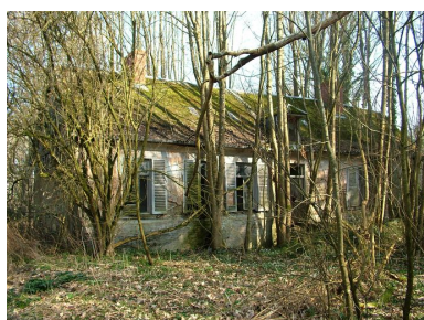
Ancien presbytère.