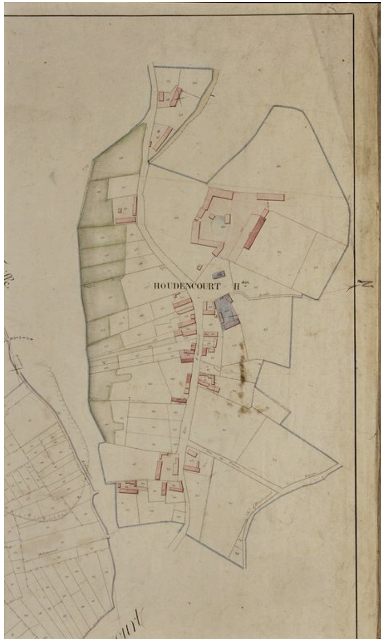
Hameau de Houdencourt, détail du plan cadastral, section B, par Mercher et Fauvel, 1833 (AD Somme ; 3P 1362/4).