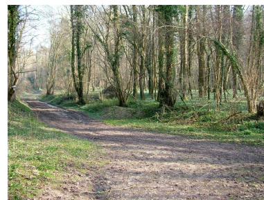
Ancienne rue de Houdencourt, dite chemin des Postes. IVR22_20118001077NUCA