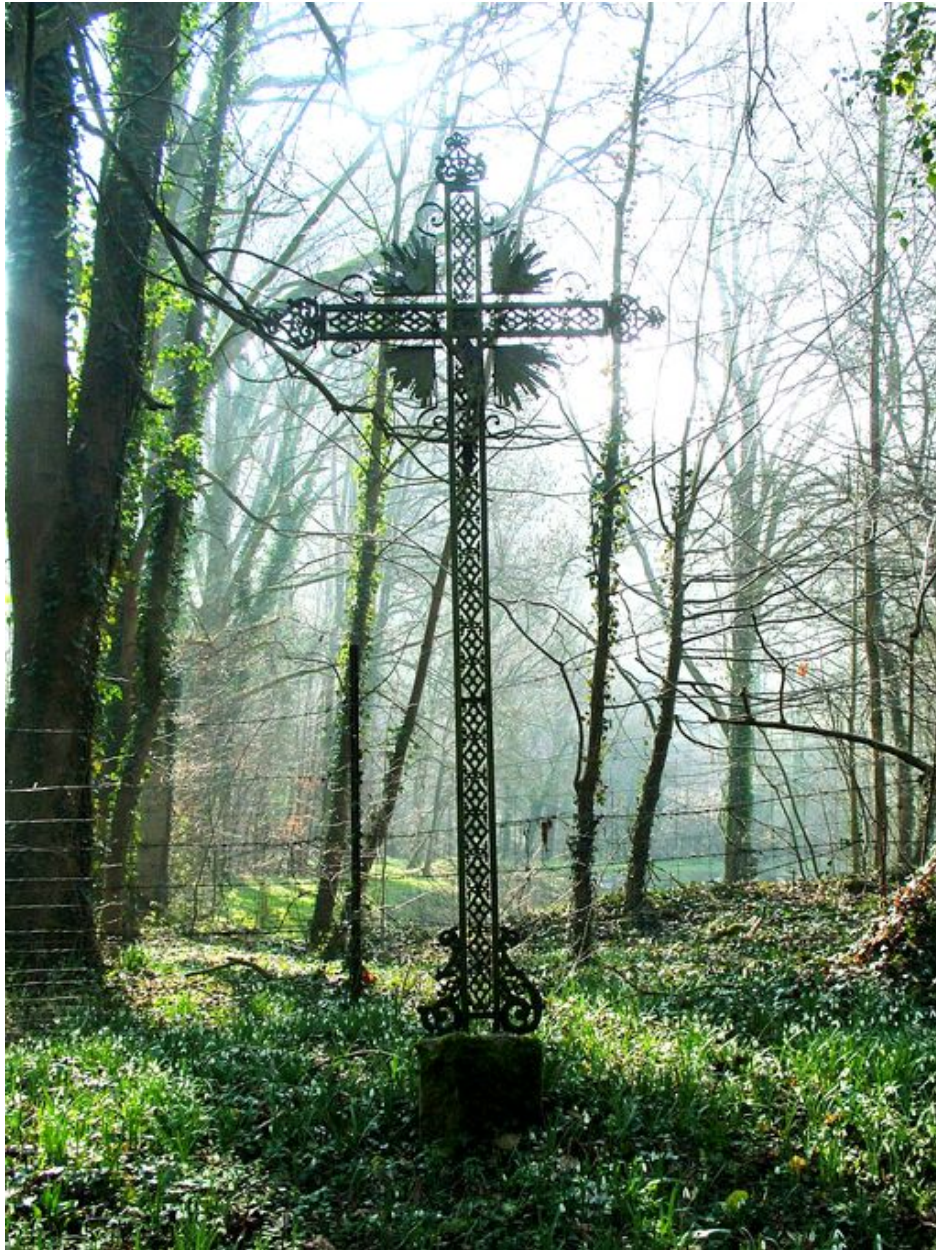
Croix érigée par la famille Roussel, fin du 19e siècle.