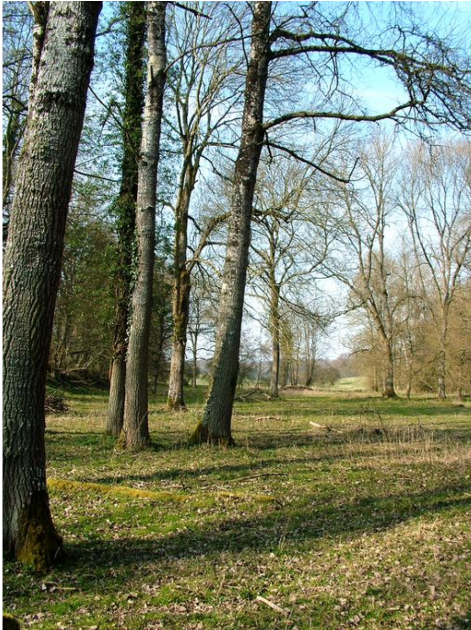
Site du hameau aujourd'hui boisé.