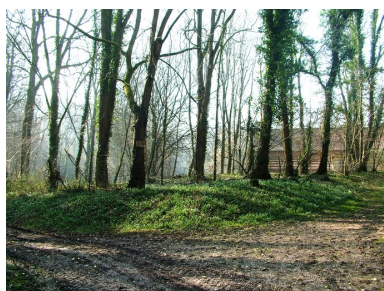
Ancienne place de la chapelle avec la croix de la famille Roussel, et l'élévation postérieure de l'étable. du château à l'arrière-plan. IVR22_20118001075NUCA