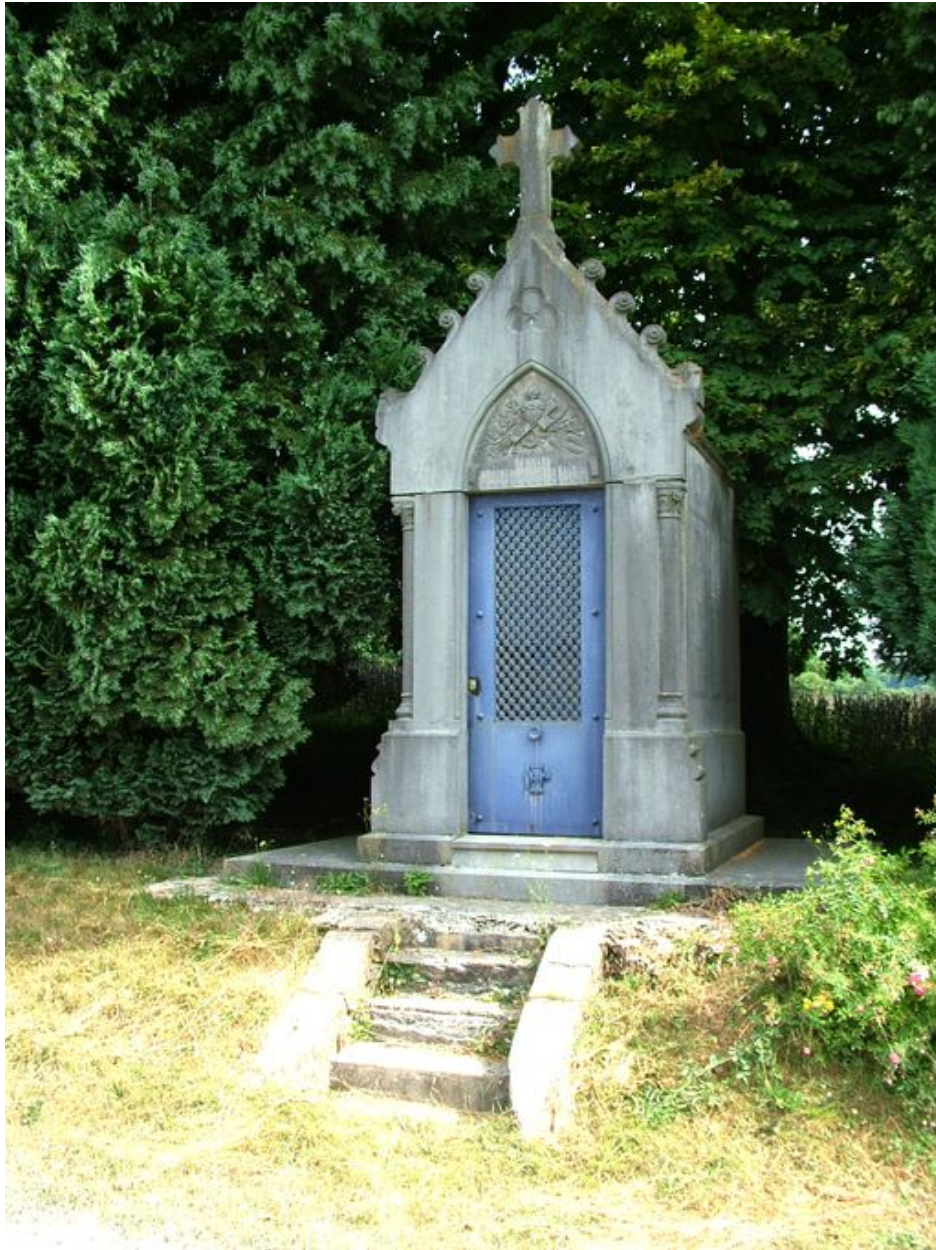
Tombeau (chapelle) des familles Jérosme de Duranty et Roussel, route de Fransu, signé FIERAIN/MARBRIER/ ABBEVILLE, 1873, en bordure de la route de Fransu.