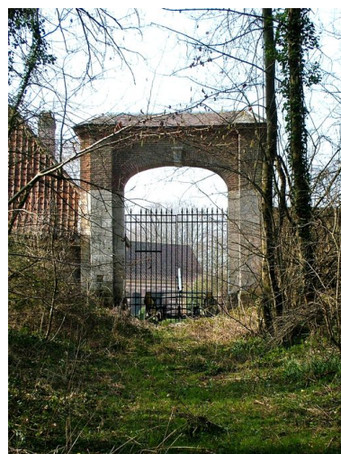
Allée menant au portail du château.