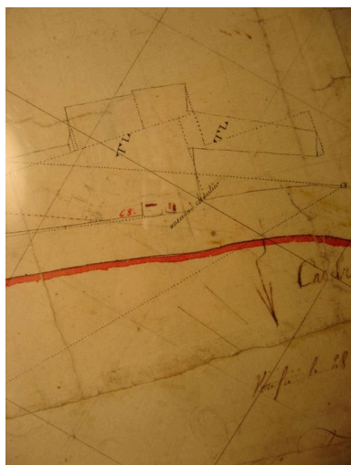
Extrait du plan par masse de culture de 1802 (AD Somme ; 3P 1069).