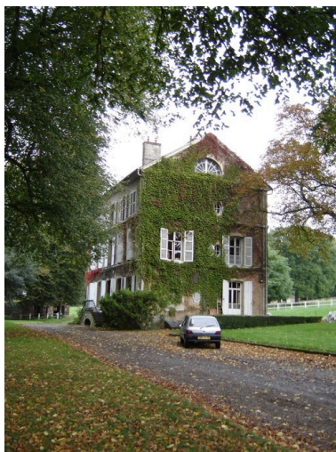
Vue du pignon est.