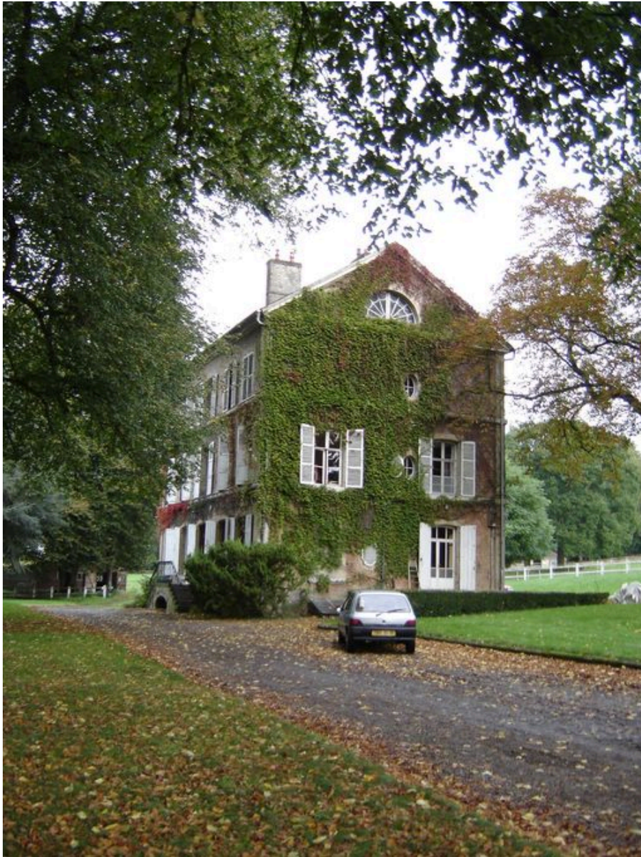
Vue du pignon est.