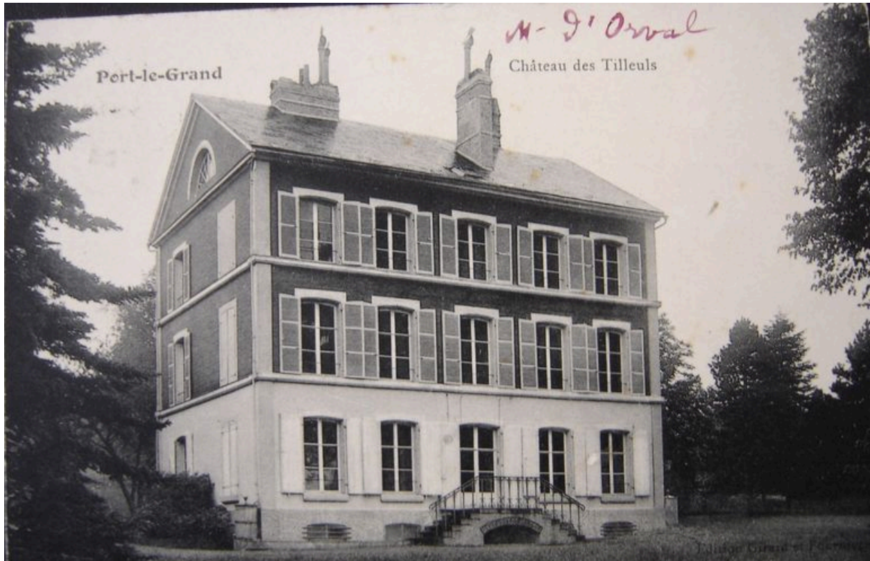
La villa, dite les Tilleuls, sur une carte postale du début du 20e siècle (coll. part.).