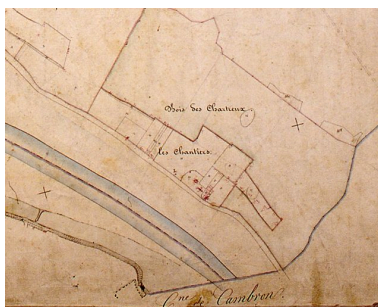
Extrait du cadastre napoléonien de 1832 (AD Somme ; 3P 1451).