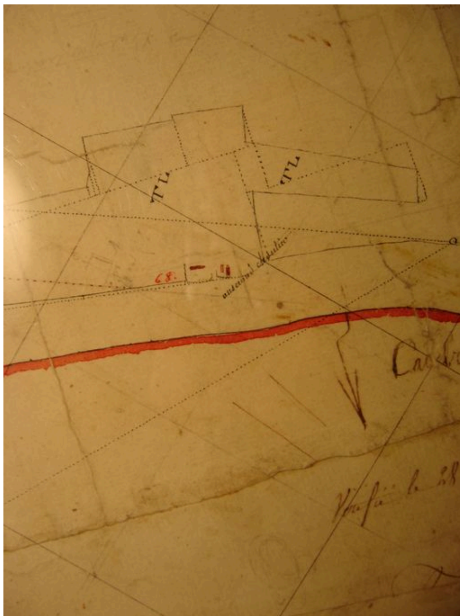
Extrait du plan par masse de culture de 1802 (AD Somme ; 3P 1069).