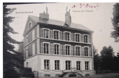
La villa, dite les Tilleuls, sur une carte postale du début du 20e siècle.