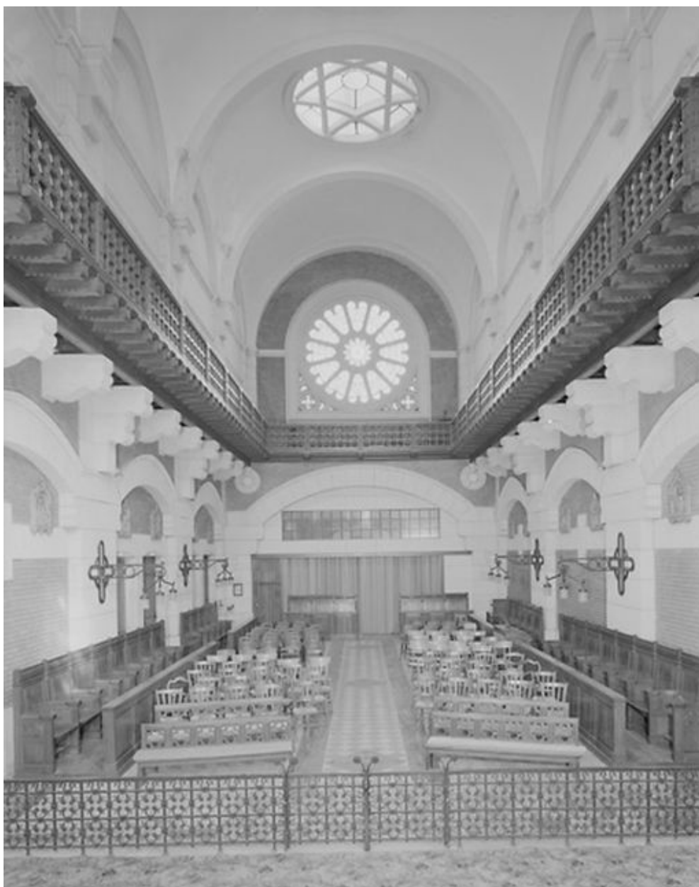
Vue intérieure de la chapelle, vers le chœur.