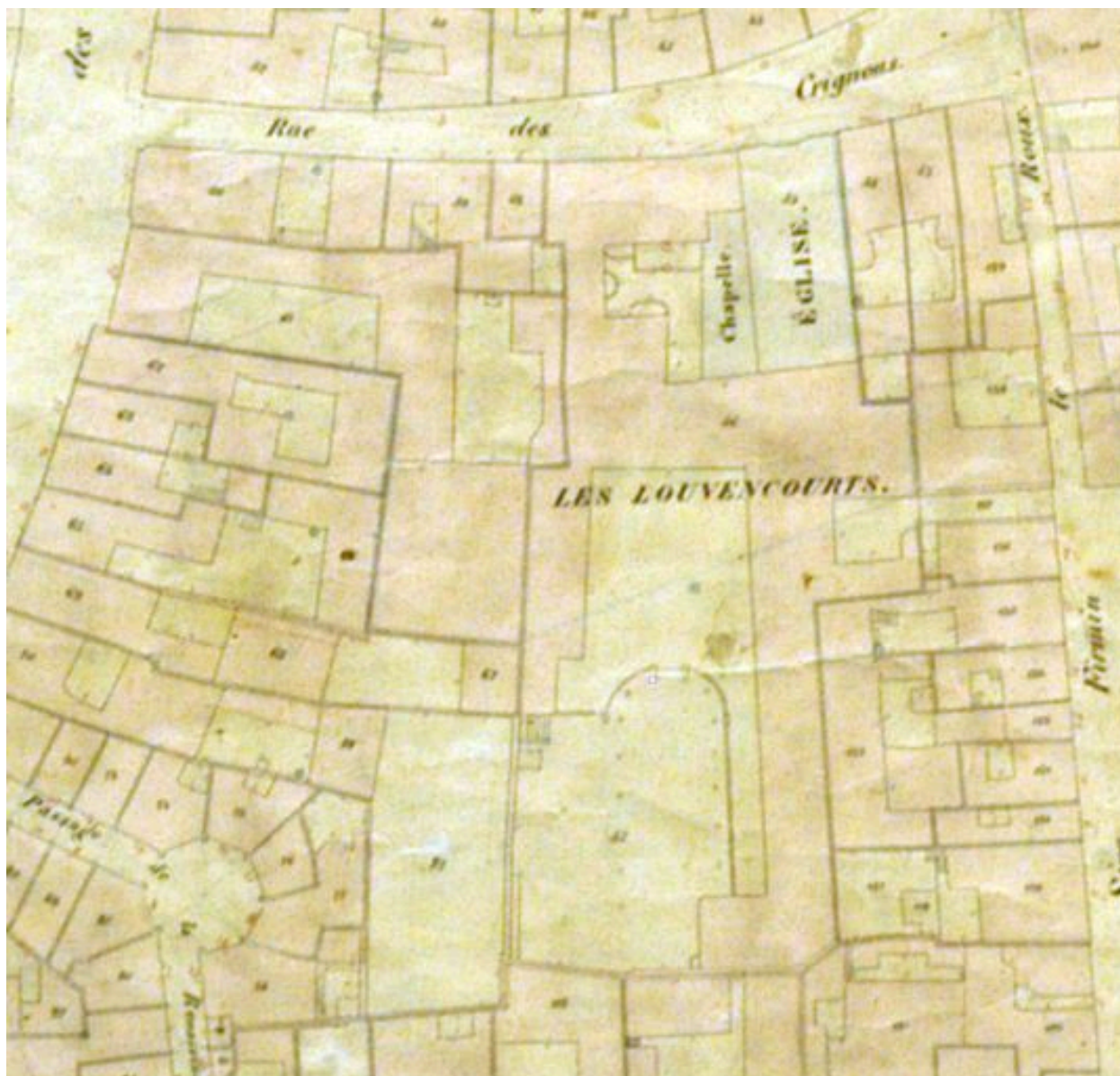
Extrait du cadastre napoléonien (AD Somme ; 3 P).