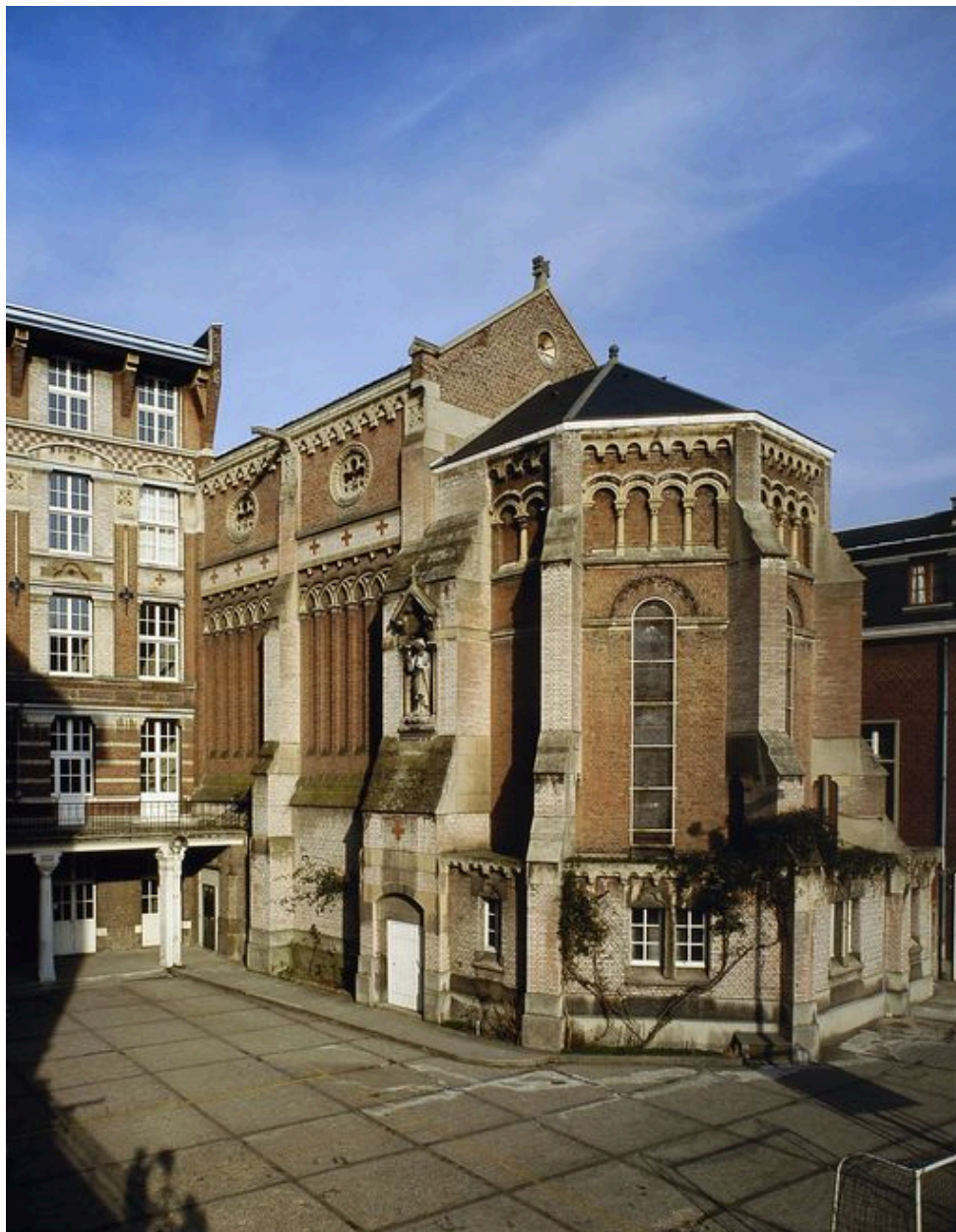
Vue du chevet de la chapelle.