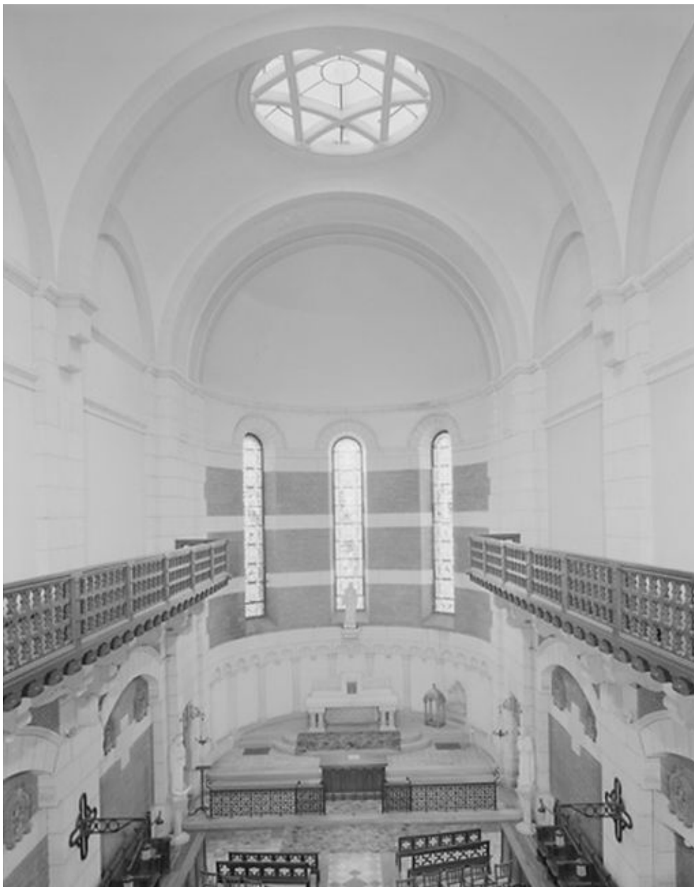
Vue intérieure de la chapelle, vers le nord.