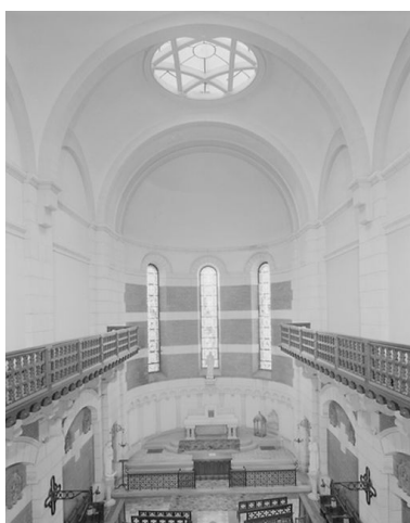
Vue intérieure de la chapelle, vers le nord.