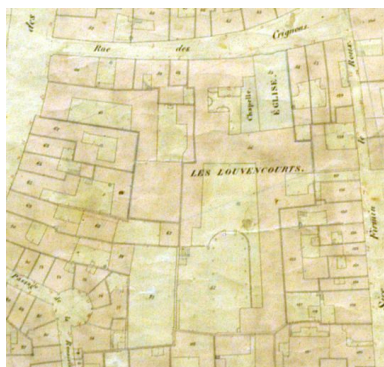
Extrait du cadastre napoléonien (AD Somme ; 3 P).