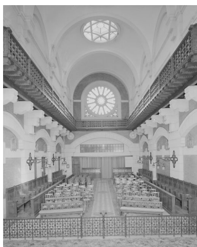
Vue intérieure de la chapelle, vers le chœur.