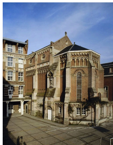
Vue du chevet de la chapelle.