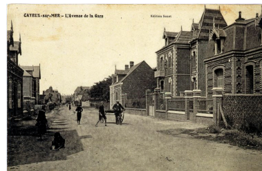
L'actuelle avenue Paul-Doumer, carte postale, 1er quart 20e siècle (coll. part.). IVR22_20058000431XAB