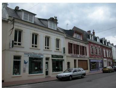
La rue Paul-Doumer.