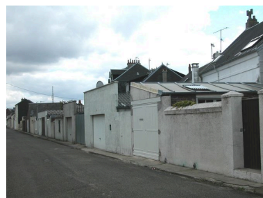
La rue du Mont-Rôti, vue sur les annexes et garages des maisons implantées le long de l'avenue Carnot.