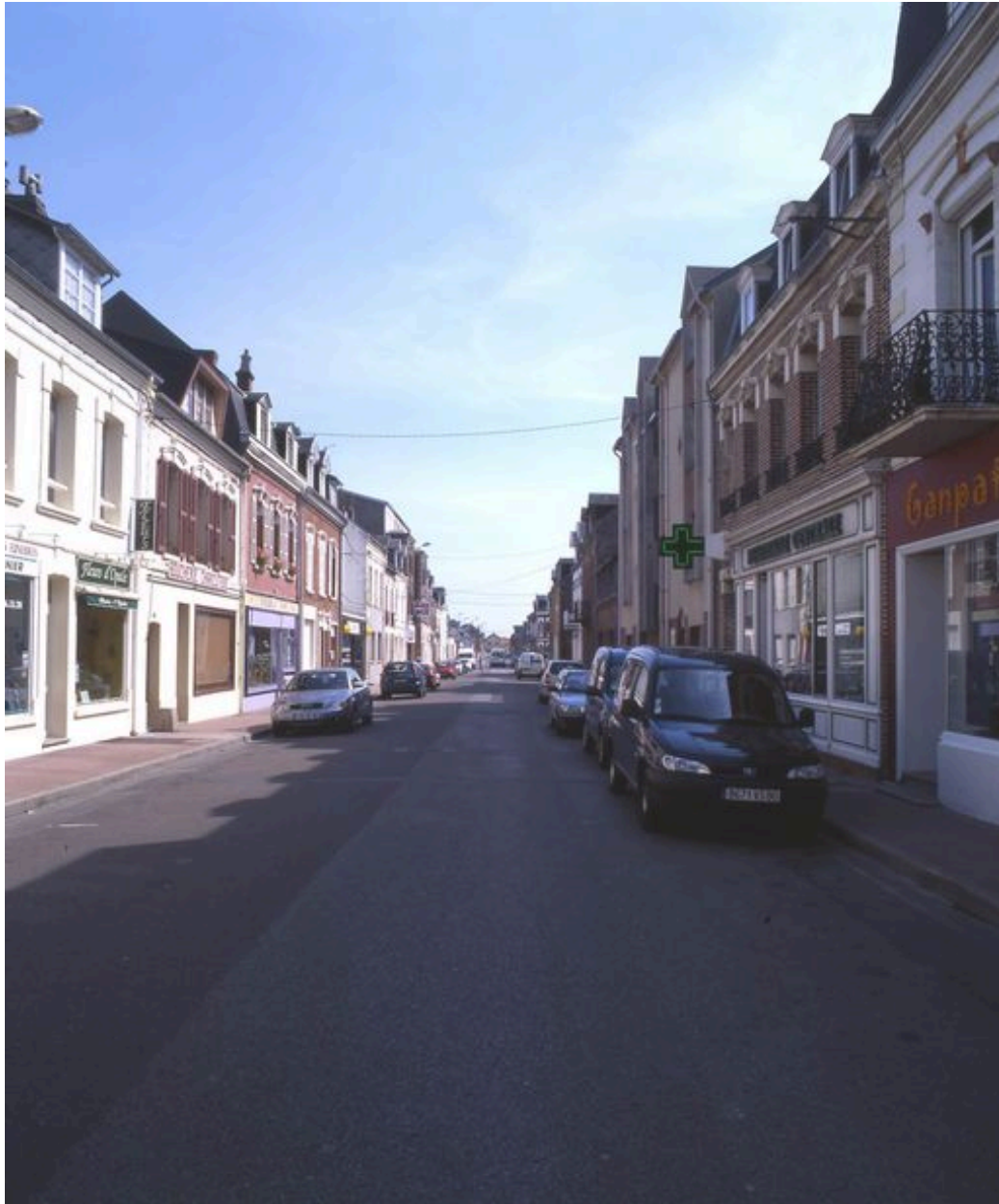
L'avenue Paul-Doumer, vue vers la gare.