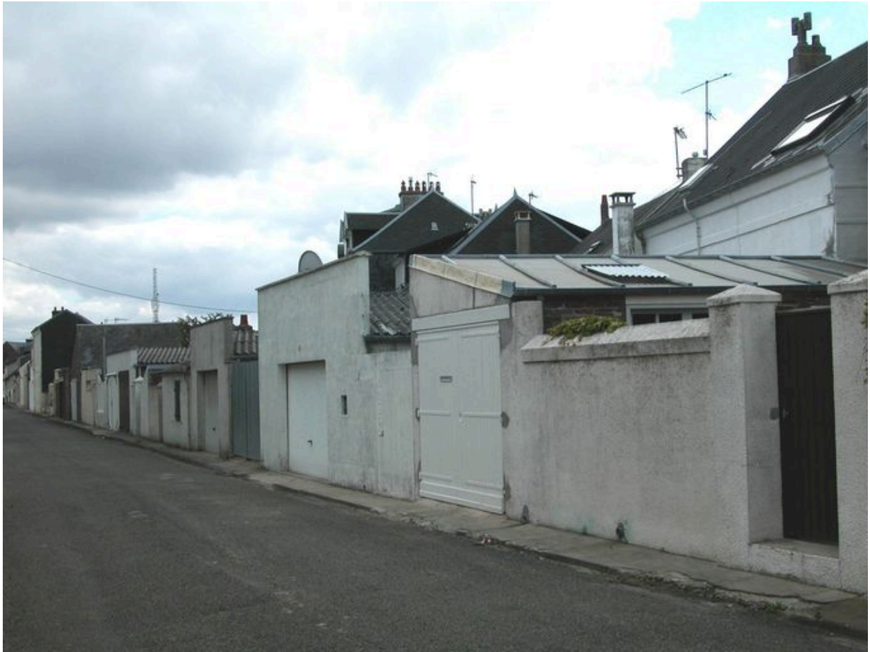
La rue du Mont-Rôti, vue sur les annexes et garages des maisons implantées le long de l'avenue Carnot.