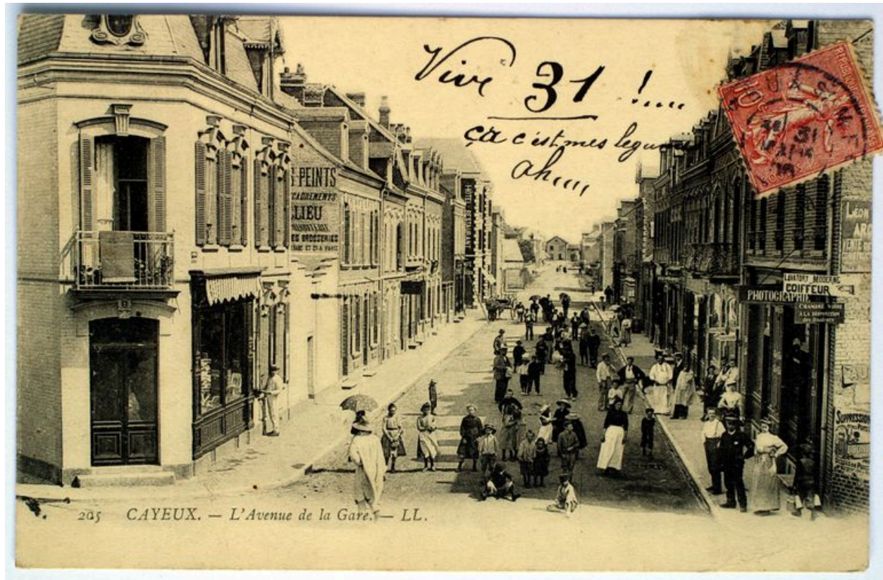
La rue Paul-Doumer, carte postale, 1er quart 20e siècle (coll. part.).