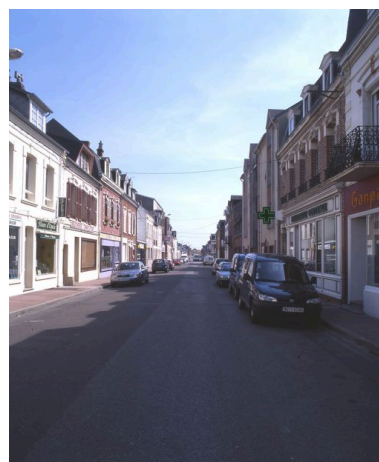
L'avenue Paul-Doumer, vue vers la gare. Phot. Marie-Laure Monnehay-Vulliet