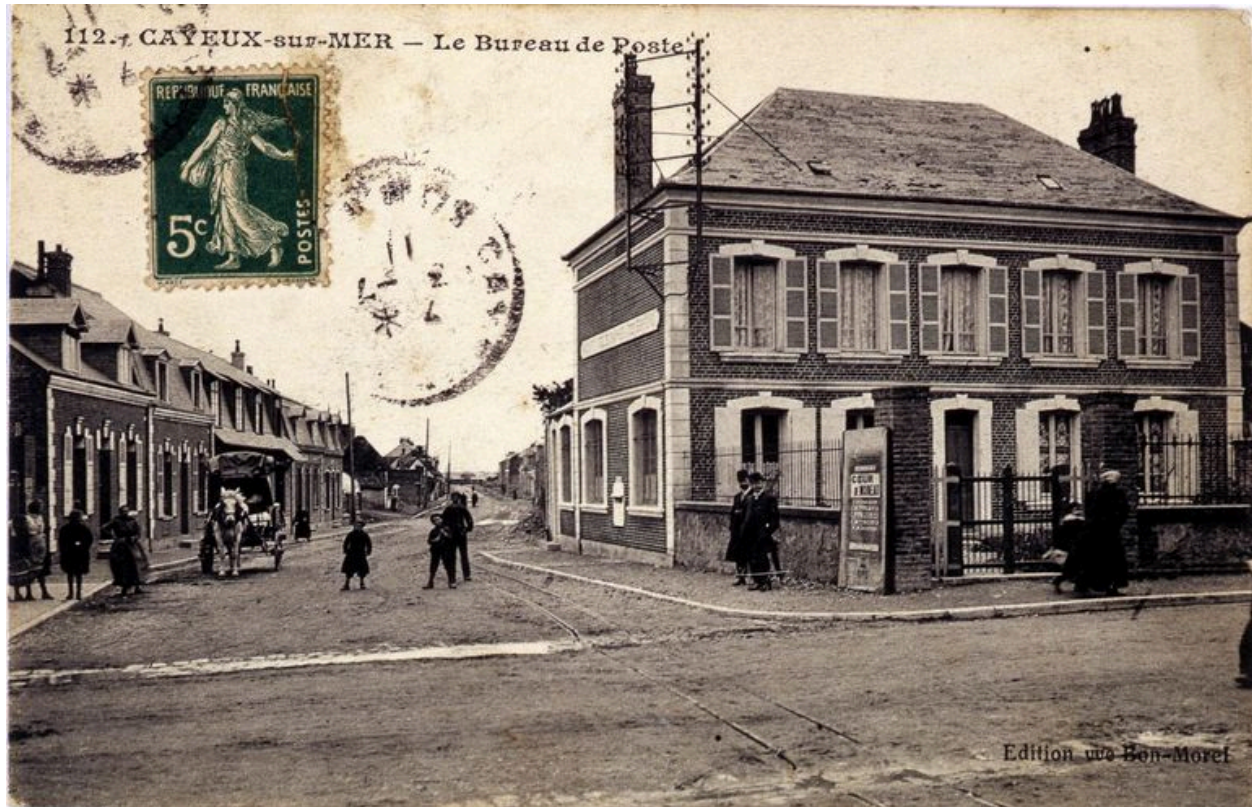
L'avenue Carnot et l'ancienne poste, carte postale, 1er quart 20e siècle (coll. part.).