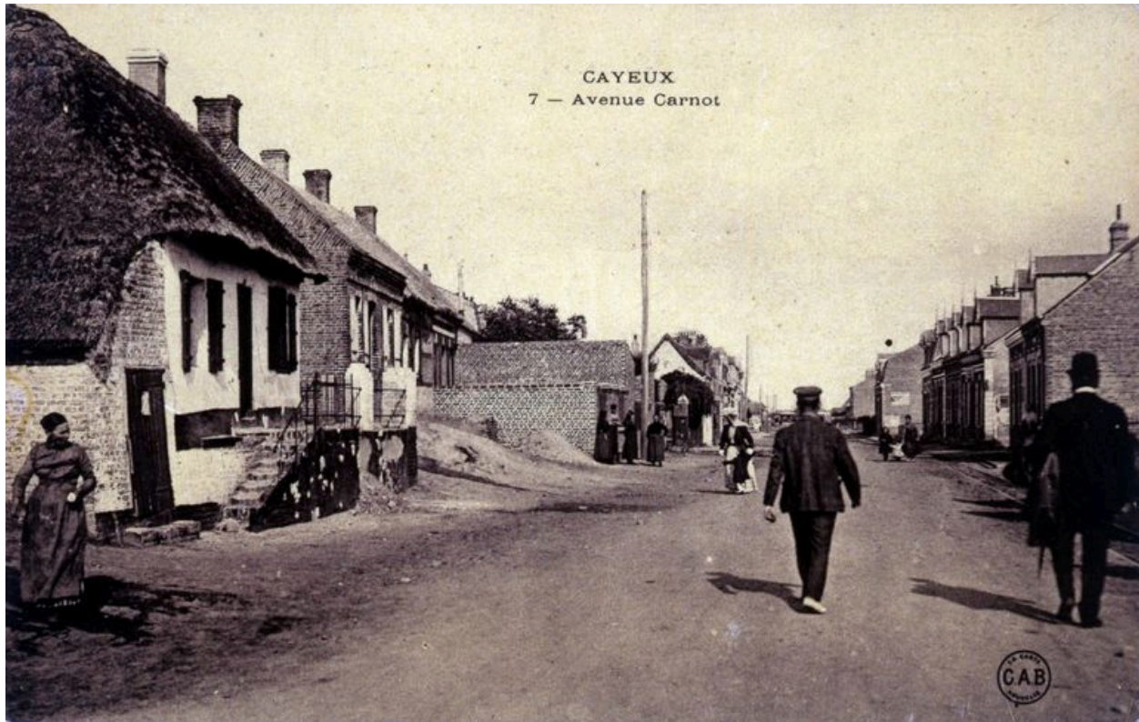
L'avenue Carnot et ses vieilles maisons, toujours en place, carte postale, 1er quart 20e siècle.