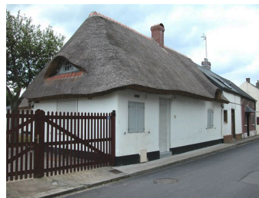
Une ancienne chaumière située entre la rue du Vimeu et l'allée Saint-Joseph, visible sur la cadastre napoléonien établi vers 1831.