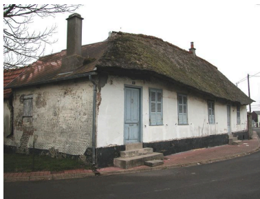
Une ancienne chaumière située 1 rue Georges Bureau.