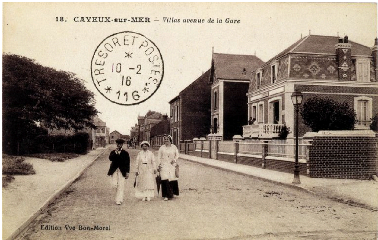
L'actuelle avenue Paul-Doumer, vue vers la gare, carte postale, 1er quart 20e siècle (coll. part.).