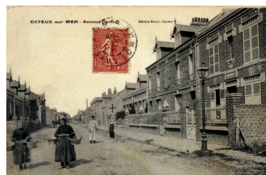
L'avenue Carnot, carte postale, 1er quart 20e siècle (coll. part.). IVR22_20058000423XAB