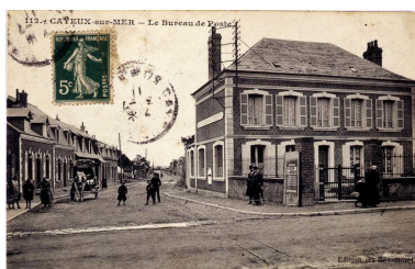
L'avenue Carnot et l'ancienne poste, carte postale, 1er quart 20e siècle (coll. part.).