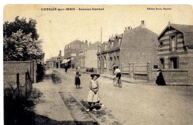
L'avenue Carnot, carte postale, 1er quart 20e siècle (coll. part.). IVR22_20058000425XAB