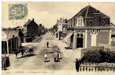
L'actuelle avenue Paul-Doumer, vue depuis la gare, carte postale, 1er quart 20e siècle (coll. part.).