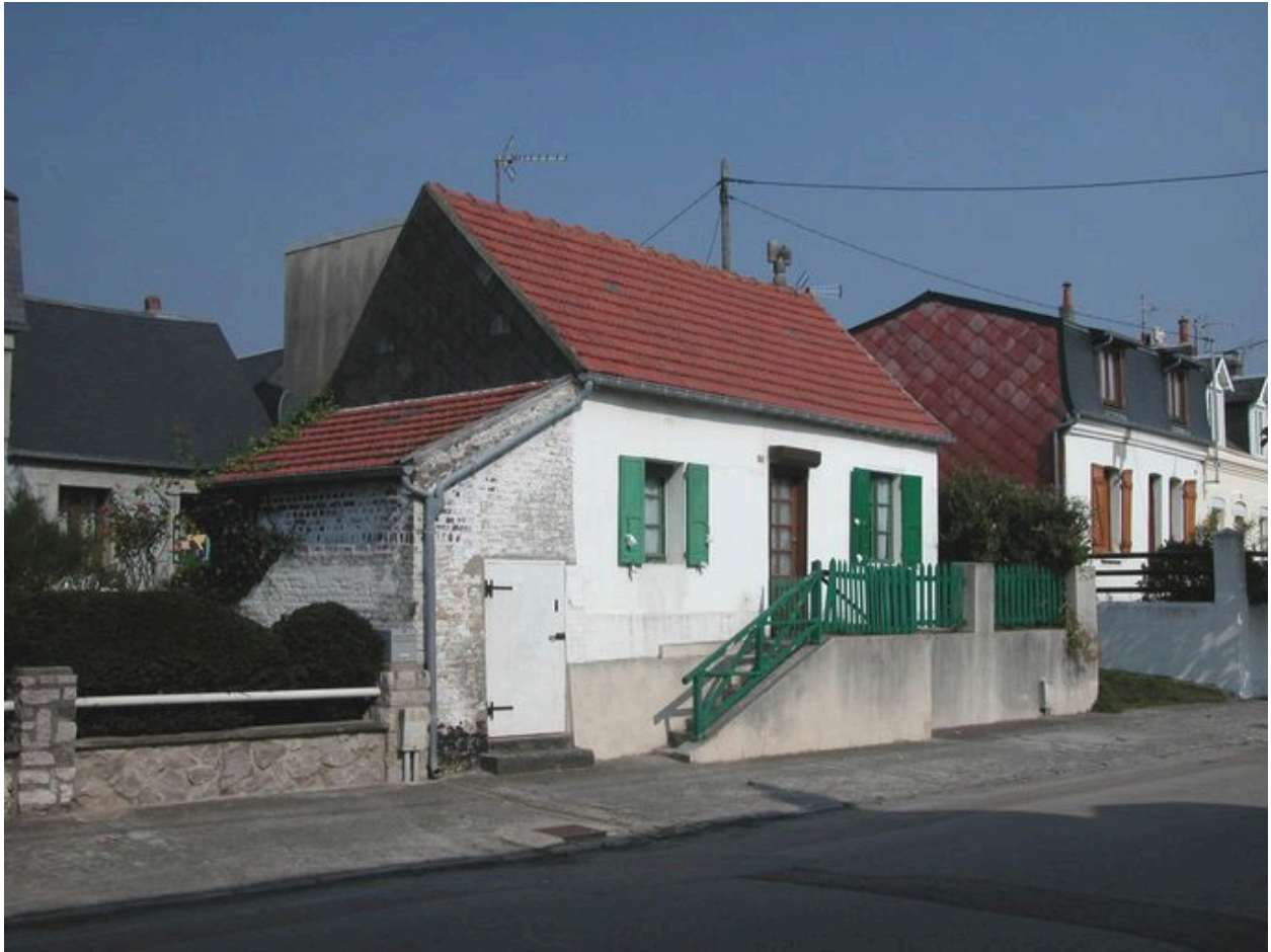
Une maison ancienne, 23 avenue Carnot (1988 BA 175).