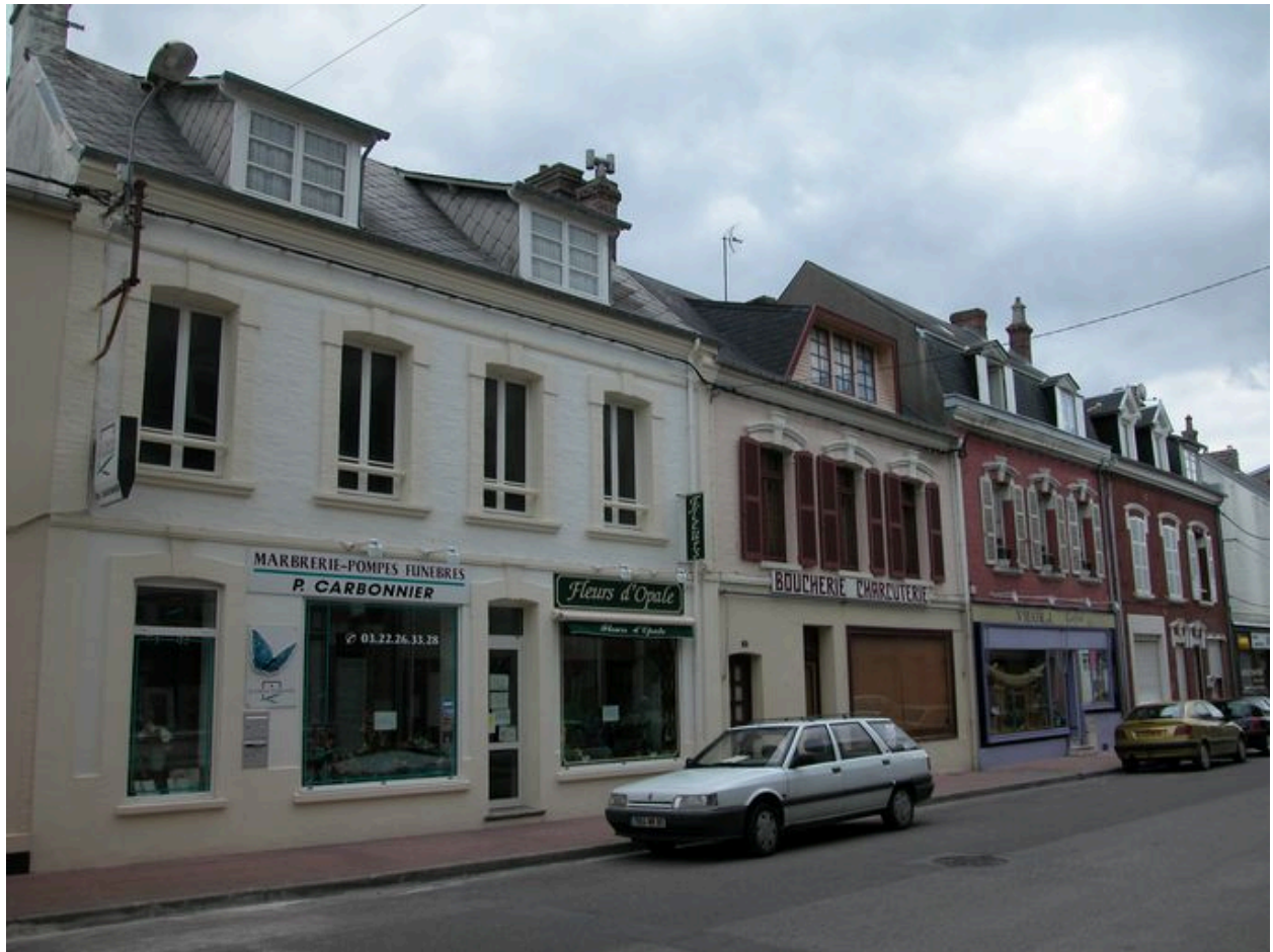
La rue Paul-Doumer.