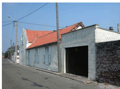
Une ancienne maison située à l'angle des rues du Mont- Roti (n°32) et des Corderies, visible sur le cadastre de 1831.