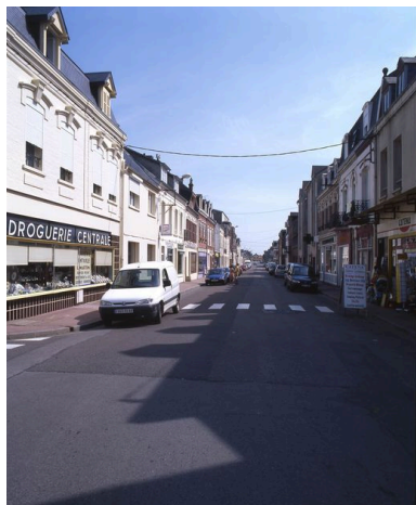
L'avenue Paul-Doumer, vue vers la gare.

Phot. Marie-Laure Monnehay-Vulliet IVR22_20048000139XA