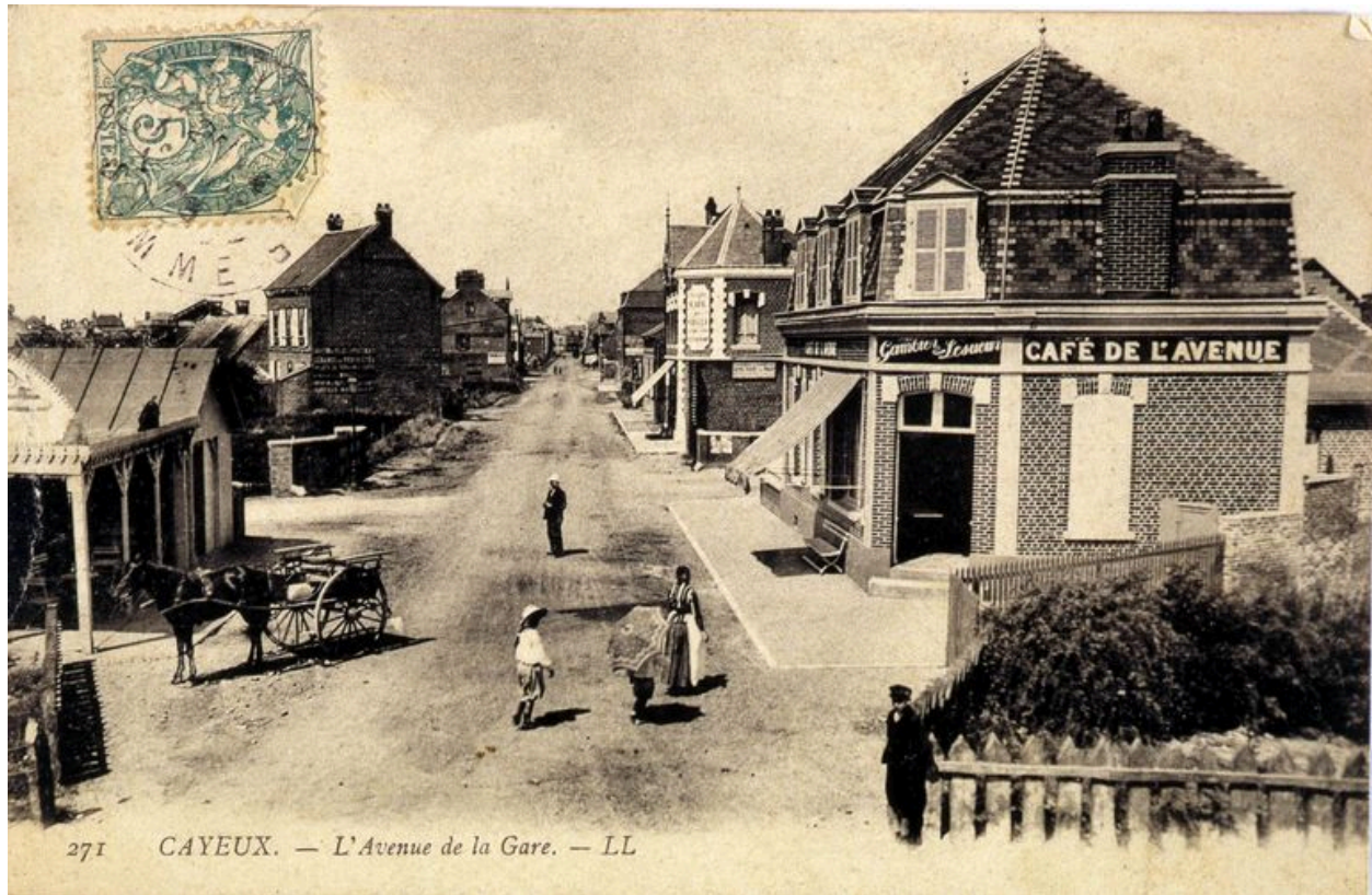
L'actuelle avenue Paul-Doumer, vue depuis la gare, carte postale, 1er quart 20e siècle (coll. part.).