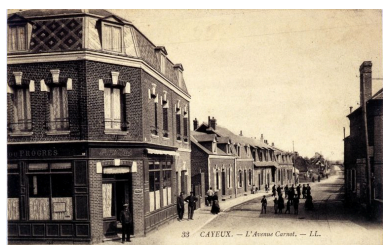
L'avenue Carnot, carte postale, 1er quart 20e siècle (coll. part.). IVR22_20058000416XAB