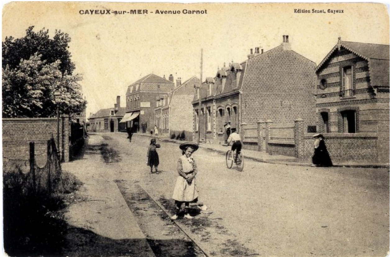
L'avenue Carnot, carte postale, 1er quart 20e siècle.