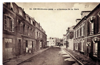
L'actuelle avenue Paul-Doumer et ses commerces, carte postale, 1er quart 20e siècle (coll. part.). IVR22_20058000427XAB