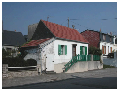
Une maison ancienne, 23 avenue Carnot (1988 BA 175). IVR22_20058003091NUCA