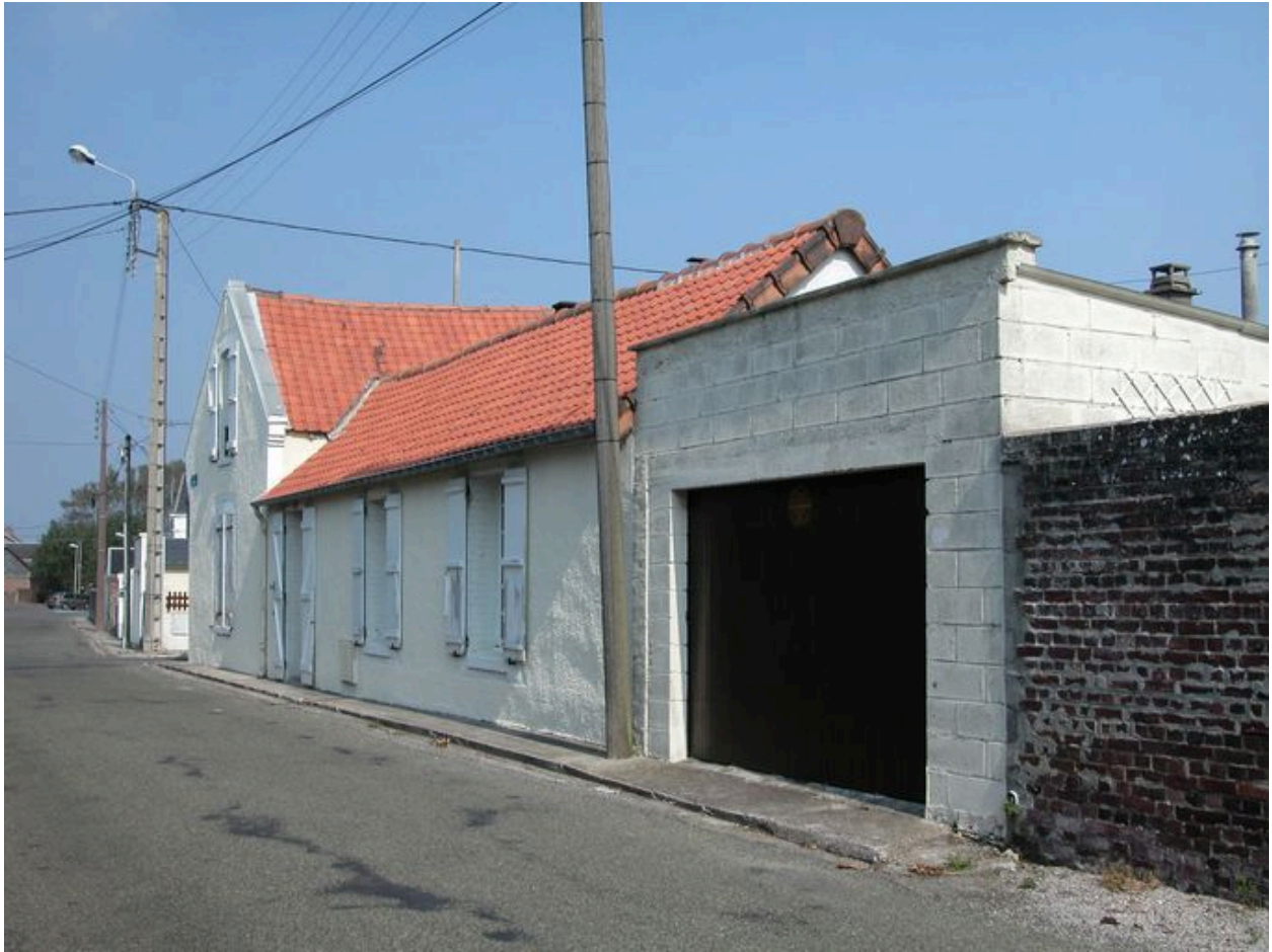
Une ancienne maison située à l'angle des rues du Mont-Roti (n°32) et des Corderies, visible sur le cadastre de 1831.