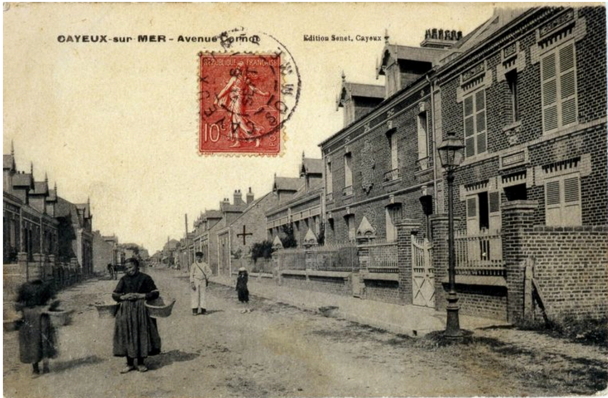
L'avenue Carnot, carte postale, 1er quart 20e siècle.