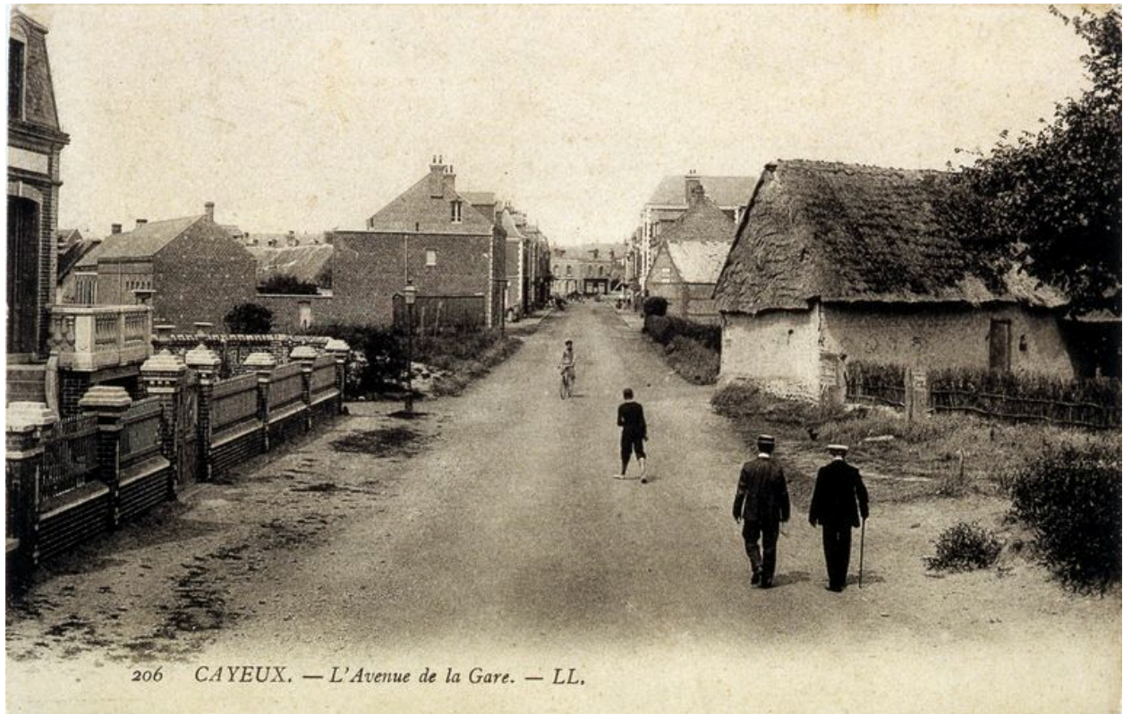
L'actuelle avenue Paul-Doumer, carte postale, 1er quart 20e siècle.