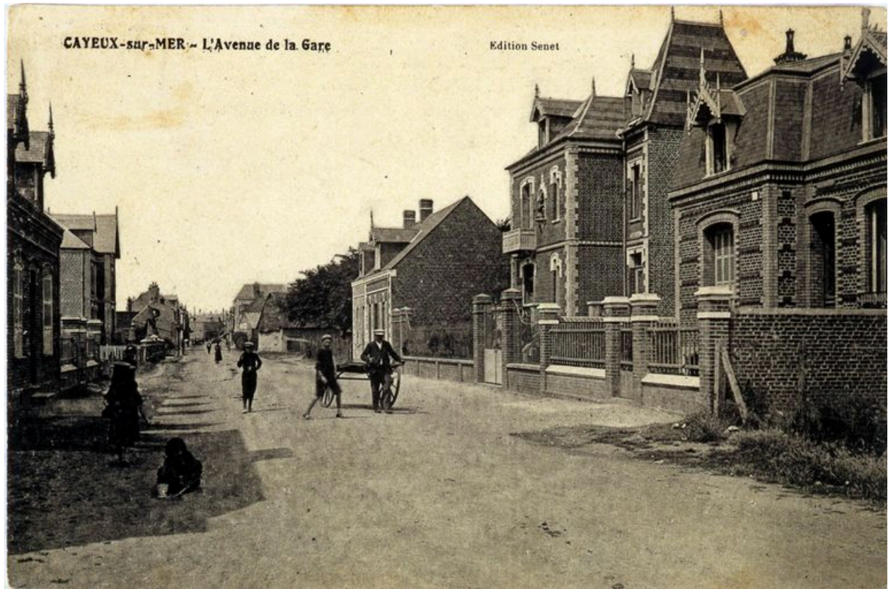
L'actuelle avenue Paul-Doumer, carte postale, 1er quart 20e siècle (coll. part.).