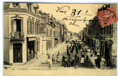
La rue Paul-Doumer, carte postale, 1er quart 20e siècle (coll. part.).