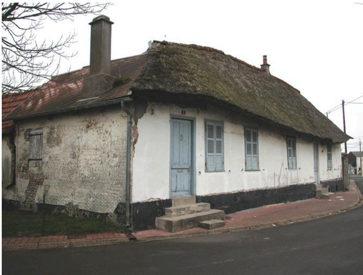
Une ancienne chaumière située 1 rue Georges Bureau.