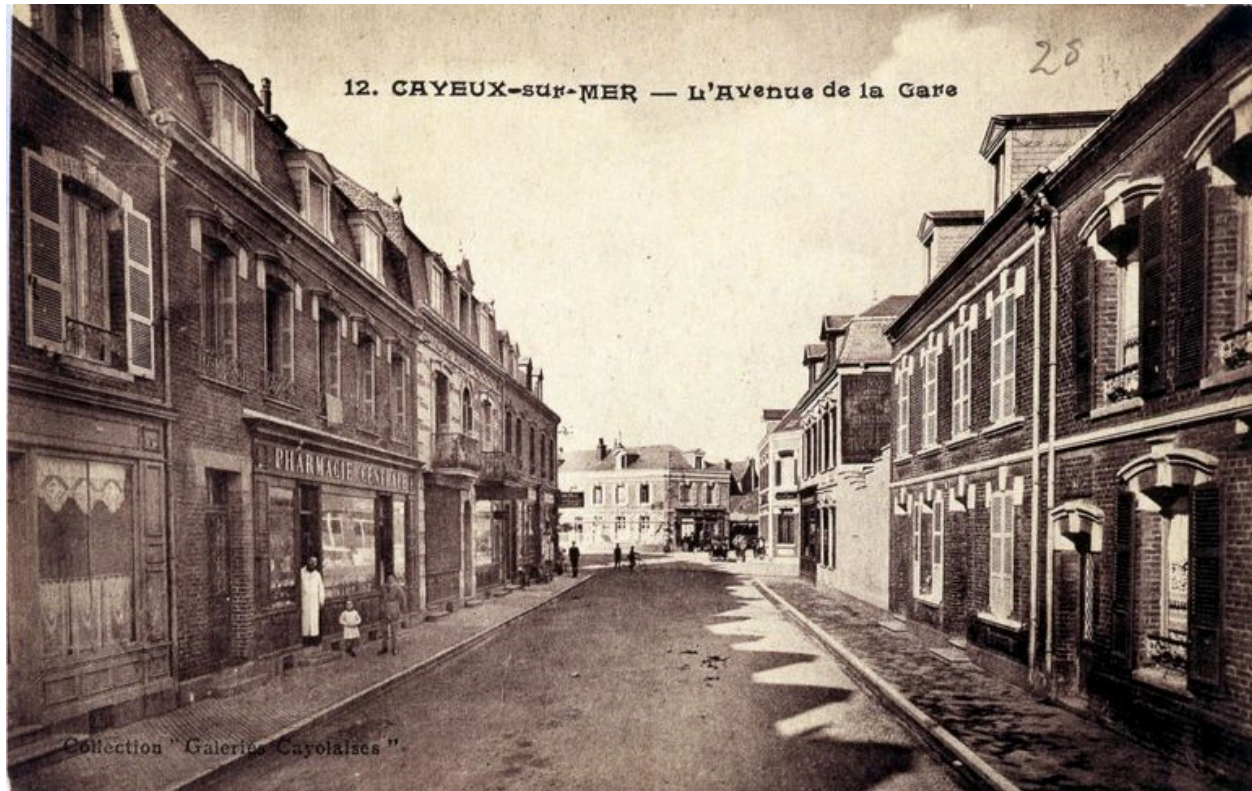
L'actuelle avenue Paul-Doumer et ses commerces, carte postale, 1er quart 20e siècle.