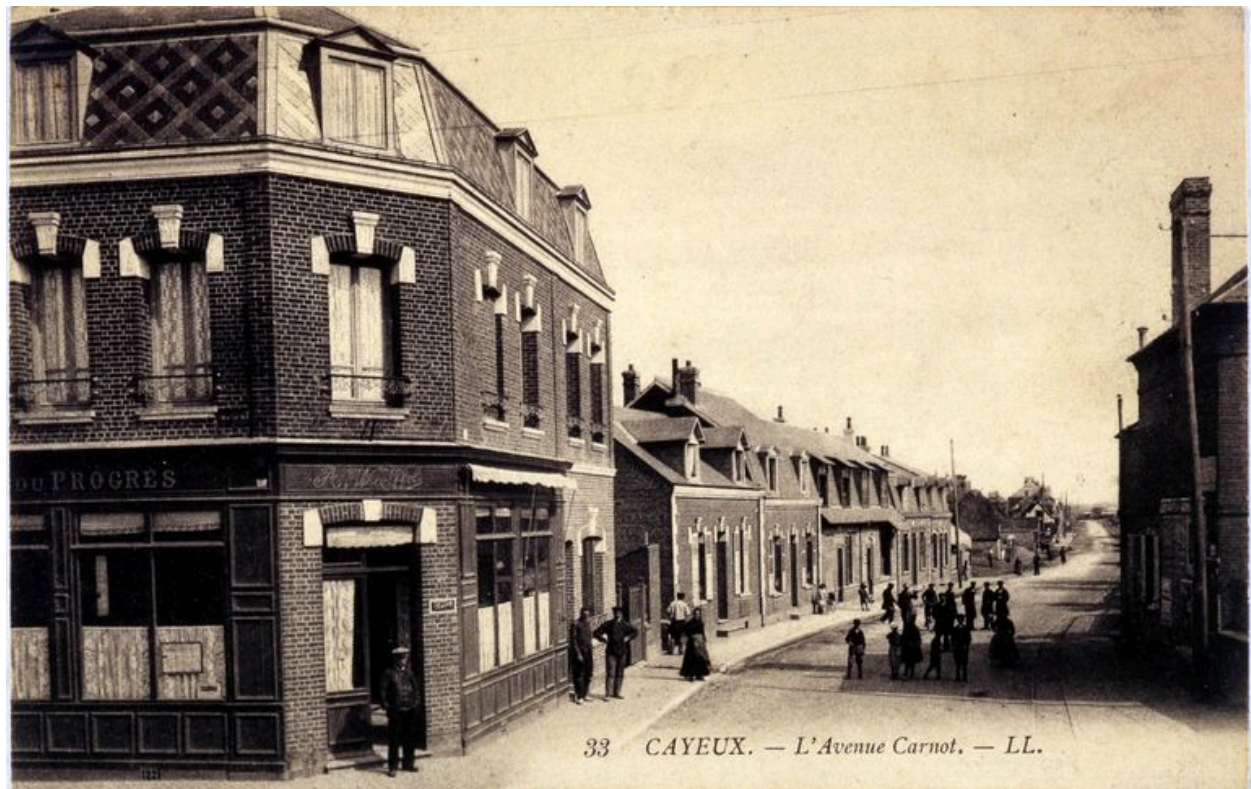
L'avenue Carnot, carte postale, 1er quart 20e siècle (coll. part.).