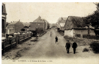
L'actuelle avenue Paul-Doumer, carte postale, 1er quart 20e siècle