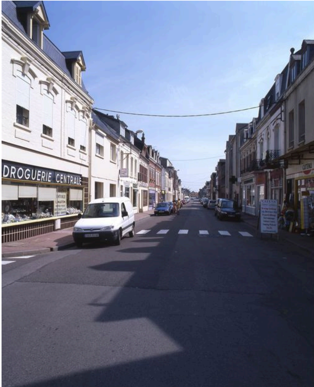
L'avenue Paul-Doumer, vue vers la gare.