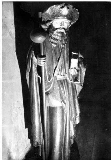
Statue de saint Jacques, photographie, [ca 1950]. IVR32_20236200355NUCA