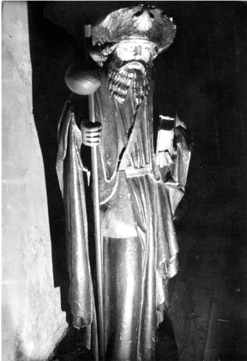
Statue de saint Jacques, photographie, photographe inconnu, [ca 1950] (coll. part).