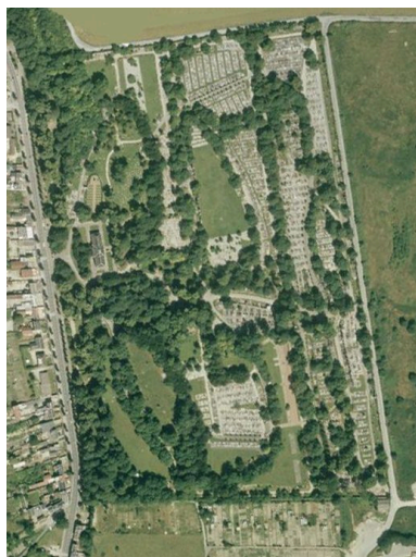
Vue aérienne du cimetière de la Madeleine.