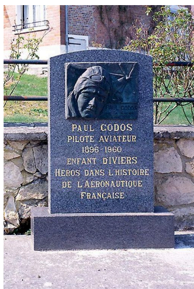
Vue générale.