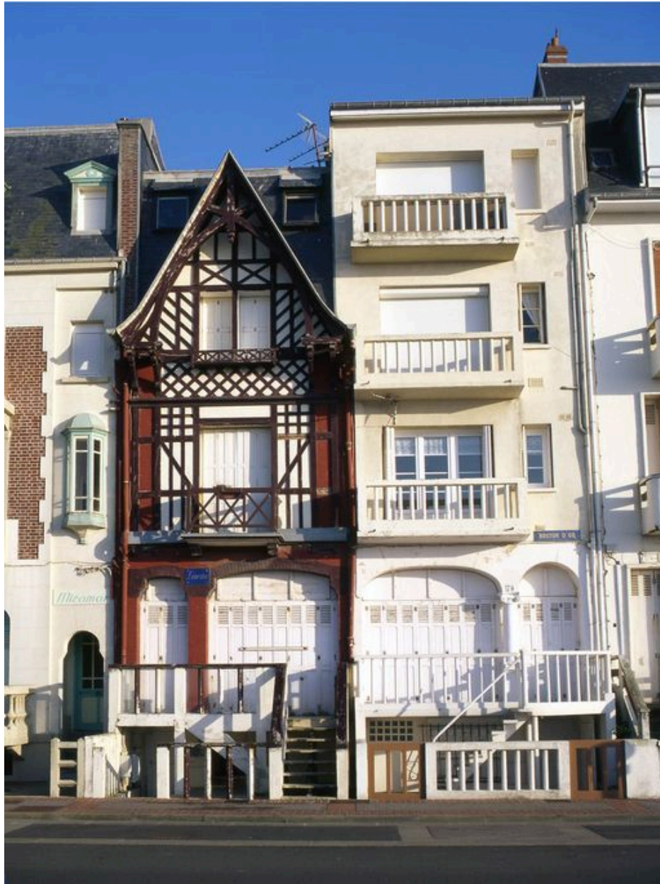
Vue d'ensemble depuis l'esplanade.