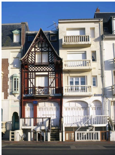
Vue d'ensemble depuis l'esplanade. IVR22_20048000295NUCA