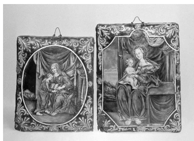
Vue des deux tableaux. IVR22_19956000155V