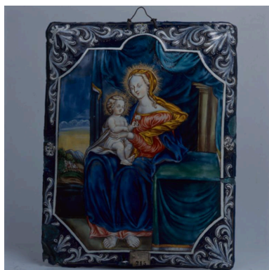
Vue générale, tableau de la Vierge à l'Enfant.