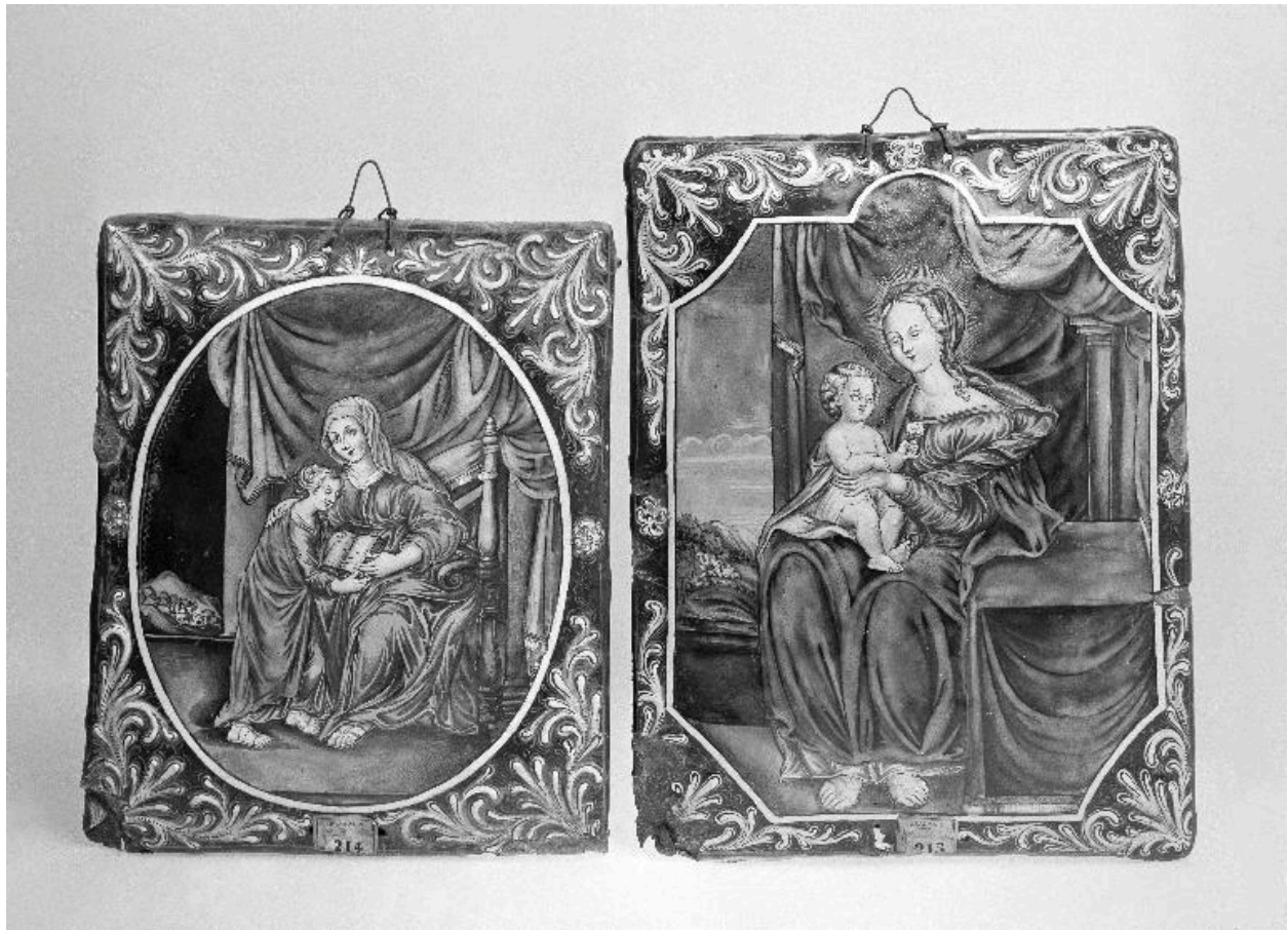
Vue des deux tableaux.