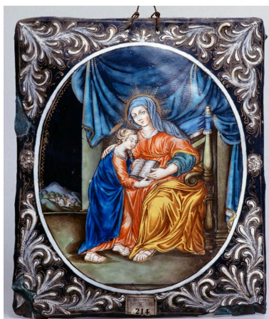
Vue générale, tableau de l'Education de la Vierge. IVR22_19956000420XA