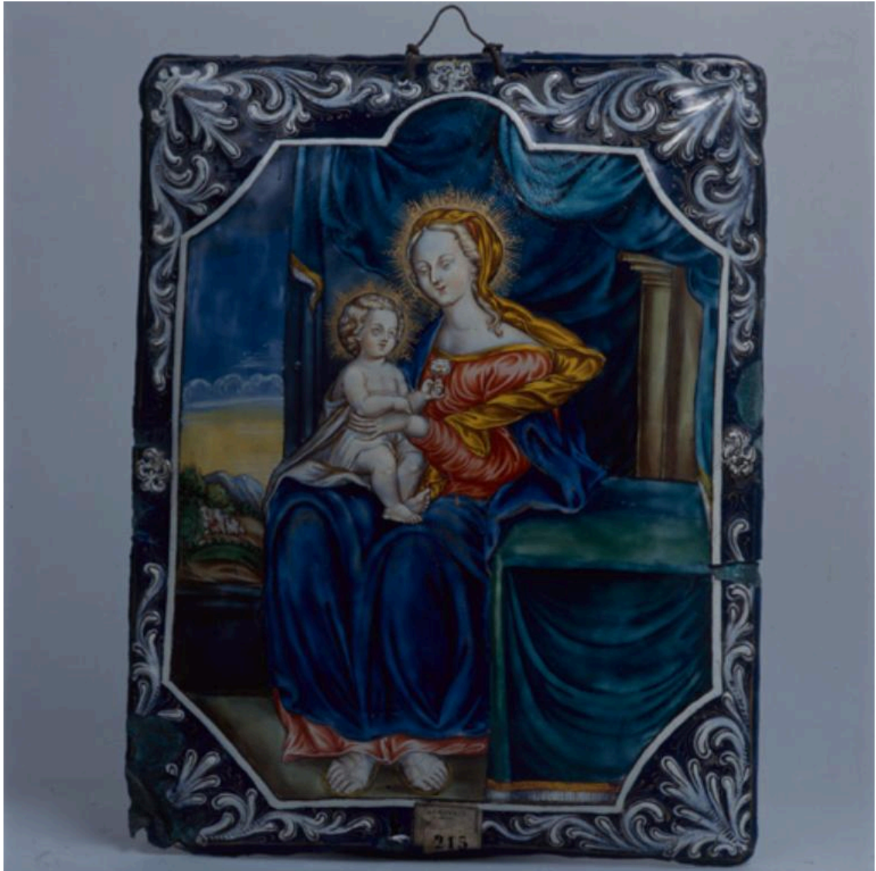
Vue générale, tableau de la Vierge à l'Enfant.