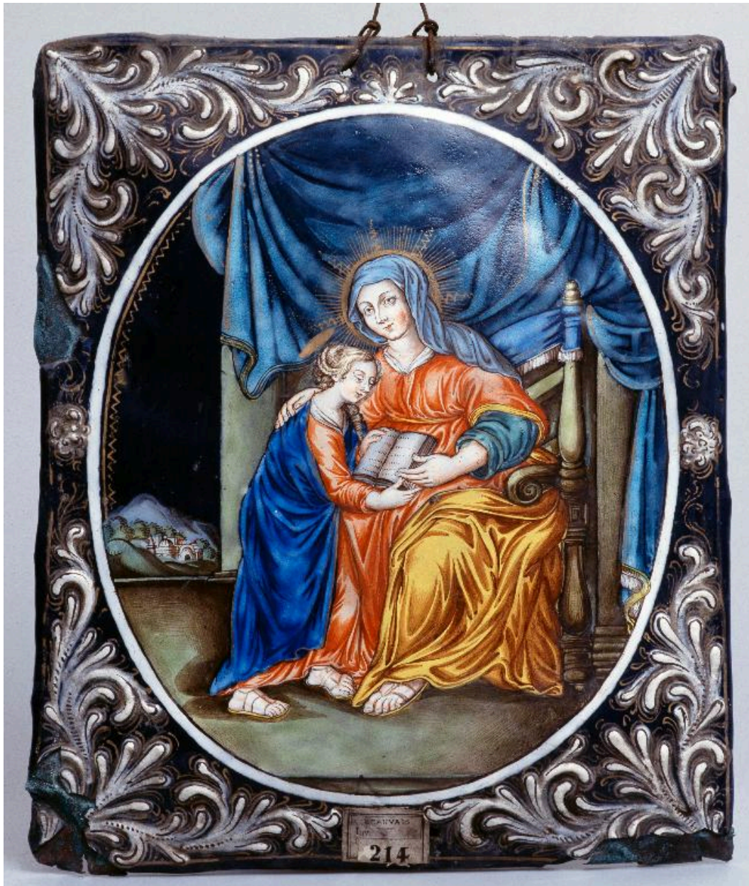
Vue générale, tableau de l'Education de la Vierge.