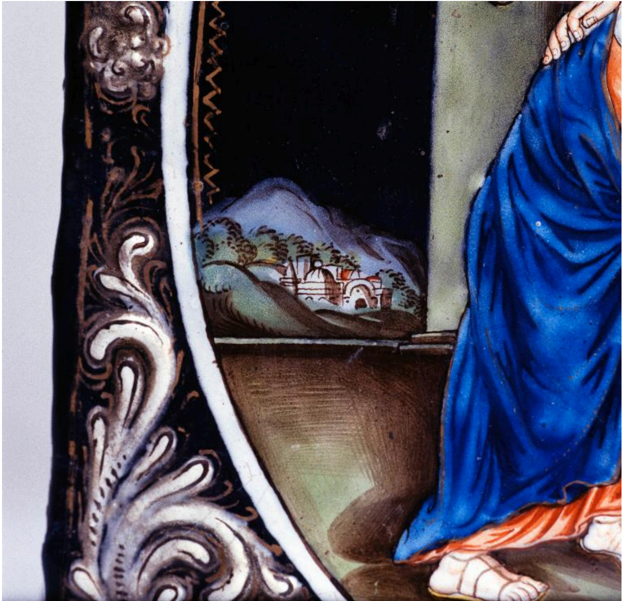
Détail d'un paysage en arrière-plan, partie inférieure gauche du tableau illustrant l'Education de la Vierge.