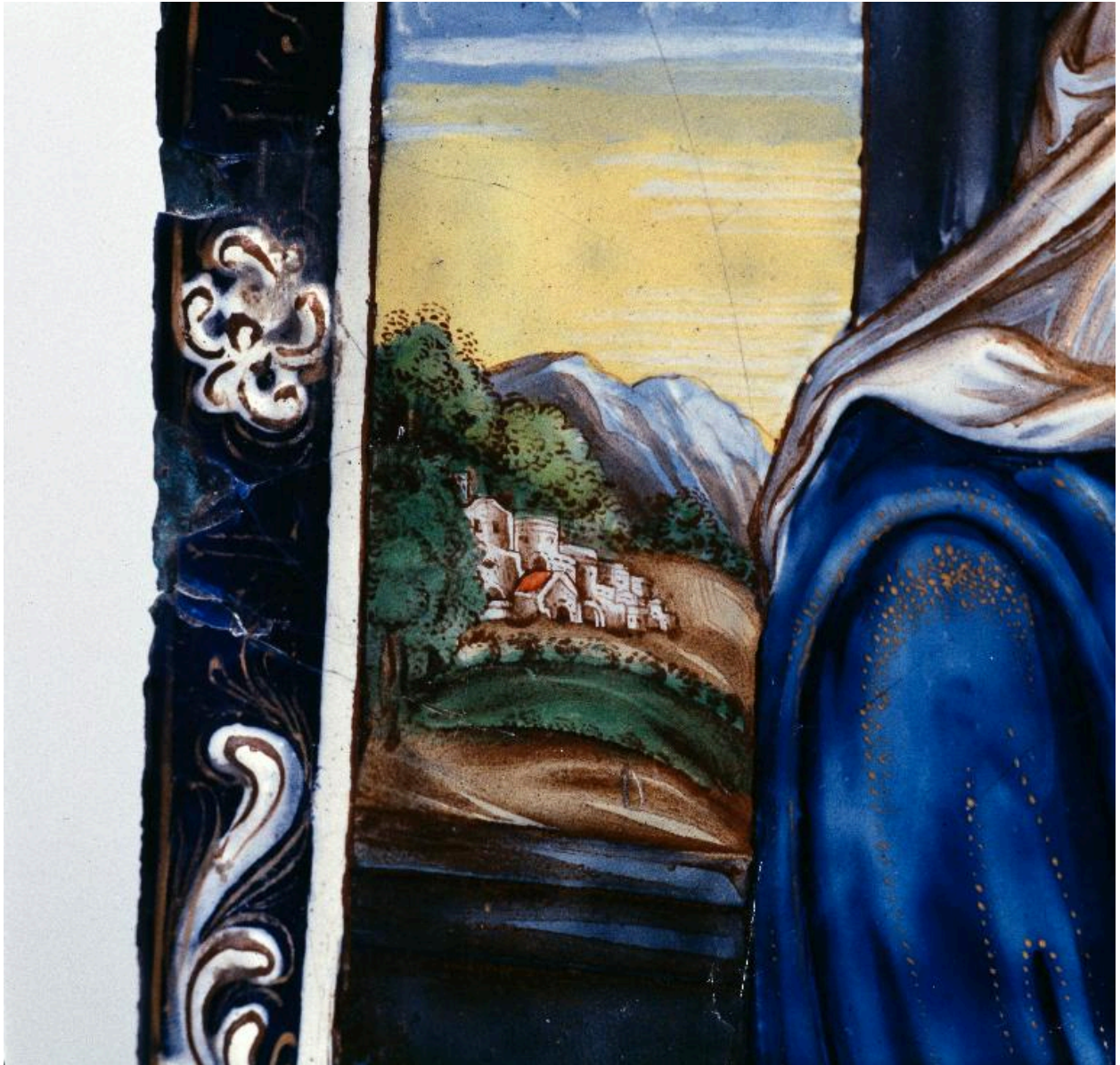
Détail d'un paysage en arrière-plan, partie inférieure gauche du tableau illustrant la Vierge à l'Enfant.