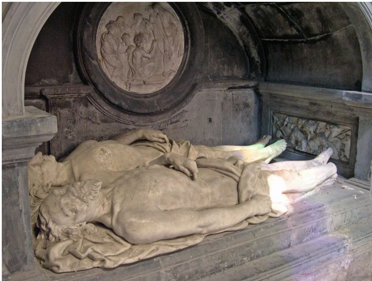
Vue de détail : gisants.