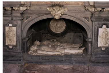
Partie inférieure. IVR22_20068000293NUCA