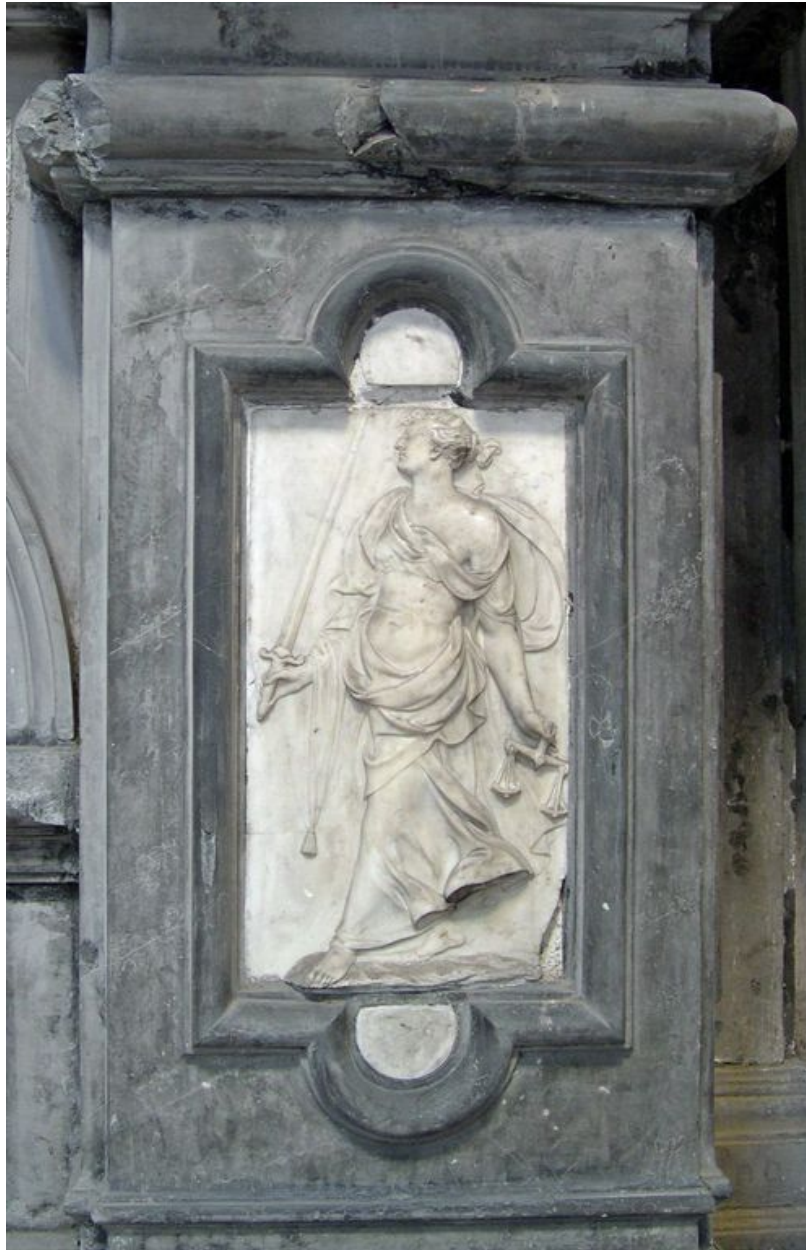
Vue de détail : bas-relief du pilastre droit.