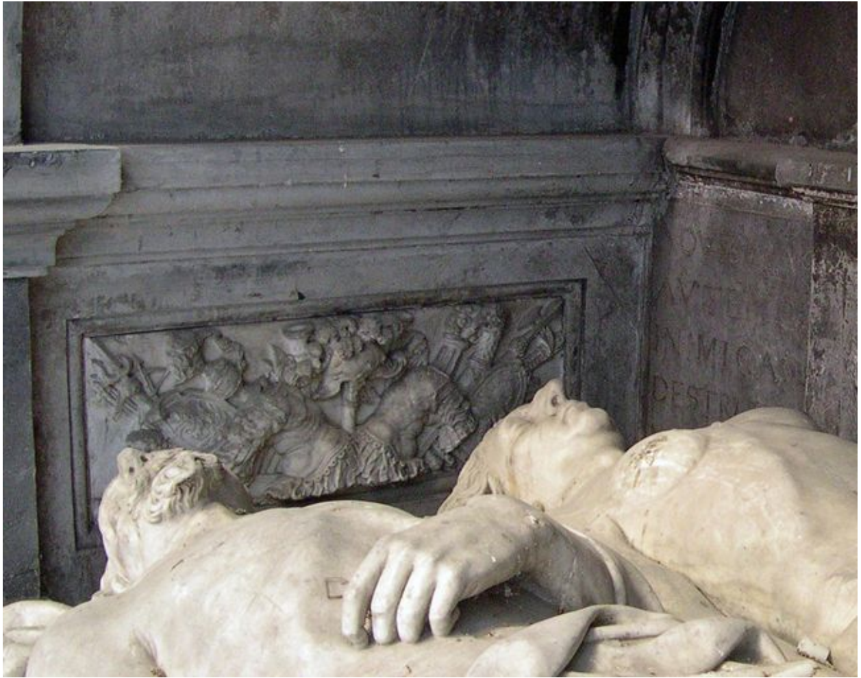
Vue de détail : bas-relief intérieur gauche.