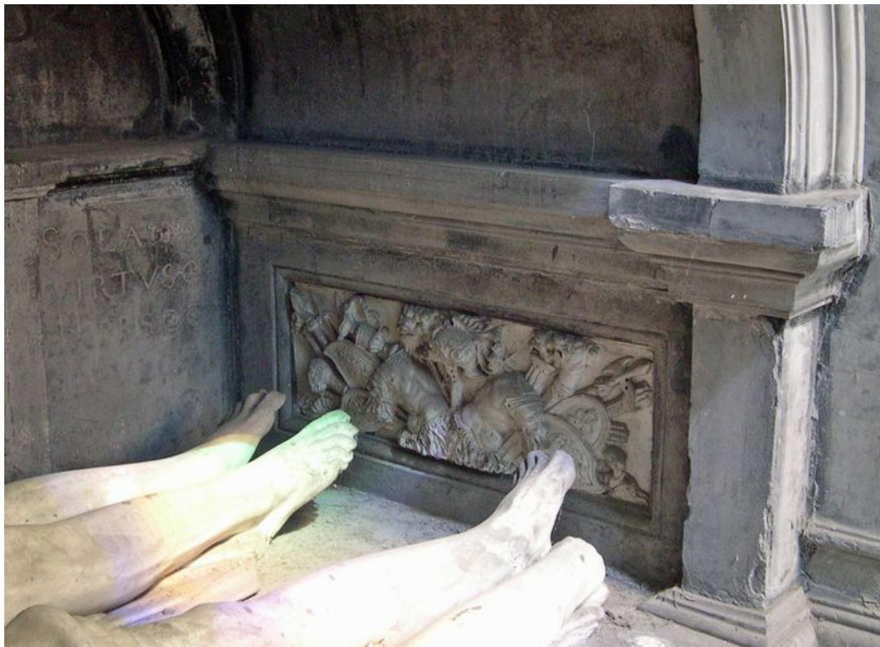
Vue de détail : bas-relief intérieur droit.