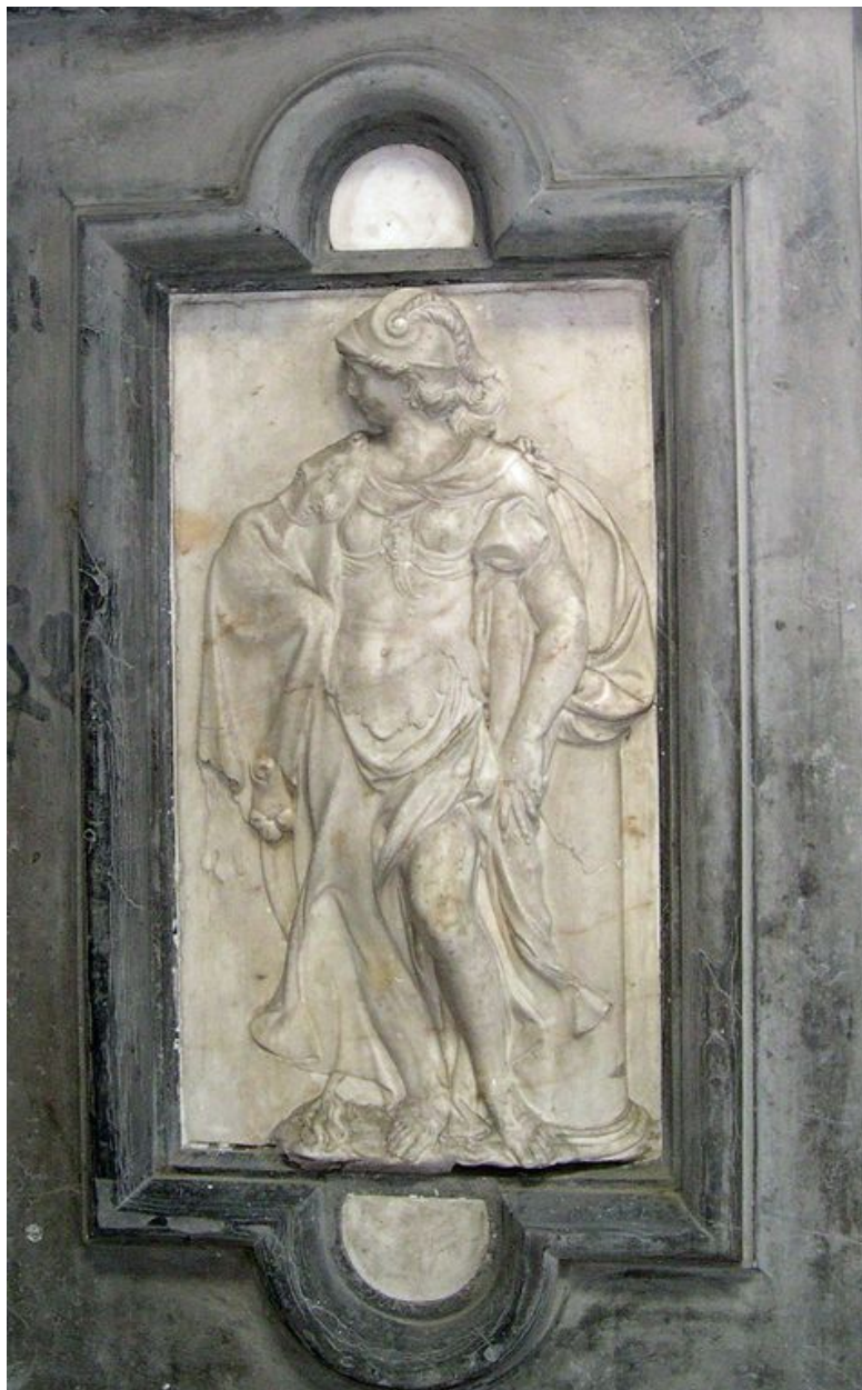
Vue de détail : bas-relief du pilastre gauche.