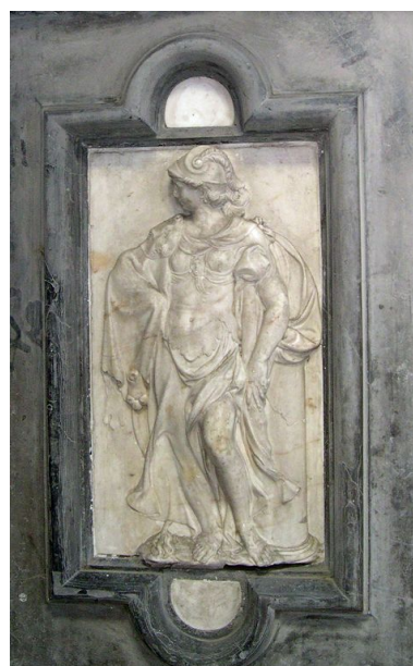
Vue de détail : bas-relief du pilastre gauche.