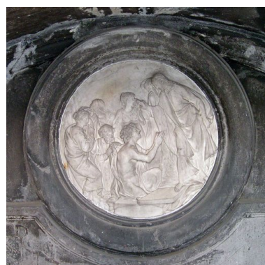
Vue du médaillon circulaire. IVR22_20068010062NUCA