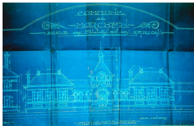
Projet de reconstruction de l'école, façade développée, A. Hunot (architecte), 1er mars 1923 (AD Somme ; 99 O 2762).

Phot. Gilles-Henri Bailly (reproduction) IVR22_20158005471NUCA