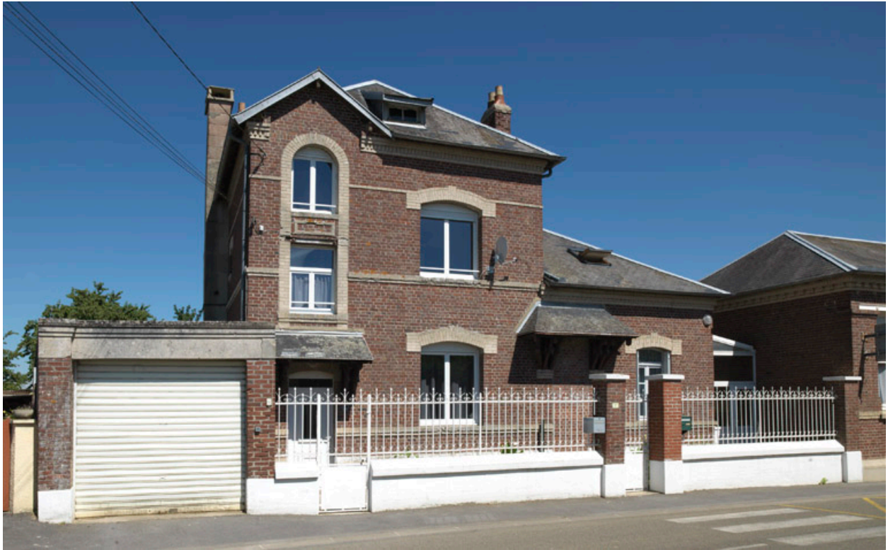
Vue du logement d'instituteur.