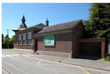
Vue des façades, rue d'Enfer. IVR22_20158000655NUC2A