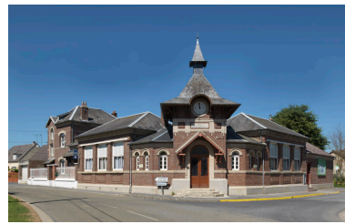
Vue générale. IVR22_20158000653NUC2A

(reproduction) IVR22_20158005472NUCA