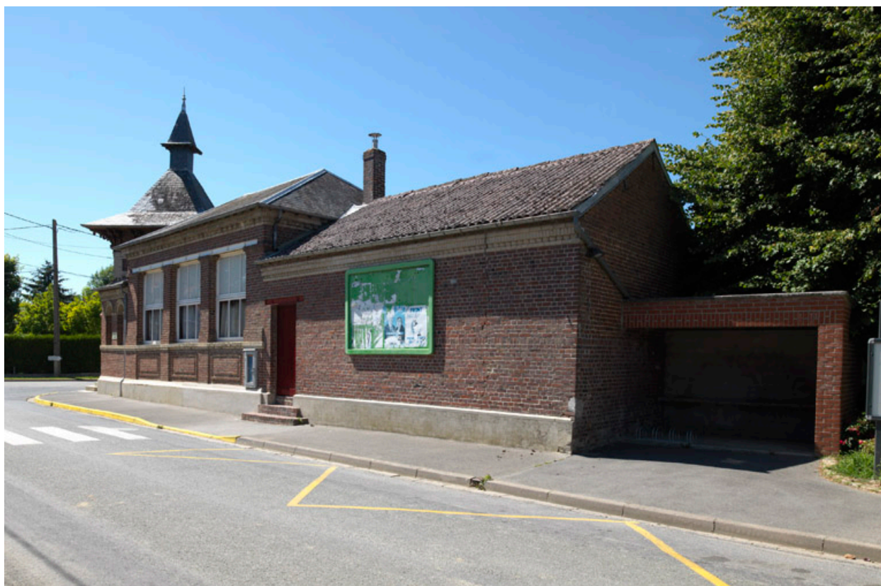
Vue des façades, rue d'Enfer.