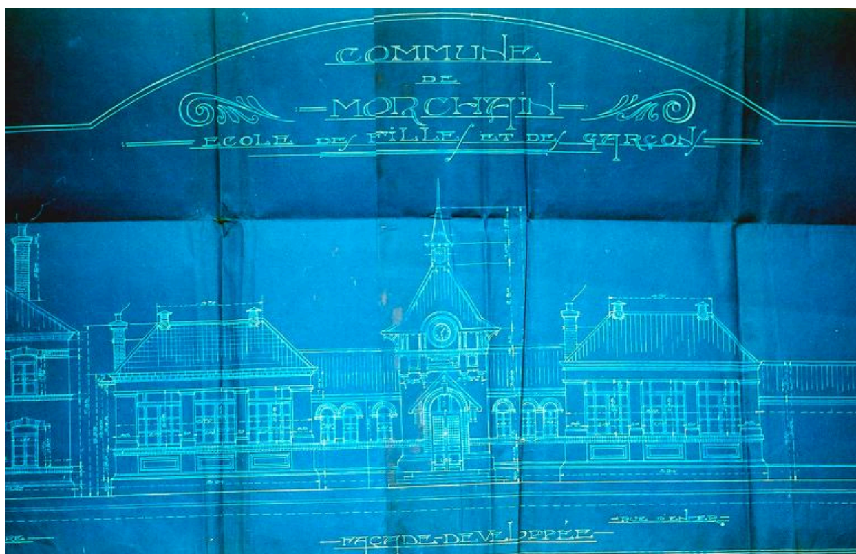
Projet de reconstruction de l'école, façade développée, A. Hunot (architecte), 1er mars 1923 (AD Somme ; 99 O 2762).