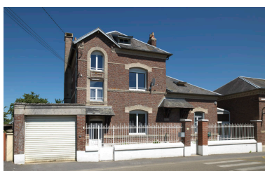
Vue du logement d'instituteur. IVR22_20158000654NUC2A