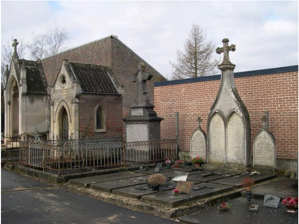
Vue générale en 2005, avant rénovation.