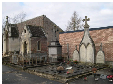
Vue générale en 2005, avant rénovation. IVR22_20058010077NUCA