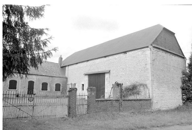
Grange et logis attenant.