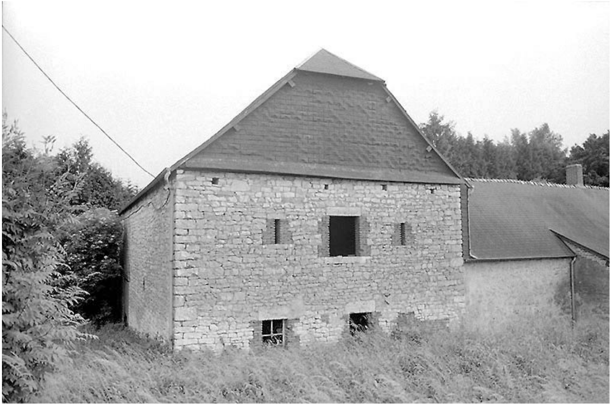
Elévation postérieure de la grange.