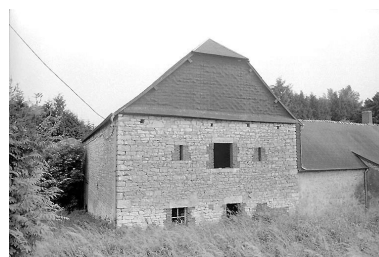
Elévation postérieure de la grange. IVR22_19980201498Z