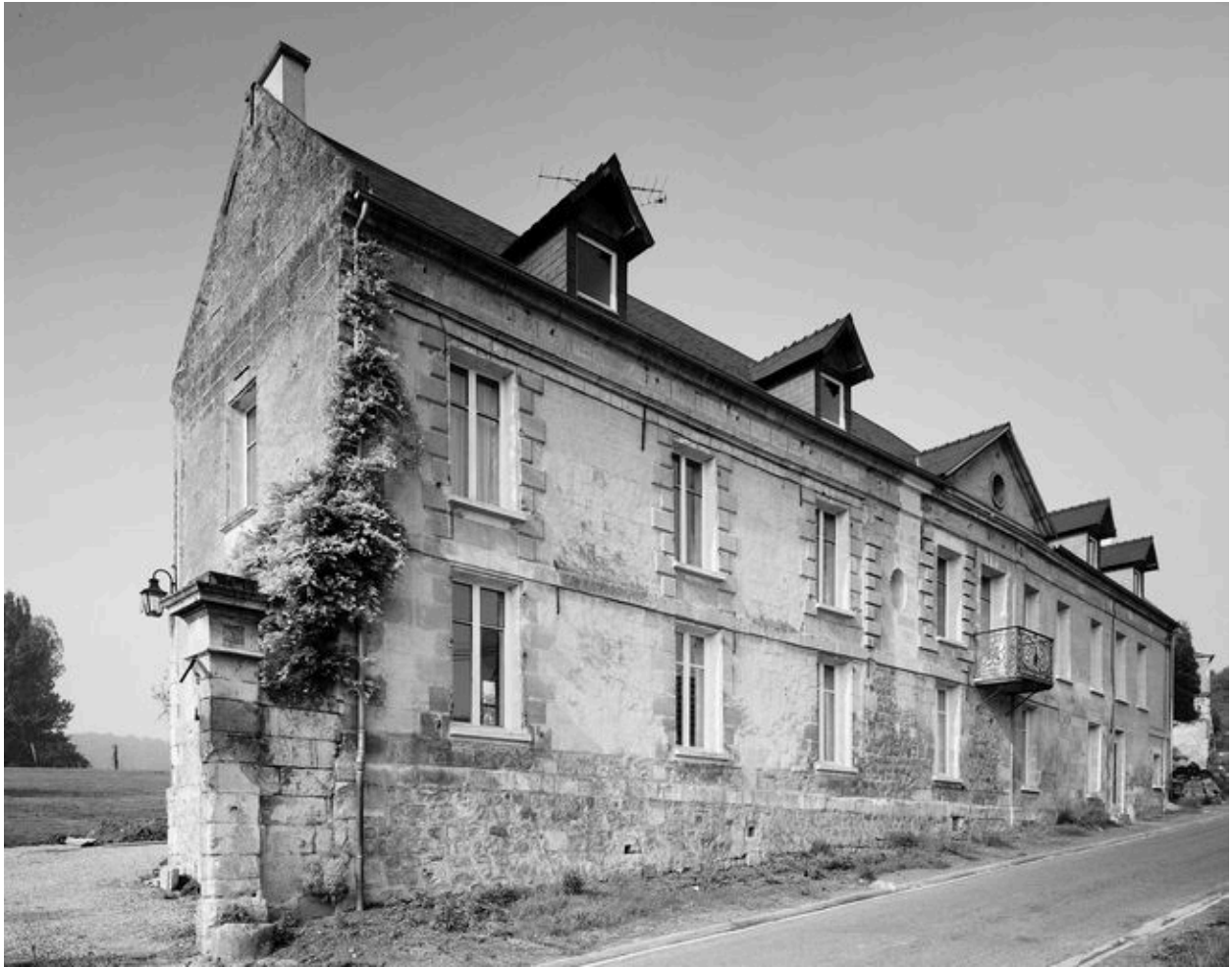
Logis. Elévation antérieure.