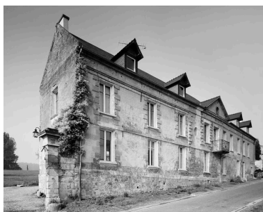
Logis. Elévation antérieure. IVR22_19846001224V