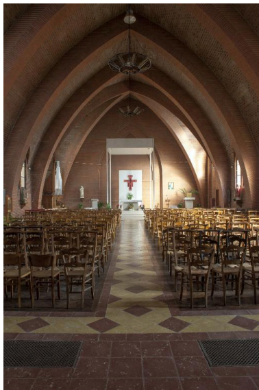
Vue générale vers le chœur. IVR31_20155900173NUCA