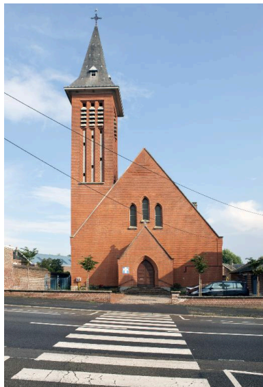
Élévation antérieure. IVR31_20155900172NUCA