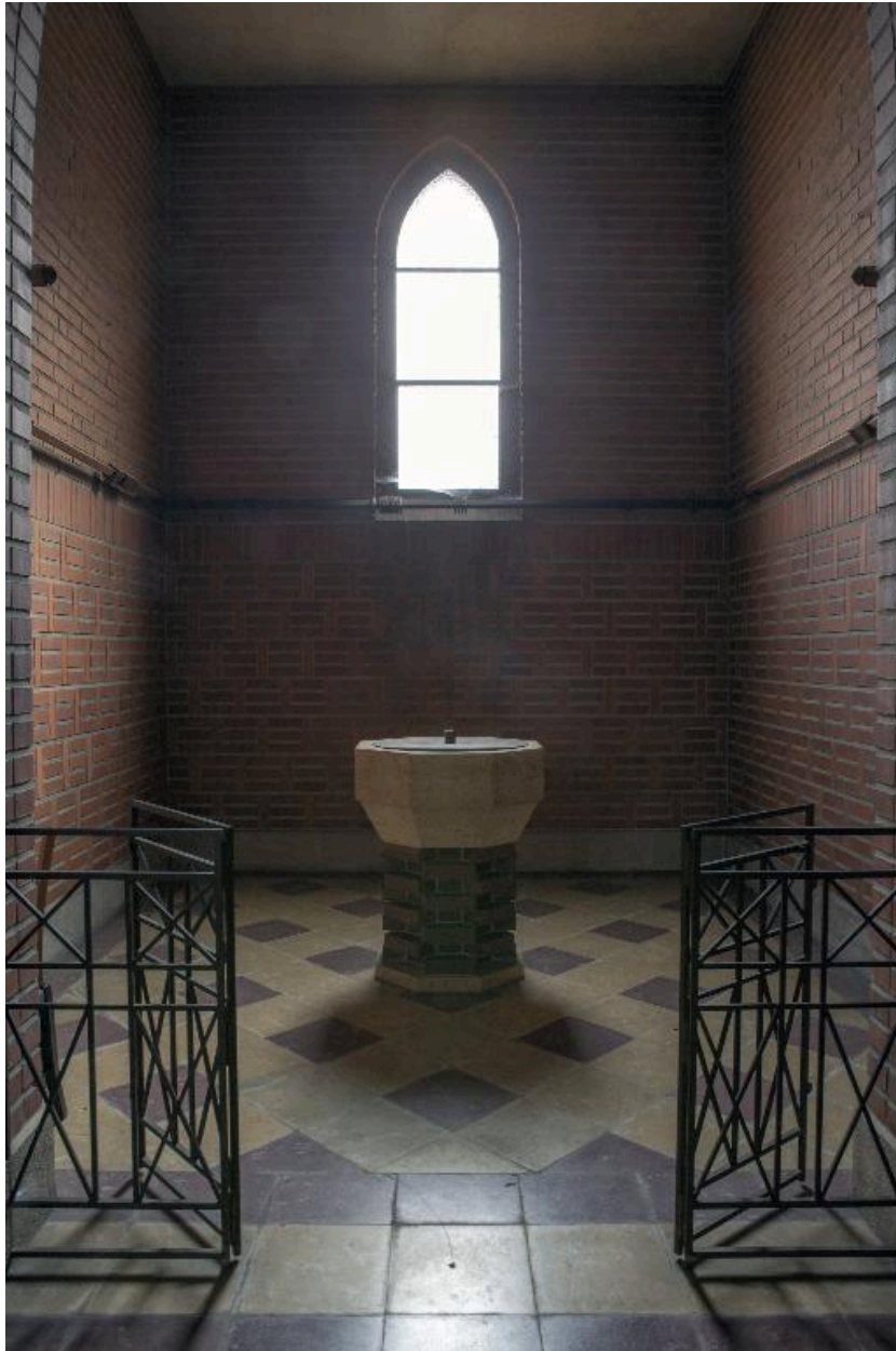
Fonts baptismaux, chapelle droite.