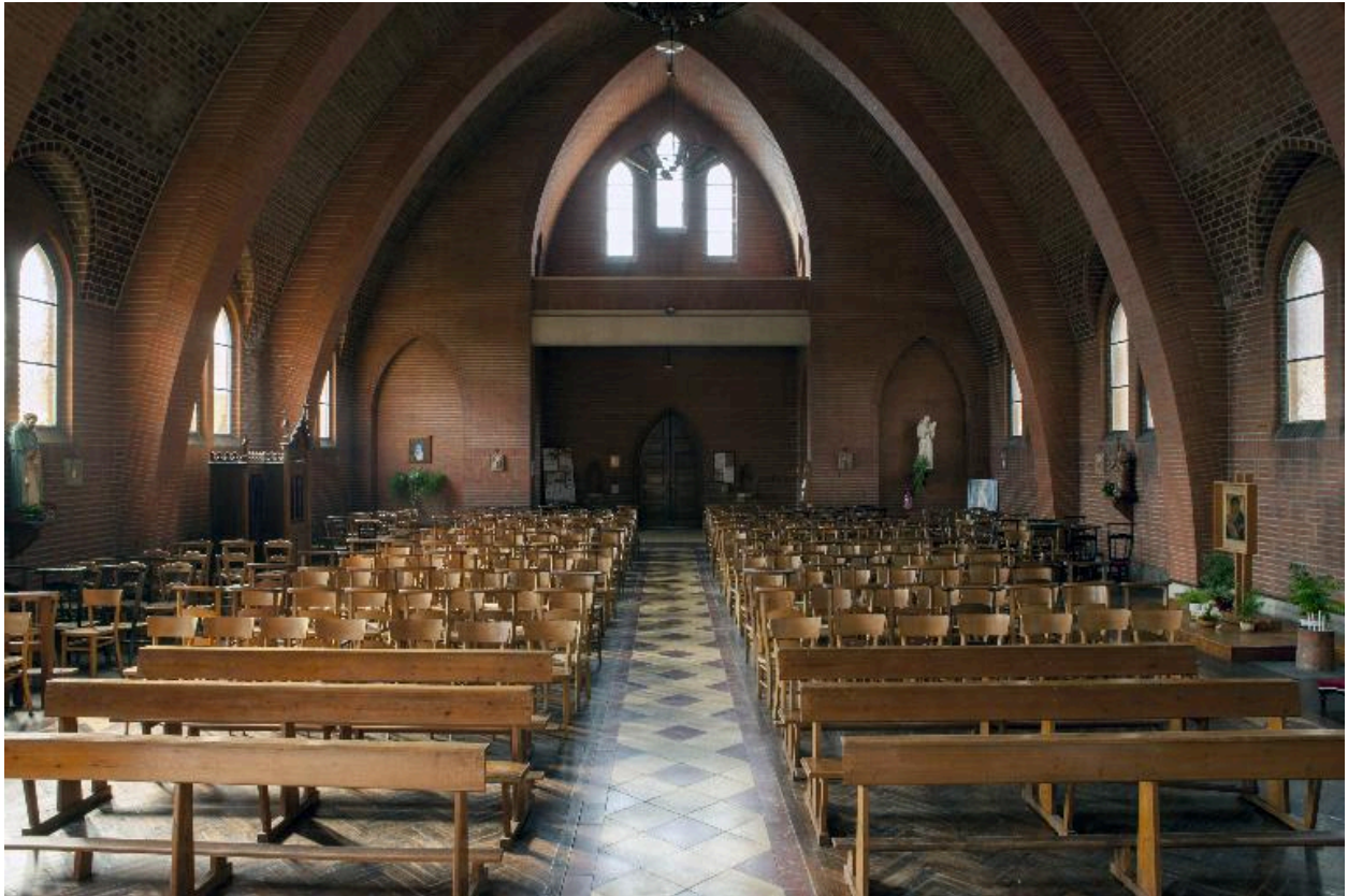
Vue générale depuis le chœur.