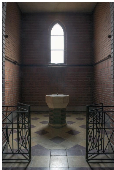
Fonts baptismaux, chapelle droite.