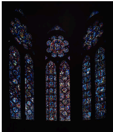
Vue d'ensemble des verrières de la chapelle d'axe (baie 2 à droite)