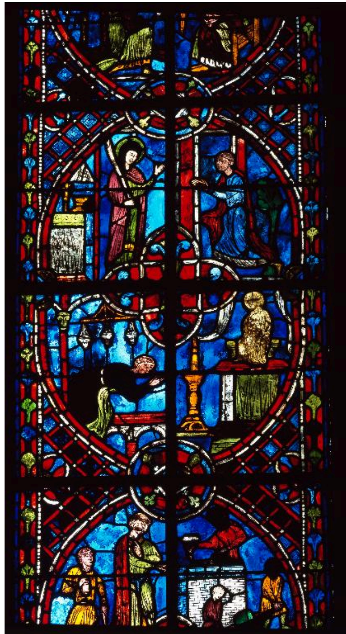
Vue de détail : Théophile demande l'intercession de la Vierge.