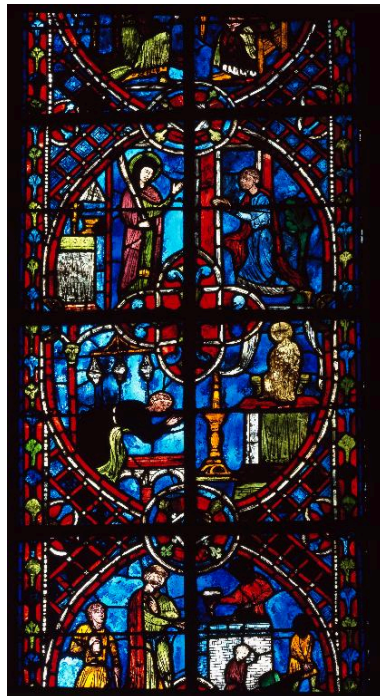
Vue de détail : Théophile demande l'intercession de la Vierge. IVR22_19976000454XA