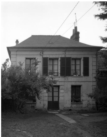
Elévation antérieure. IVR22_19856001407V