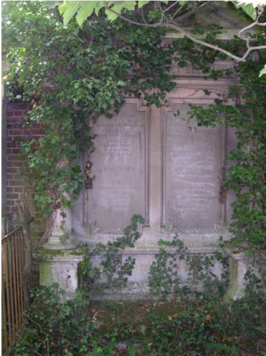
Vue de la stèle du tombeau Gallet-Beldame.