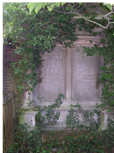
Vue de la stèle du tombeau Gallet-Beldame.

Phot. Thierry Lefébure IVR22_20058000997NUCA