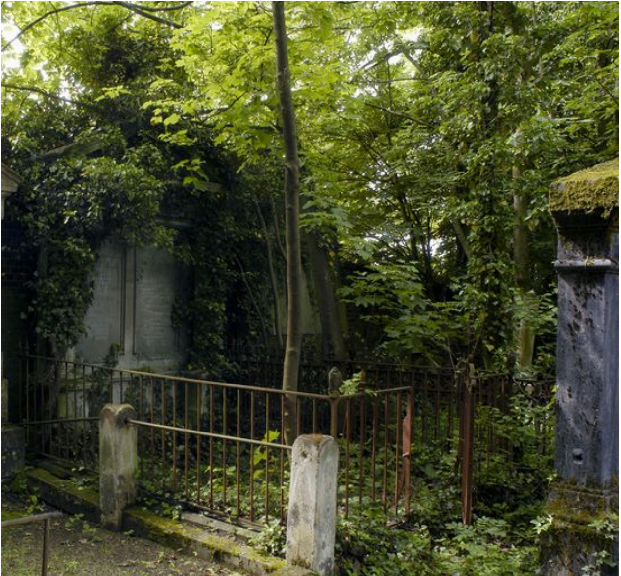
Vue du tombeau de la famille Gallet-Beldame.