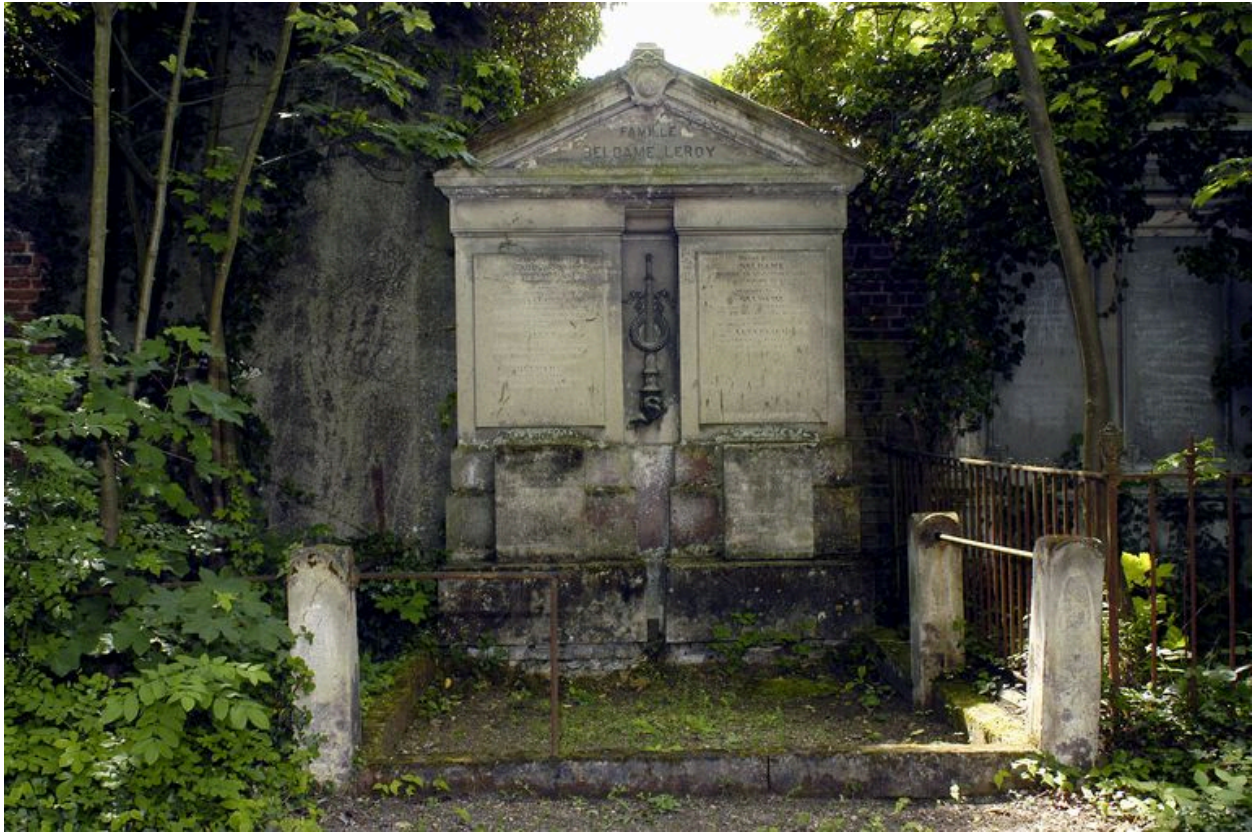
Vue du tombeau de la famille Beldame-Leroy, A. Sallé, vers 1843.