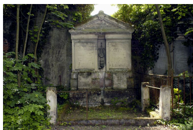
Vue du tombeau de la famille Beldame-Leroy, A. Sallé, vers 1843.

Phot. Thierry Lefébure IVR22_20058000998NUCA