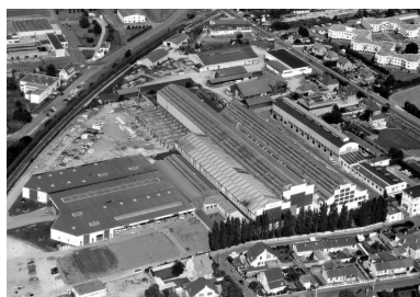
Vue aérienne, en 1991.