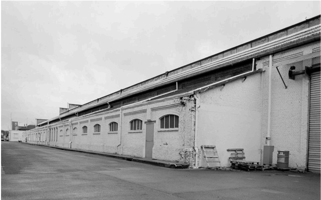
Atelier de fabrication principal : flanc sud.