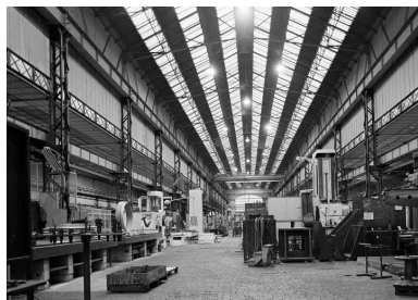
Atelier de fabrication principal : vue intérieure. IVR22_19936002463Z