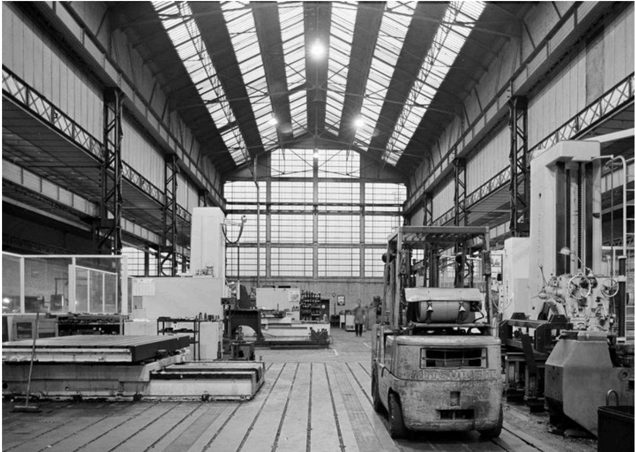
Atelier de fabrication principal : vue intérieure.