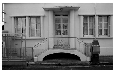
Les bureaux : détail de l'entrée et du garde-corps en ferronnerie portant les initiales ACC. IVR22_19936002458Z