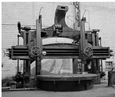
Machine à polir. IVR22_19936002470Z