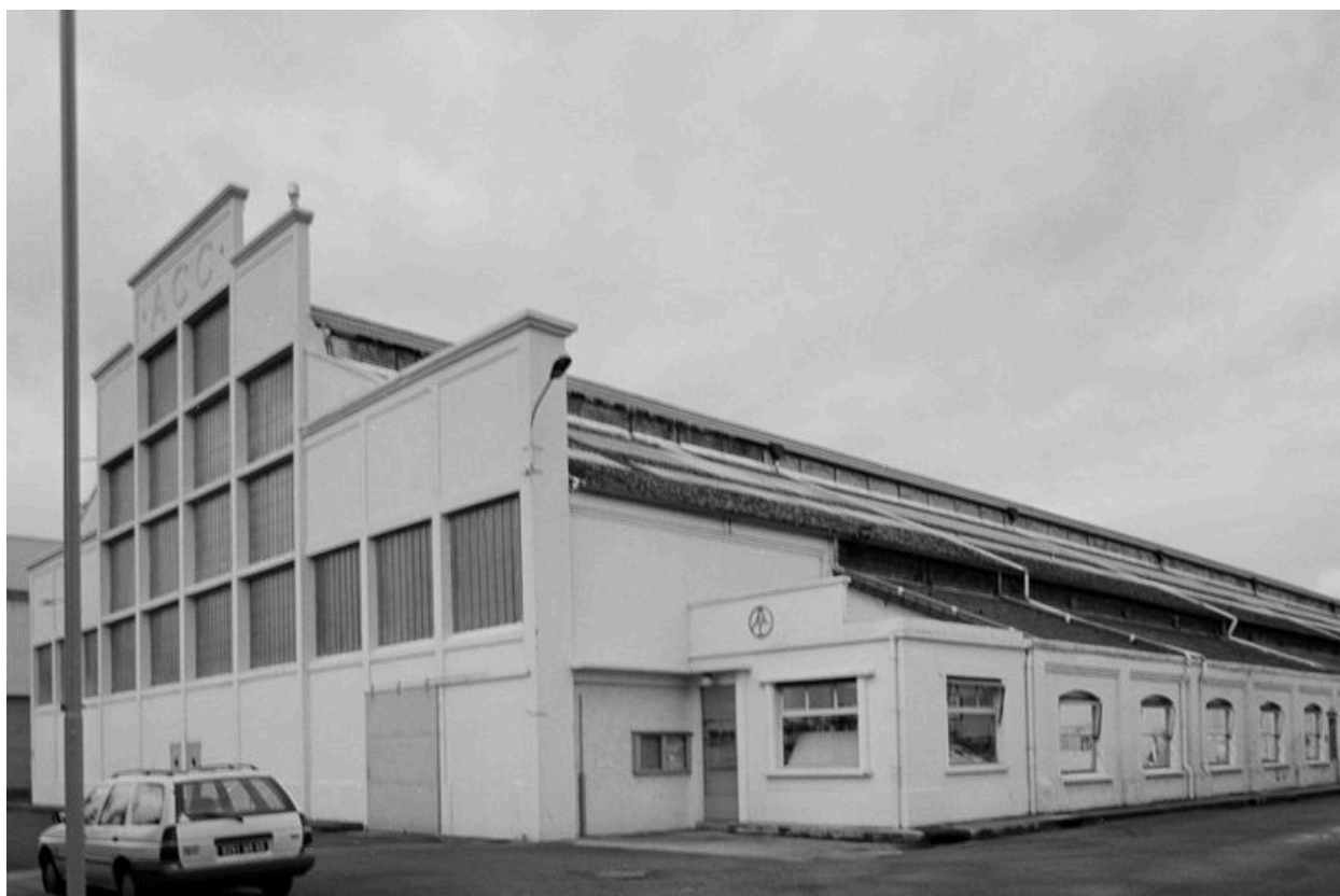
Atelier de fabrication : flanc sud-ouest.