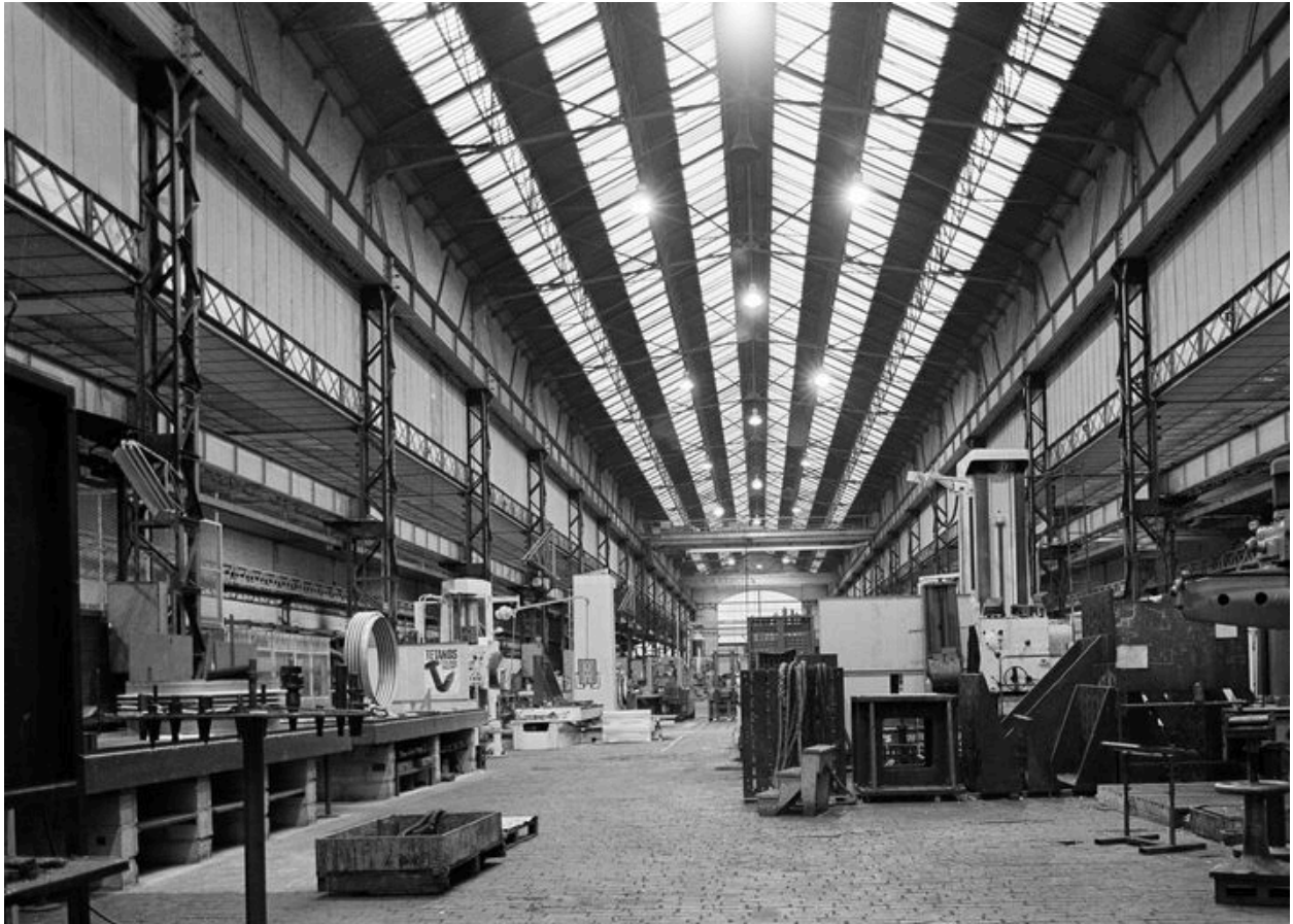
Atelier de fabrication principal : vue intérieure.