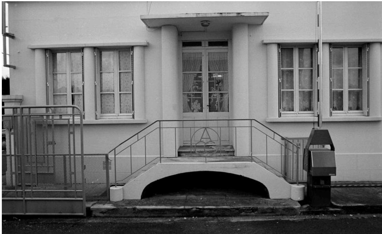
Les bureaux : détail de l'entrée et du garde-corps en ferronnerie portant les initiales ACC.