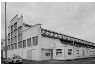
Atelier de fabrication : flanc sud-ouest.