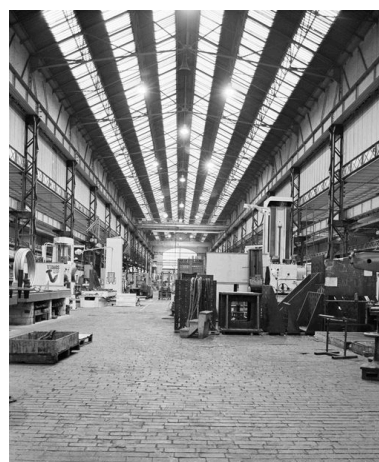
Atelier de fabrication principal : vue intérieure.