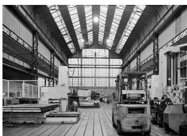
Atelier de fabrication principal : vue intérieure.