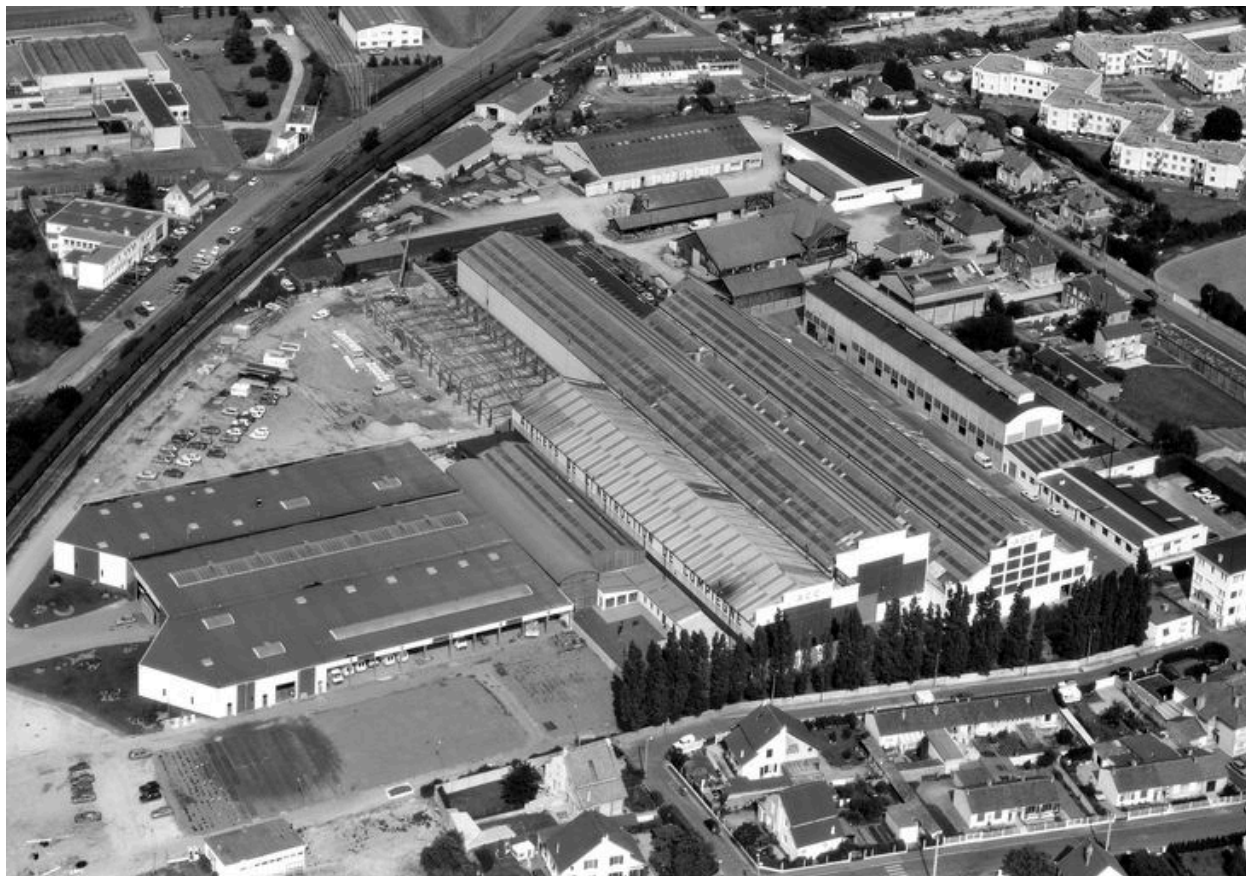
Vue aérienne, en 1991.