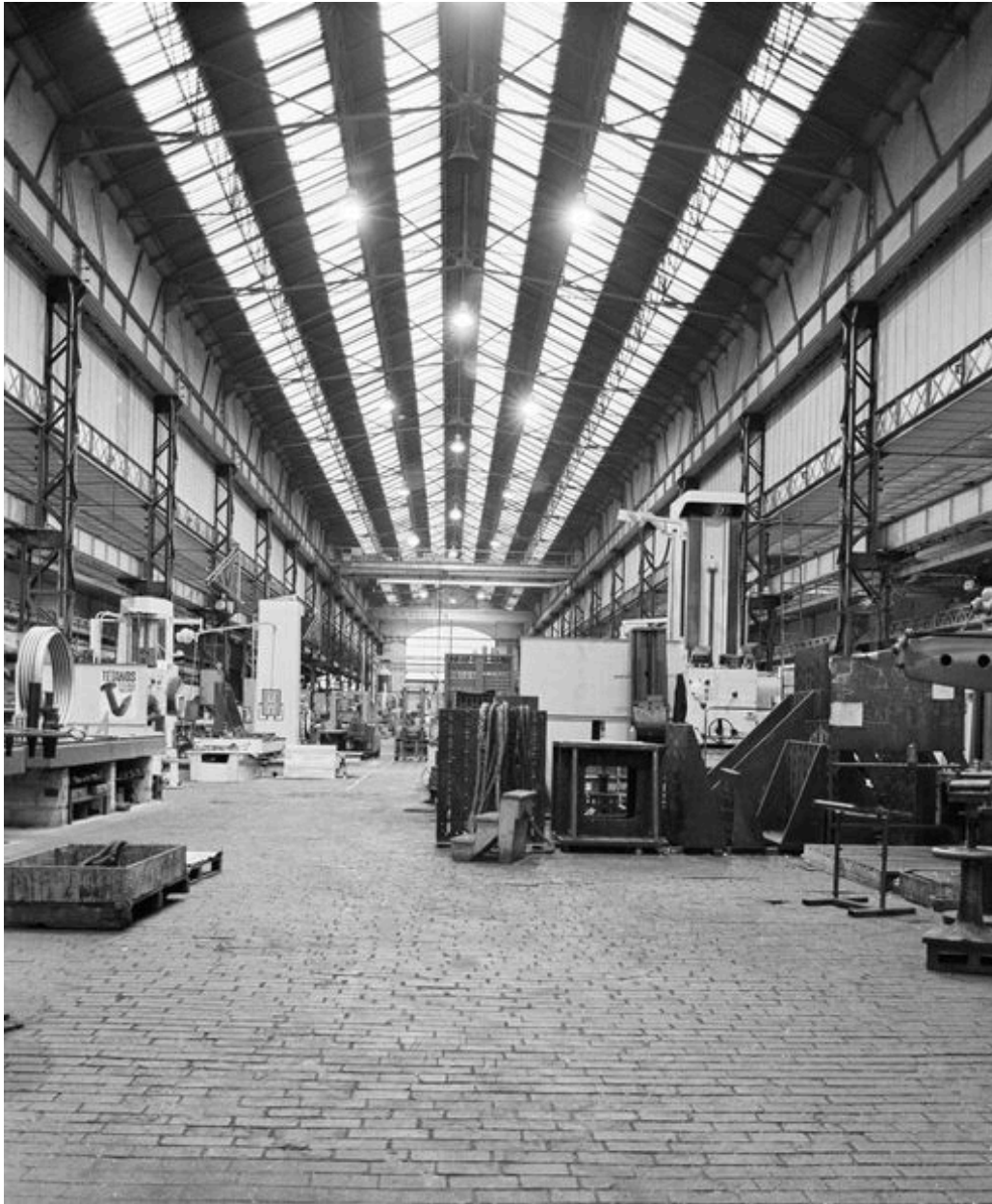
Atelier de fabrication principal : vue intérieure.