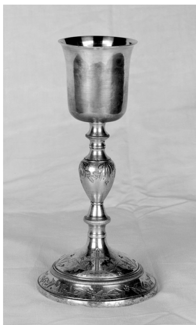
Calice n°1, 1ère moitié 19e siècle.