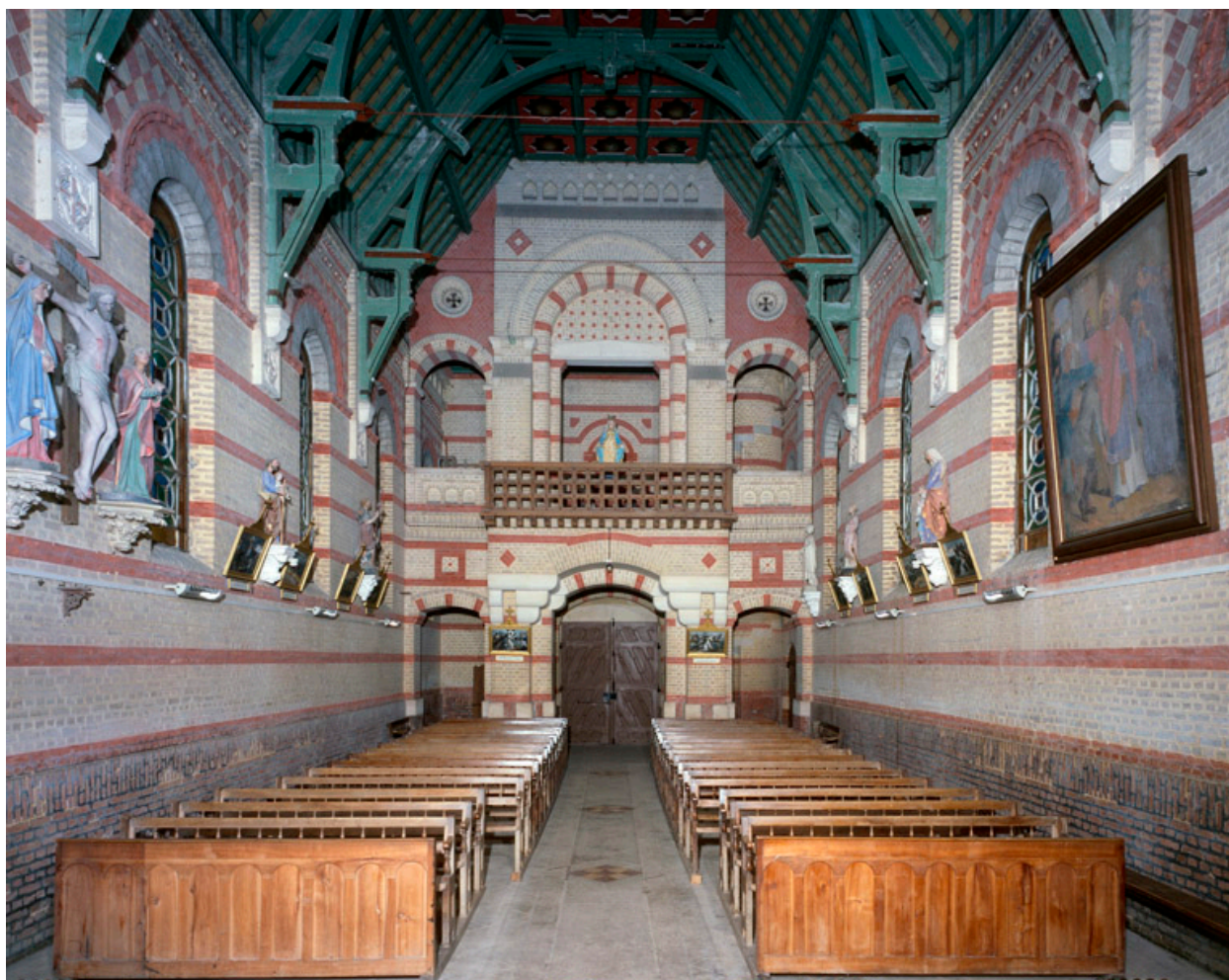
Vue intérieure, depuis le chœur.