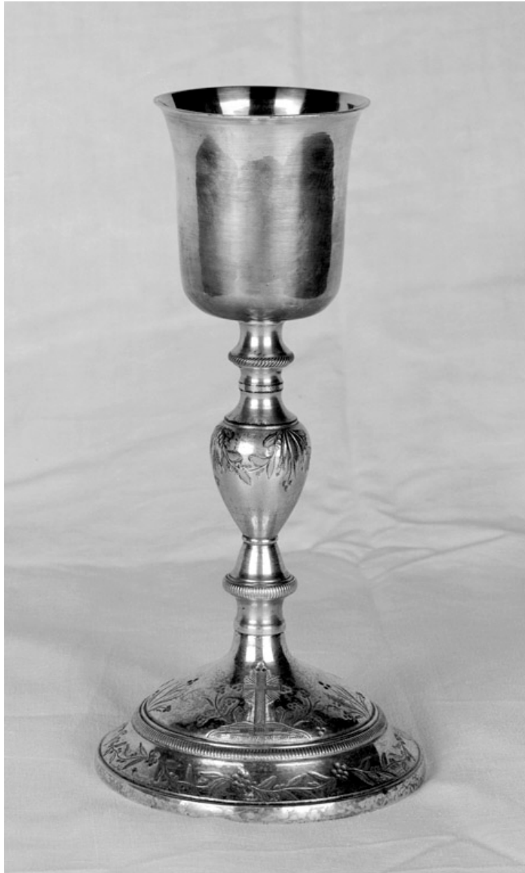
Calice n°1, 1ère moitié 19e siècle.