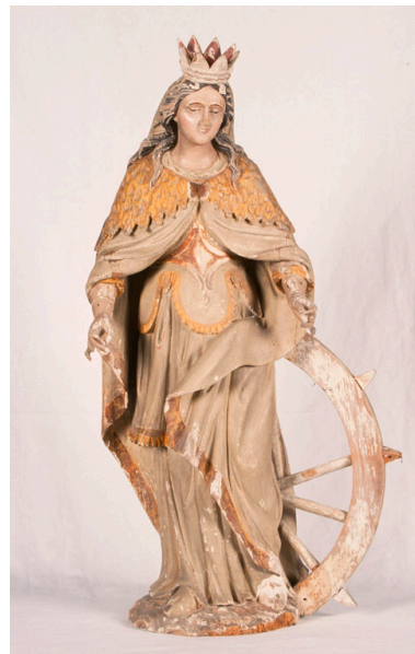
Statue de sainte Catherine à l'entrée du chœur, 19e siècle.