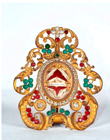
Reliquaire des saints Hippolyte, Firmin, Gentien, Fauste et de sainte Perpétue, 19e siècle.