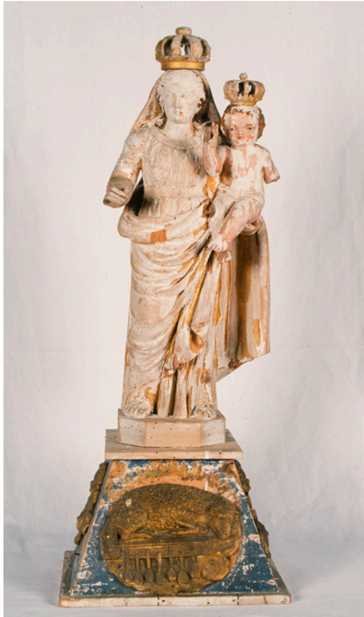
Statue de Vierge à l'Enfant sur un socle, 19e siècle.