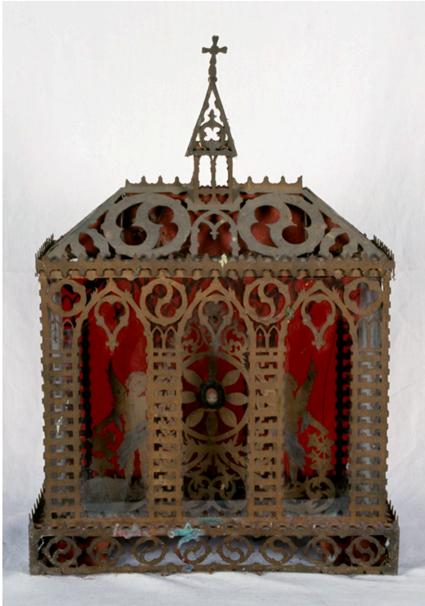
Reliquaire de saint Vaast, fin 19e siècle.