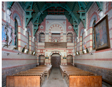
Vue intérieure, depuis le chœur.