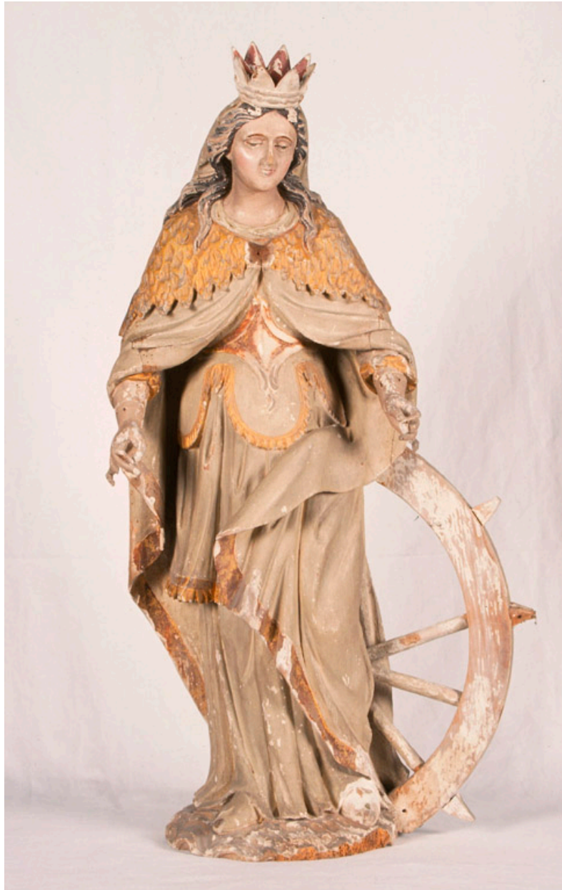
Statue de sainte Catherine à l'entrée du chœur, 19e siècle.