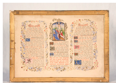
Partie centrale des canons d'autel de style médiéval, avec décor peint à la main : au milieu, la Crucifixion.