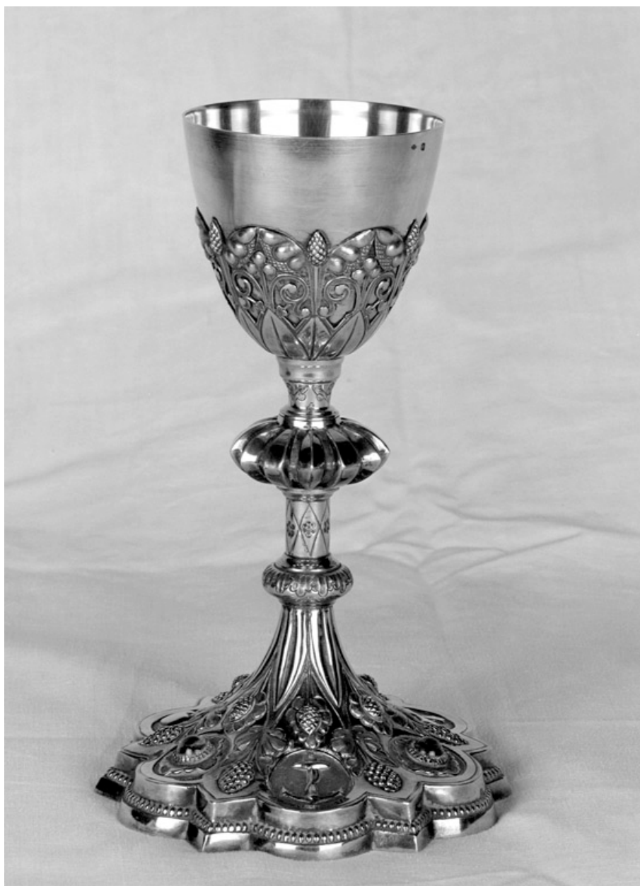
Calice n°2, Jamain et Chevron, vers 1870.