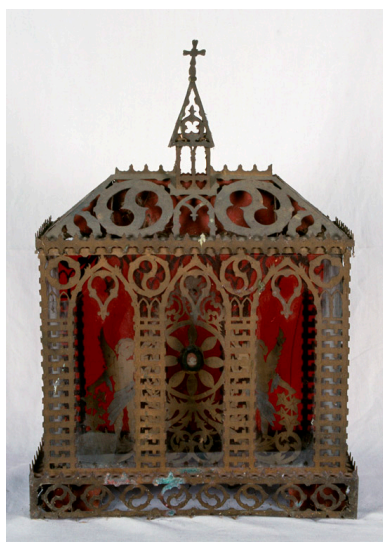
Reliquaire de saint Vaast, fin 19e siècle.