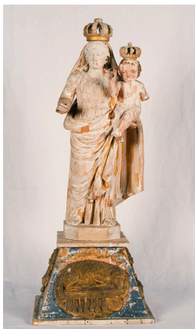
Statue de Vierge à l'Enfant sur un socle, 19e siècle.