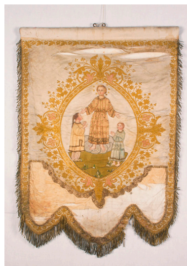
Bannière de procession, fin du 19e siècle : Laissez venir à moi les petits enfants.