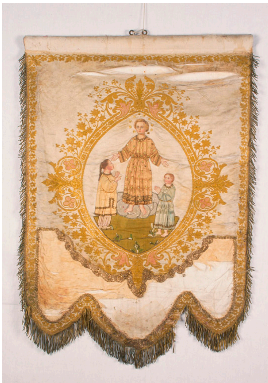
Bannière de procession, fin du 19e siècle : Laissez venir à moi les petits enfants.