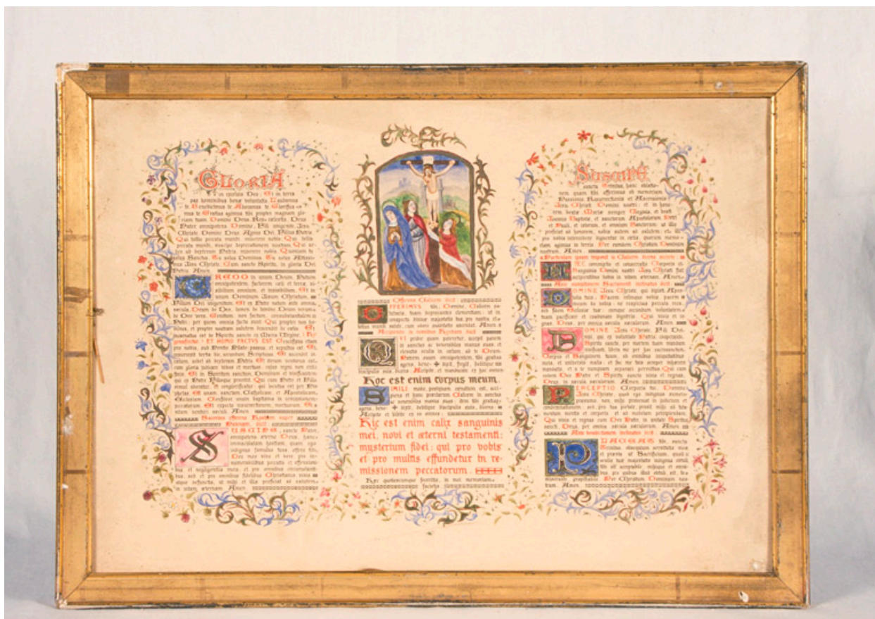
Partie centrale des canons d'autel de style médiéval, avec décor peint à la main : au milieu, la Crucifixion.