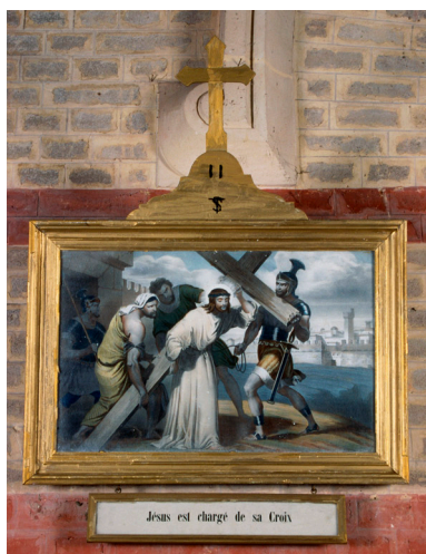
Chemin de croix, station II. Chromolithographie, fin 19e siècle.