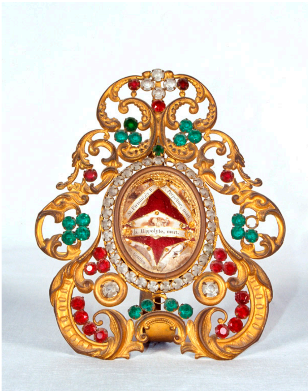
Reliquaire des saints Hippolyte, Firmin, Gentien, Fauste et de sainte Perpétue, 19e siècle.