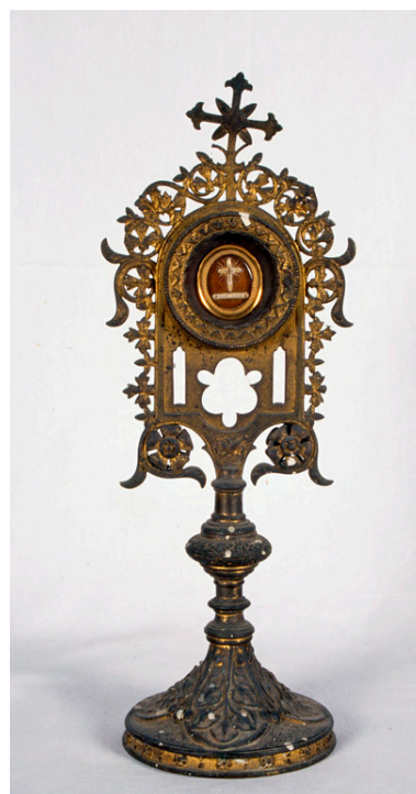
Reliquaire de la Sainte Croix, 19e siècle. IVR22_19998000145ZA