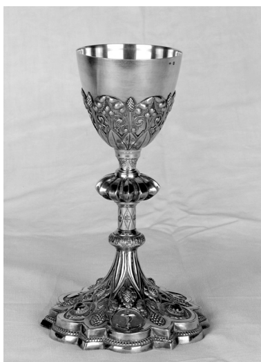
Calice n°2, Jamain et Chevron, vers 1870.