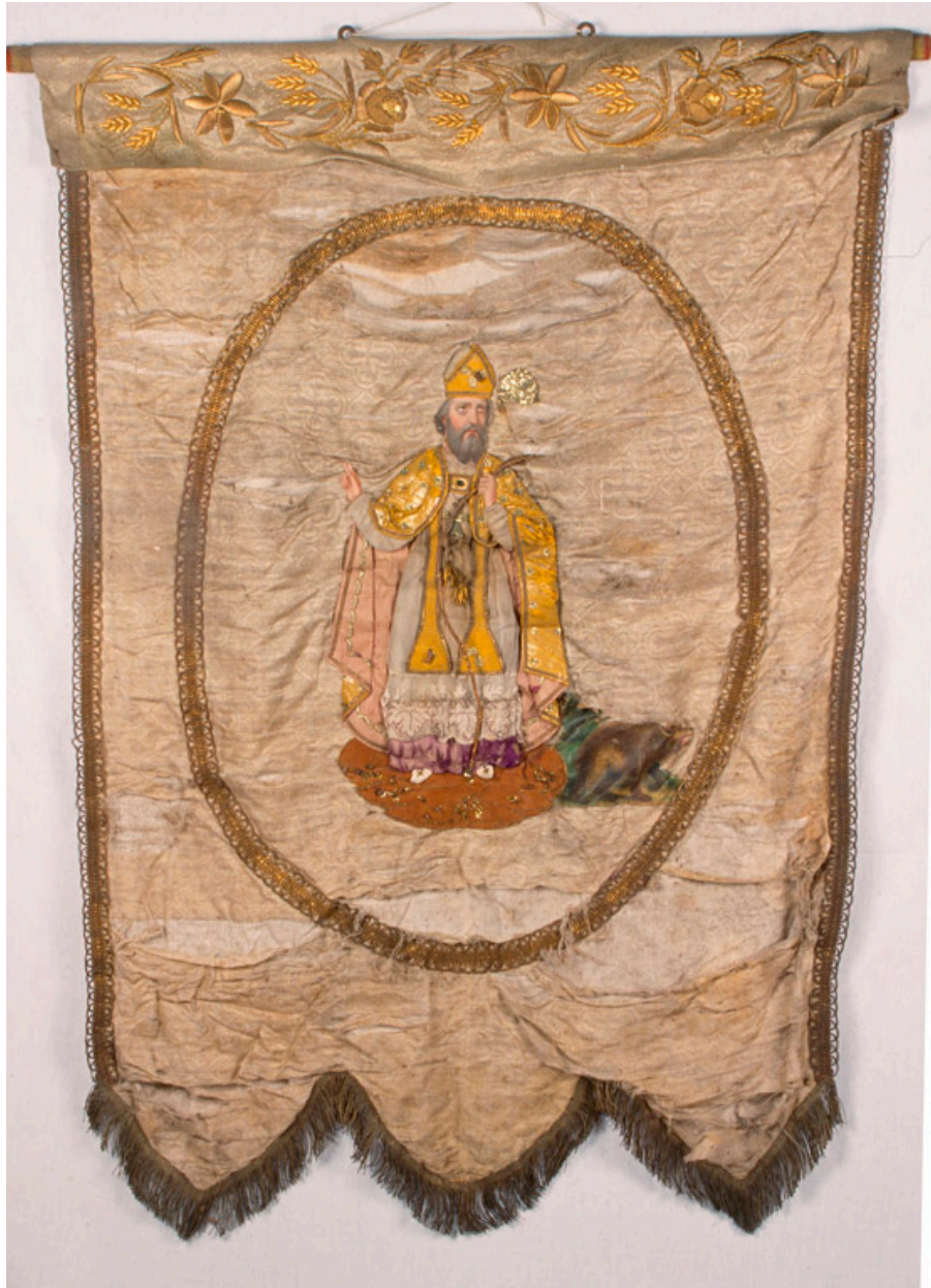
Bannière de procession en damas de soie blanche, fin 19e siècle : saint Vaast.