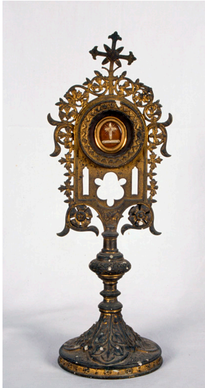
Reliquaire de la Sainte Croix, 19e siècle.