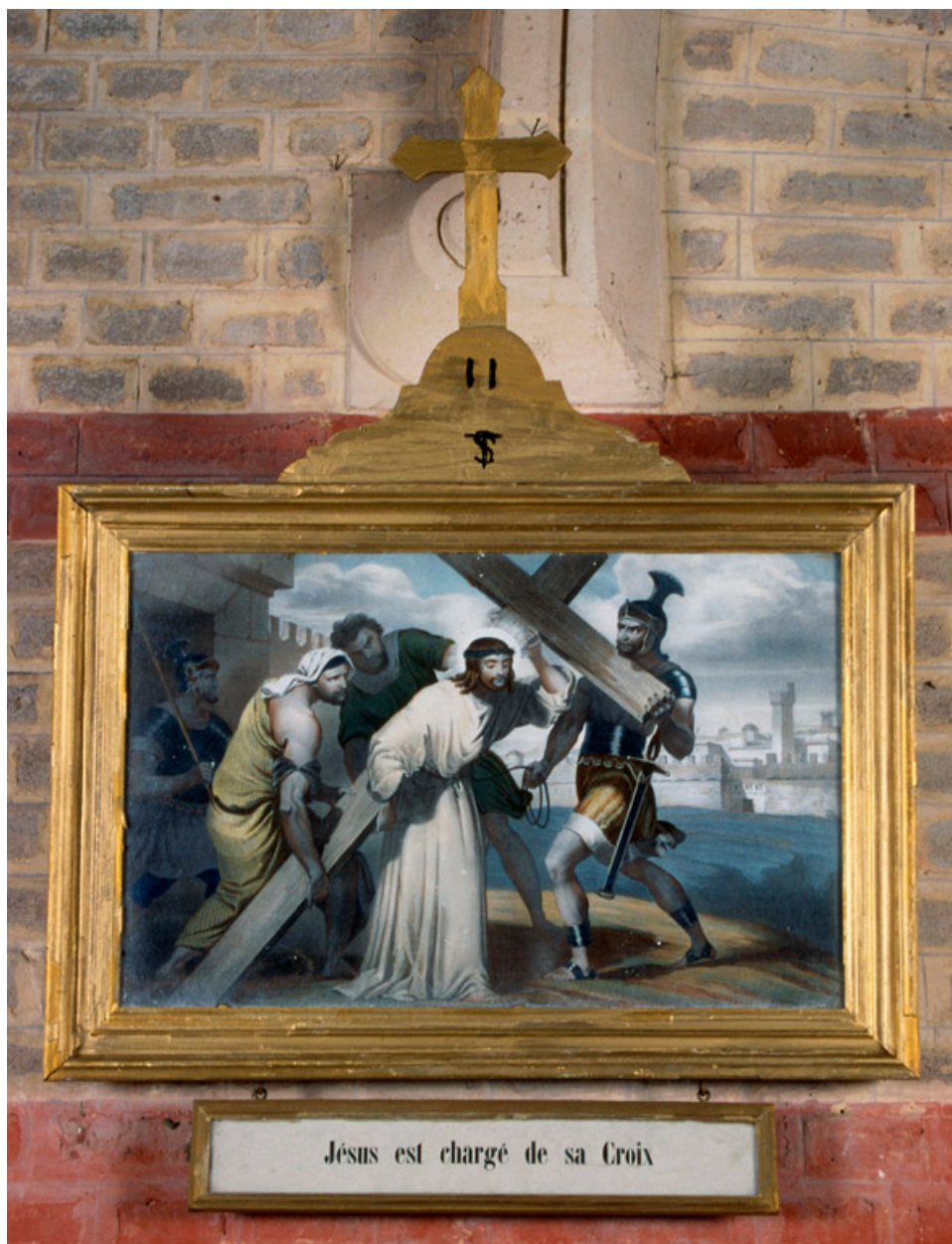
Chemin de croix, station II. Chromolithographie, fin 19e siècle.