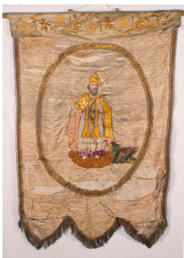
Bannière de procession en damas de soie blanche, fin 19e siècle : saint Vaast.