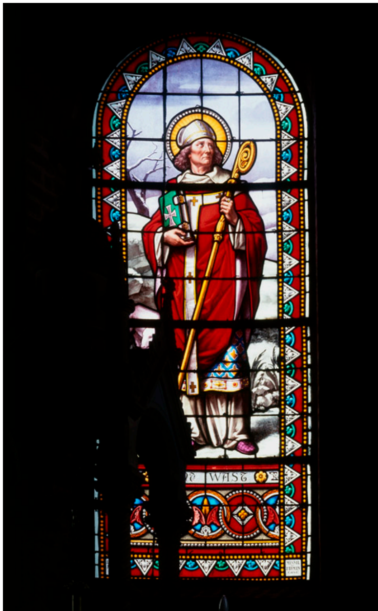
Verrière axiale (baie 0) : saint Vaast, par l'atelier Latteux-Bazin, 1899.