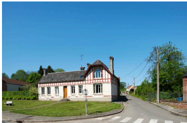
Vue d'ensemble de situation.