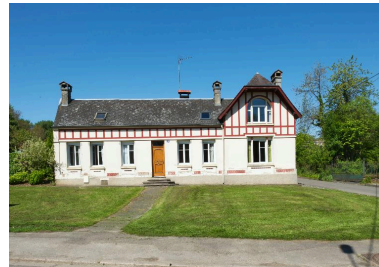
Vue d'ensemble de face.