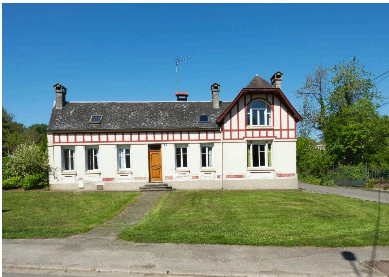
Vue d'ensemble de face.