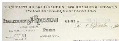
Papier à en-tête des établissements Rousseau, 1940 (AC Montataire ; 7F2). IVR22_20086005047NUCAB