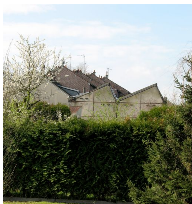
Vue de l'atelier de confection.