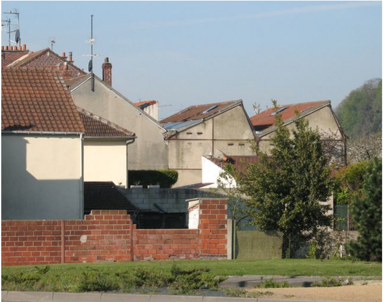
L'atelier de confection Rousseau et ses deux travées en sheds.