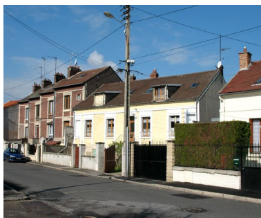
Maison d'habitation construite vers 1906. IVR22_20086005172NUCA