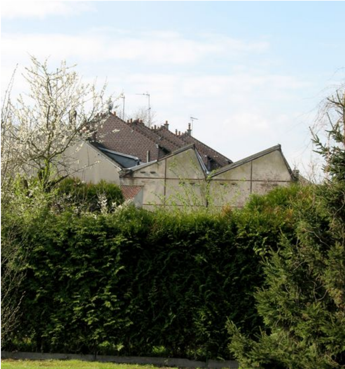
Vue de l'atelier de confection.