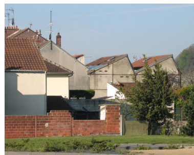
L'atelier de confection Rousseau et ses deux travées en sheds.