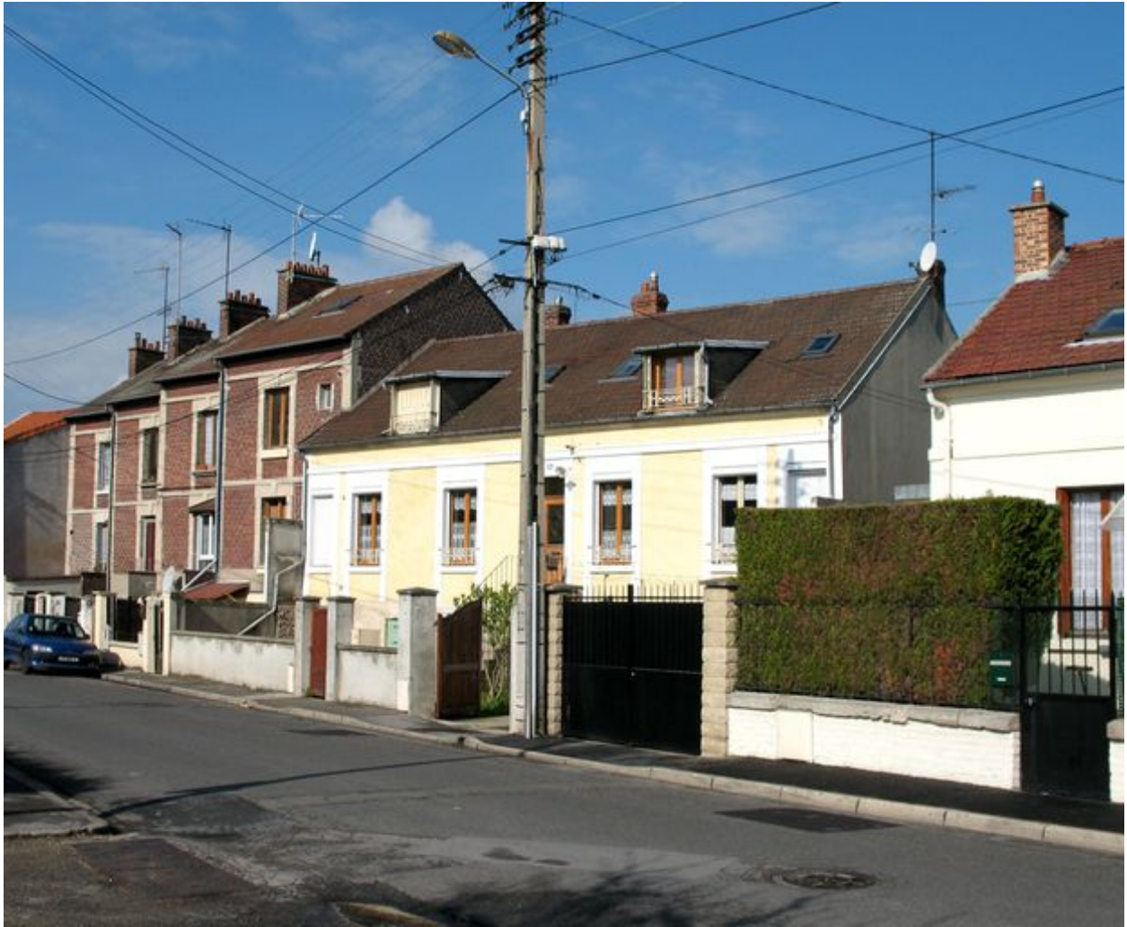
Maison d'habitation construite vers 1906.