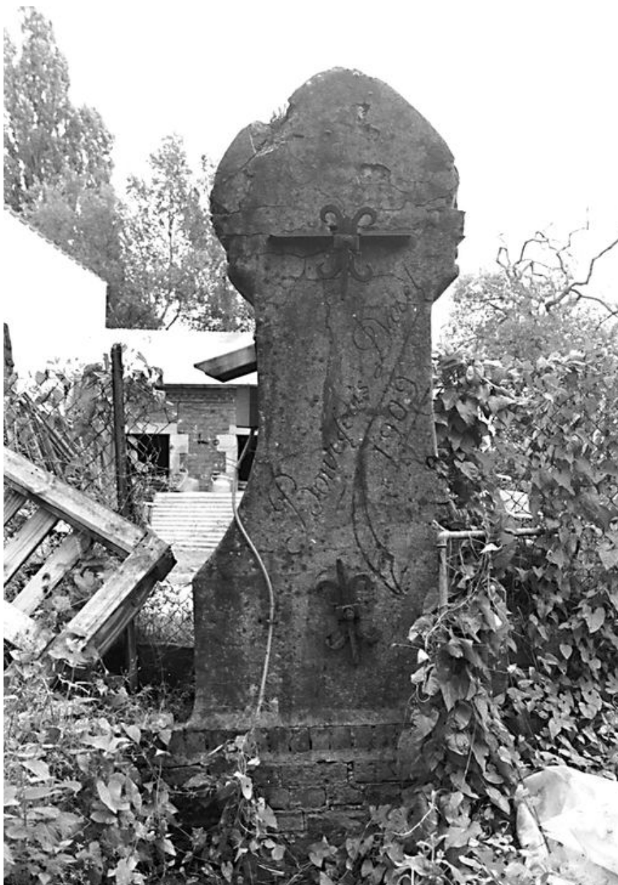
Puits de style Art Nouveau : élévation postérieure avec la signature 'Daret-Bourgeois 1909'.