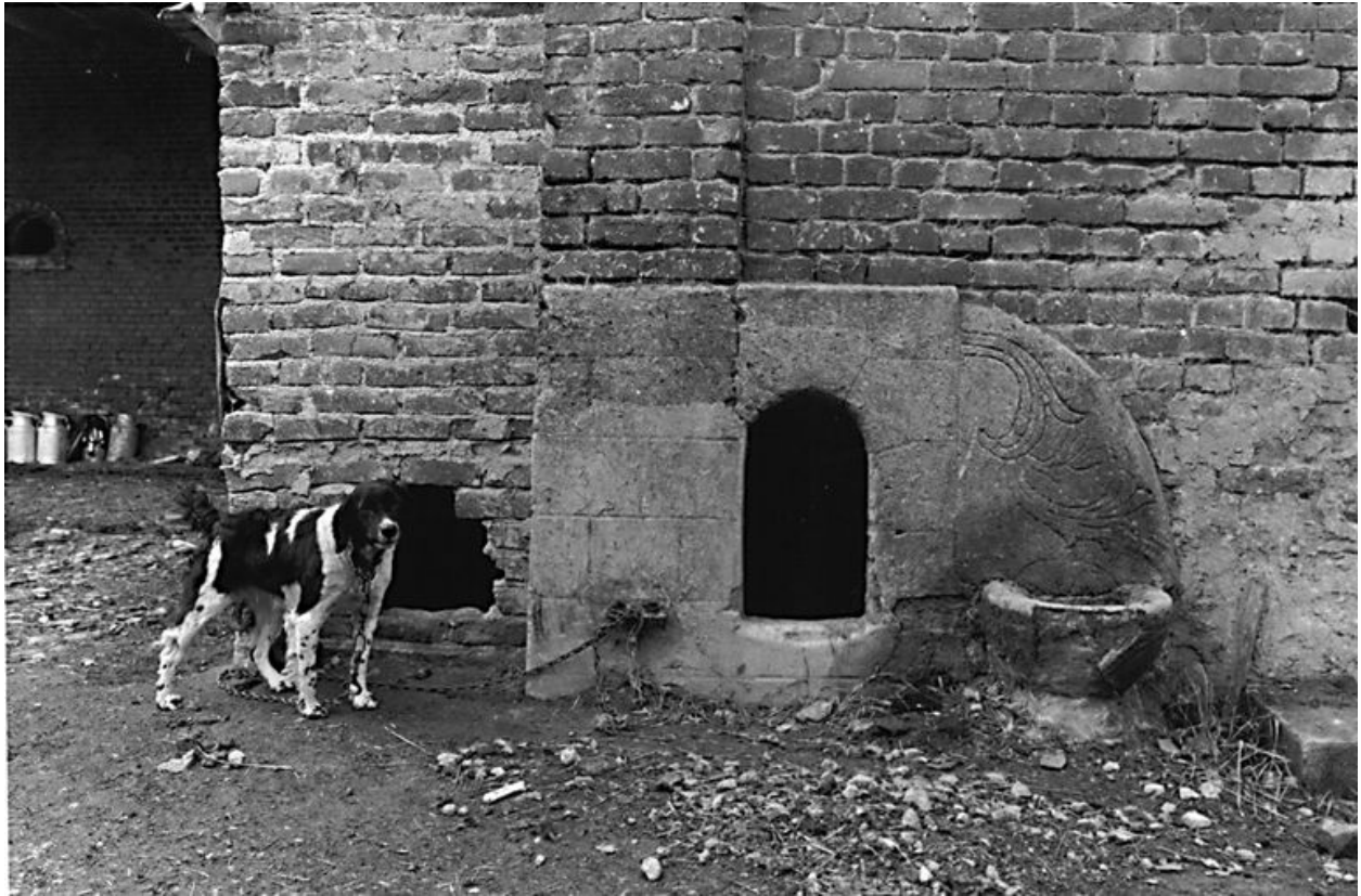
Elévation nord de la grange : niche à chien en ciment avec décor floral.