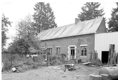
Vue du logis en brique. IVR22_19980202464Z