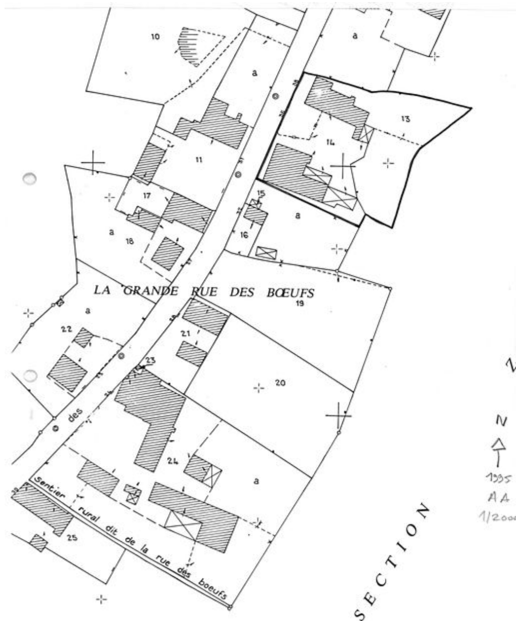
Plan de situation. Extrait du plan cadastral de 1995, section AA.