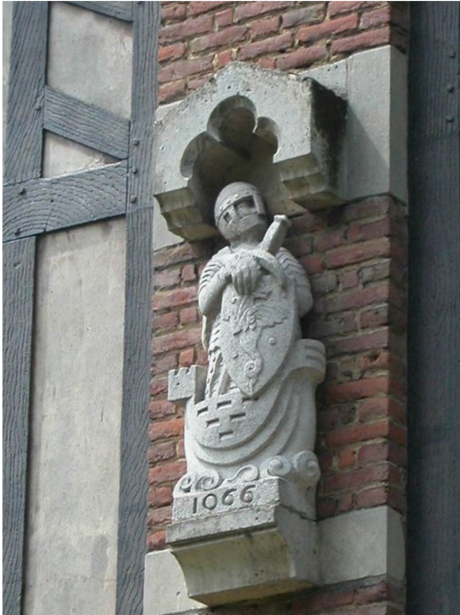
Détail du décor sculpté de la façade latérale gauche.