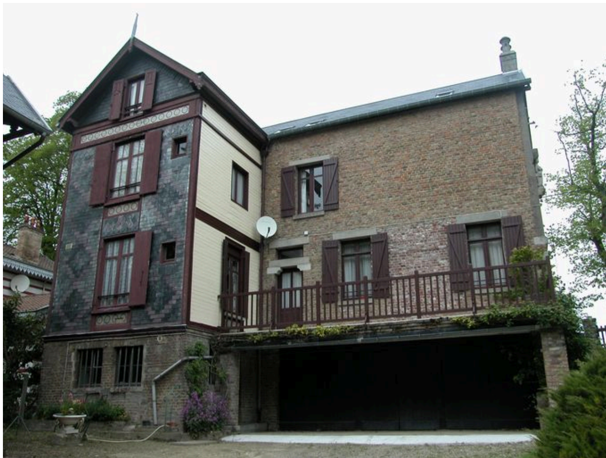
Elévation postérieure de la maison dite la Tour.