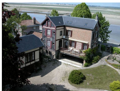
Vue d'ensemble depuis les fortifications de la Ville-Haute.