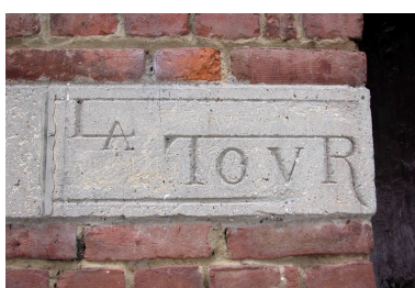
Détail de la pierre portant appellation.