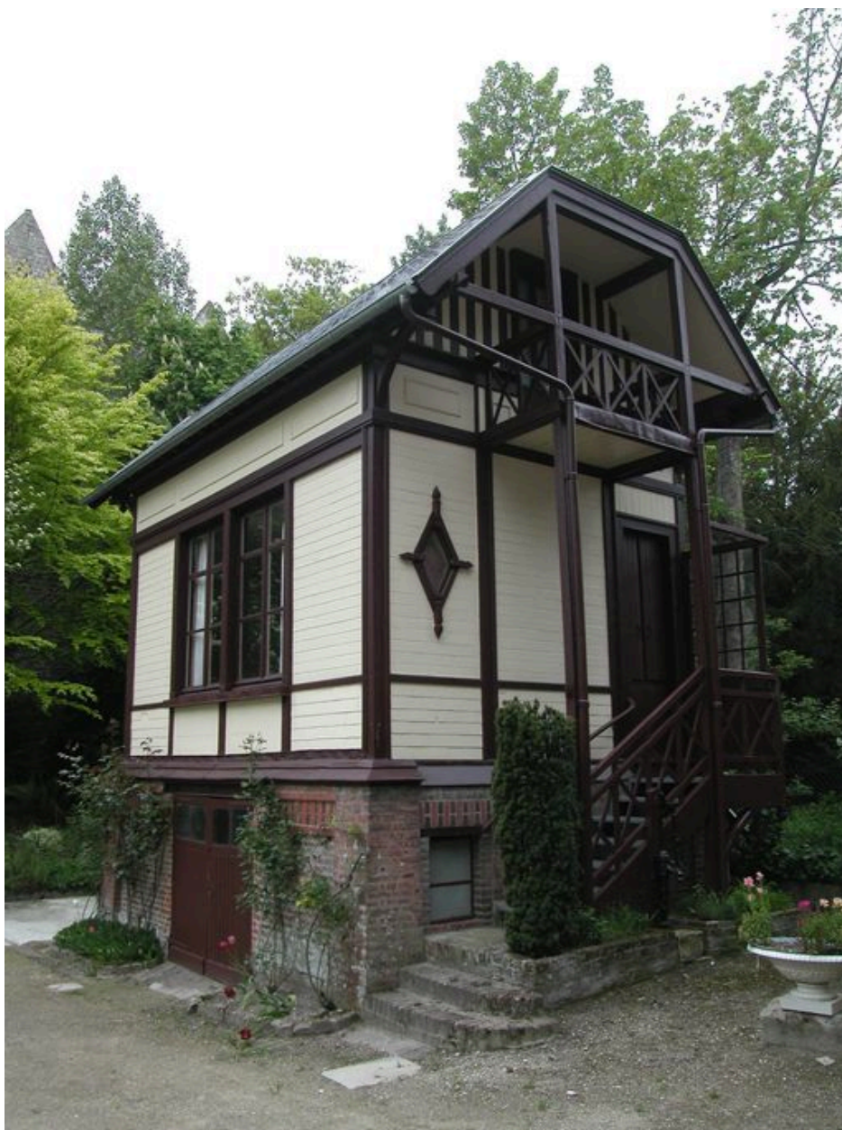
Vue d'ensemble des communs, vers l'entrée.