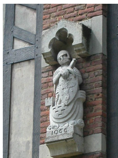
Détail du décor sculpté de la façade latérale gauche. IVR22_20038005409NUCA