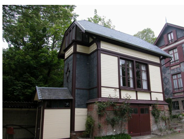
Vue d'ensemble des communs.