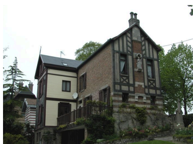
Vue de trois-quarts sur façades postérieure et latérale de la maison La Tour. IVR22_20048001424NUCA