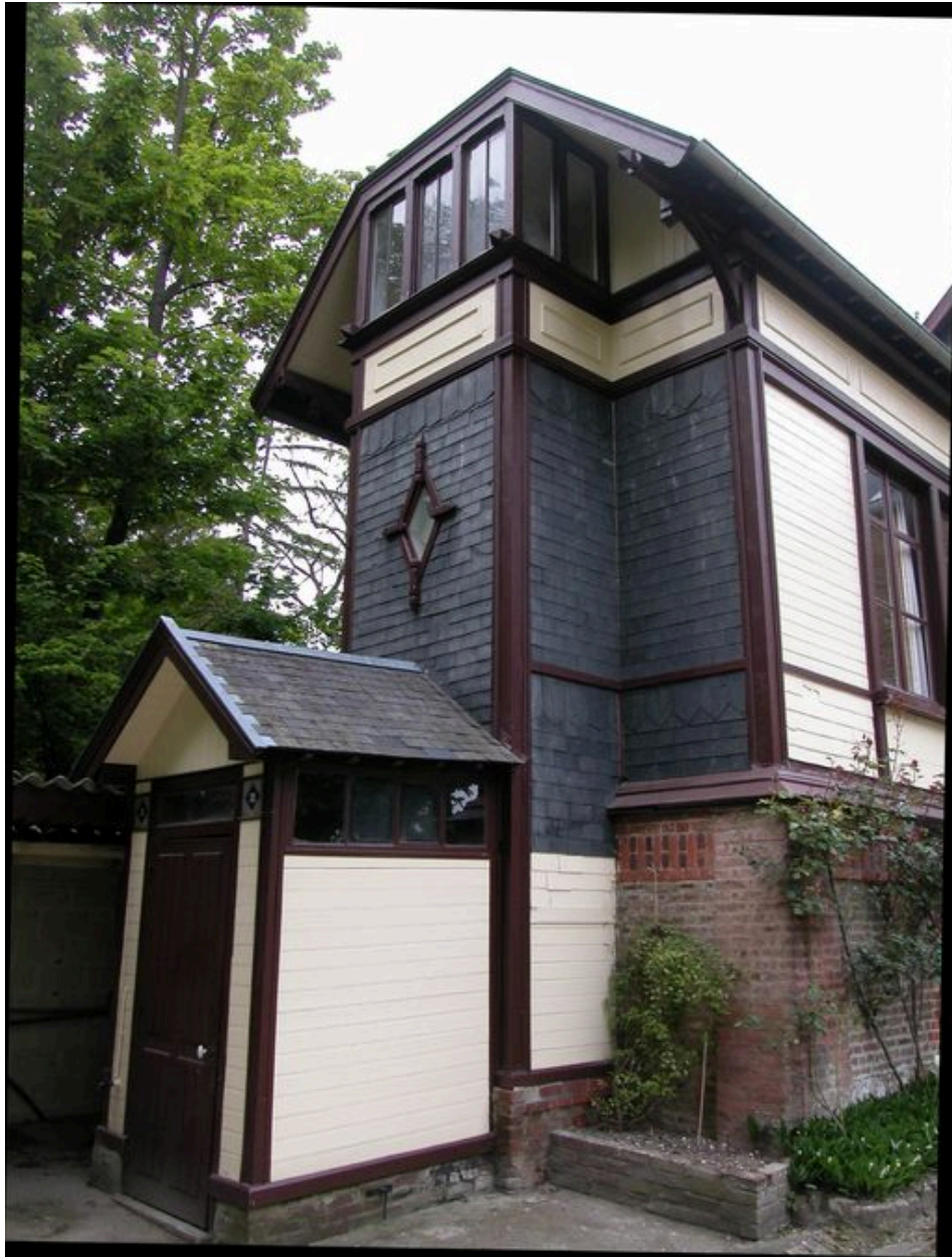
Détail des communs.