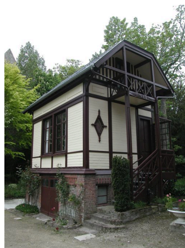
Vue d'ensemble des communs, vers l'entrée. IVR22_20048001428NUCA