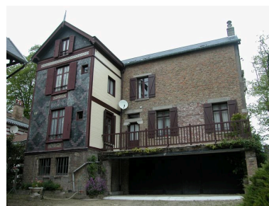
Élévation postérieure de la maison dite la Tour. IVR22_20048001429NUCA