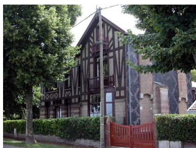
Vue d'ensemble sur la façade antérieure. IVR22_20038005408NUCA