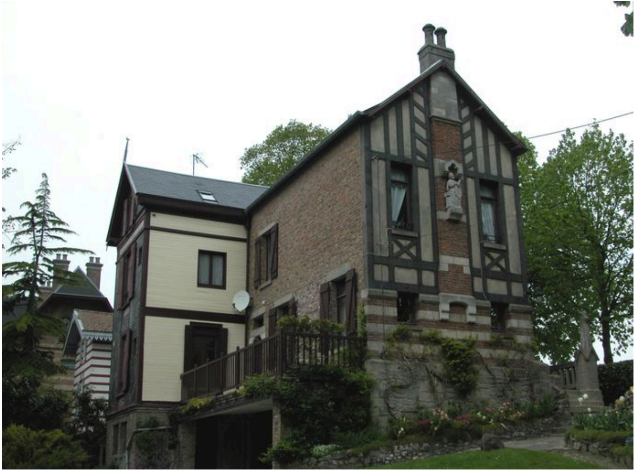
Vue de trois-quarts sur façades postérieure et latérale de la maison La Tour.