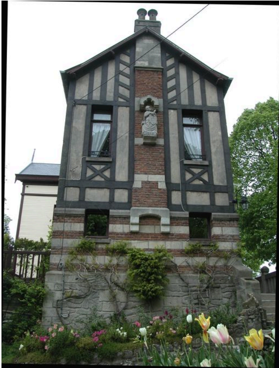
Elévation latérale gauche.