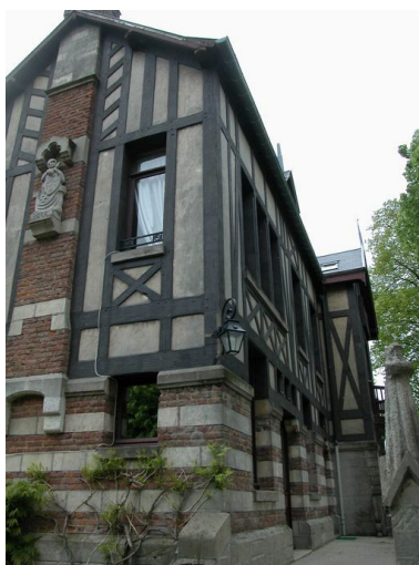
Vue d'ensemble et de trois- quarts sur les façades antérieure et latérale gauche.