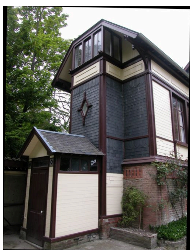
Détail des communs.