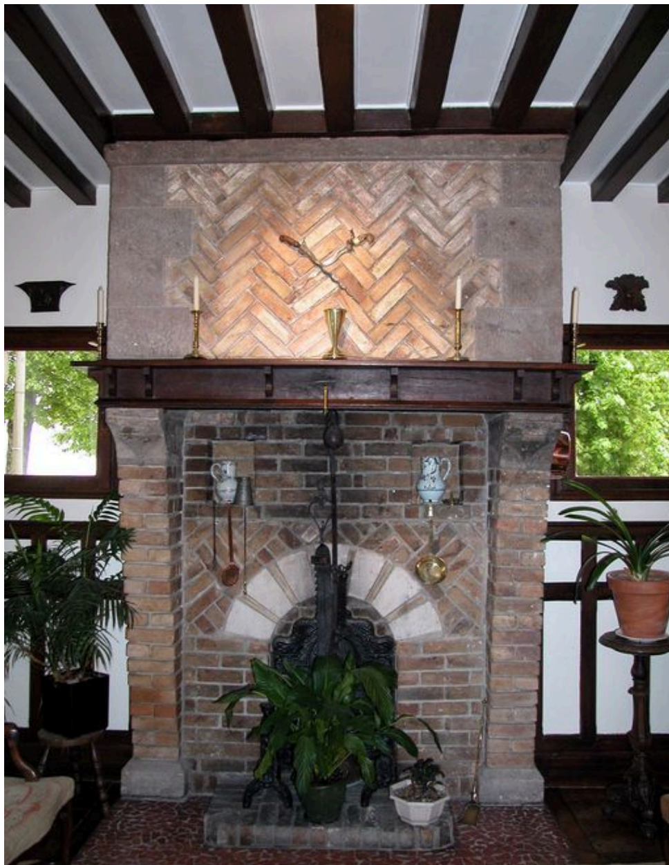
Cheminée de la salle commune aménagée par Pierre Ansart, architecte, vers 1926.