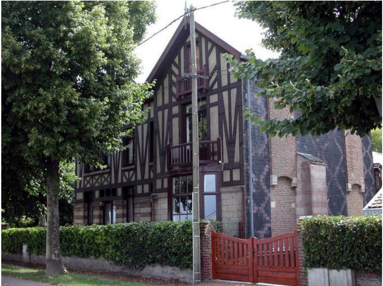
Vue d'ensemble sur la façade antérieure.