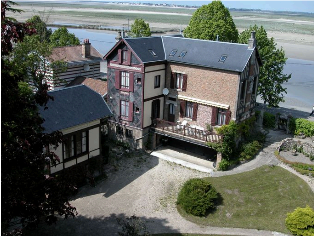
Vue d'ensemble depuis les fortifications de la Ville-Haute.