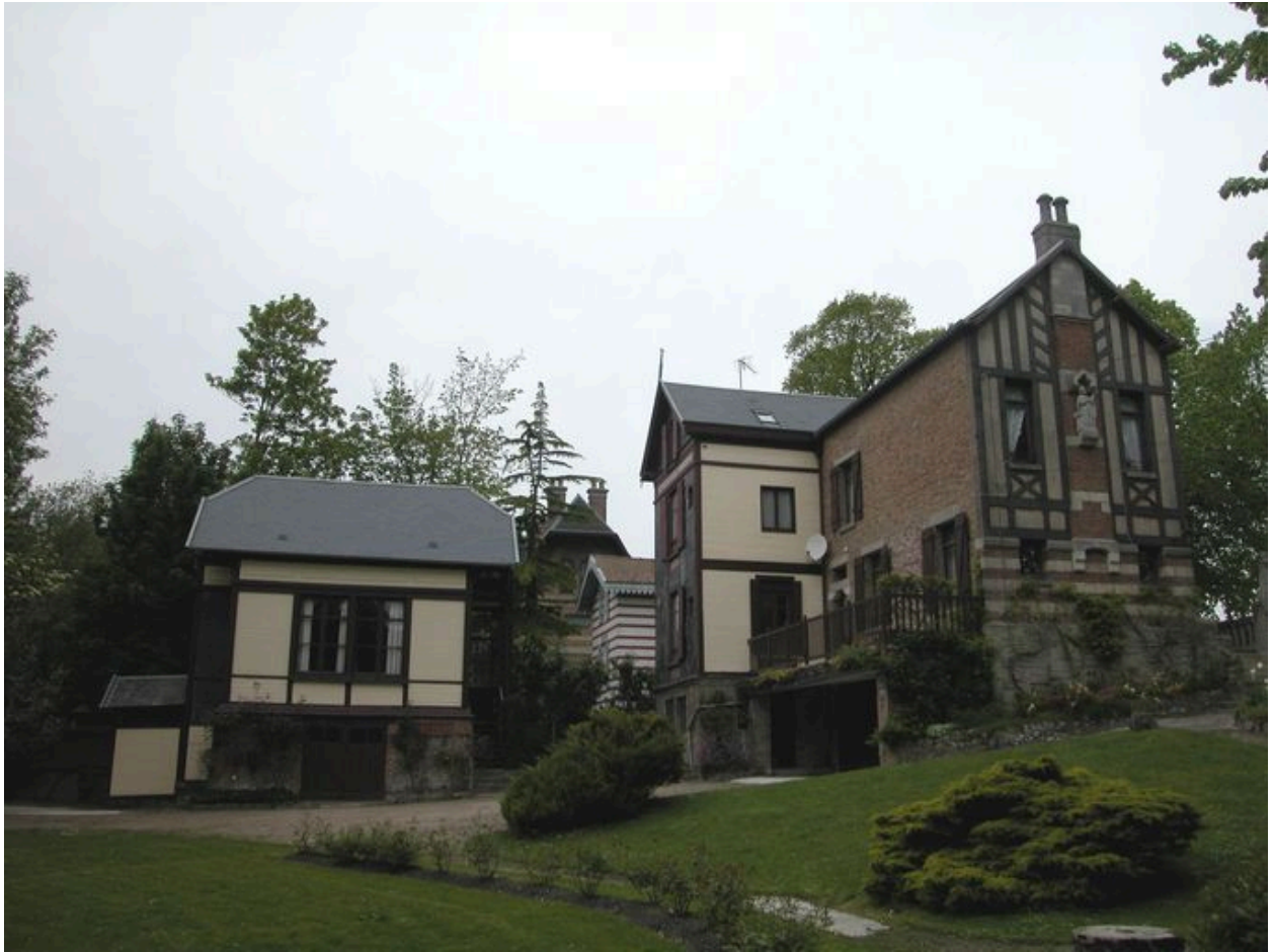
Vue d'ensemble de la villa et des communs, depuis le jardin.