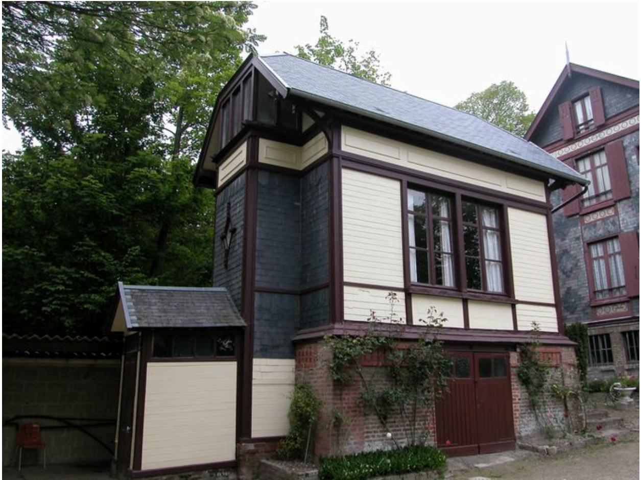
Vue d'ensemble des communs.