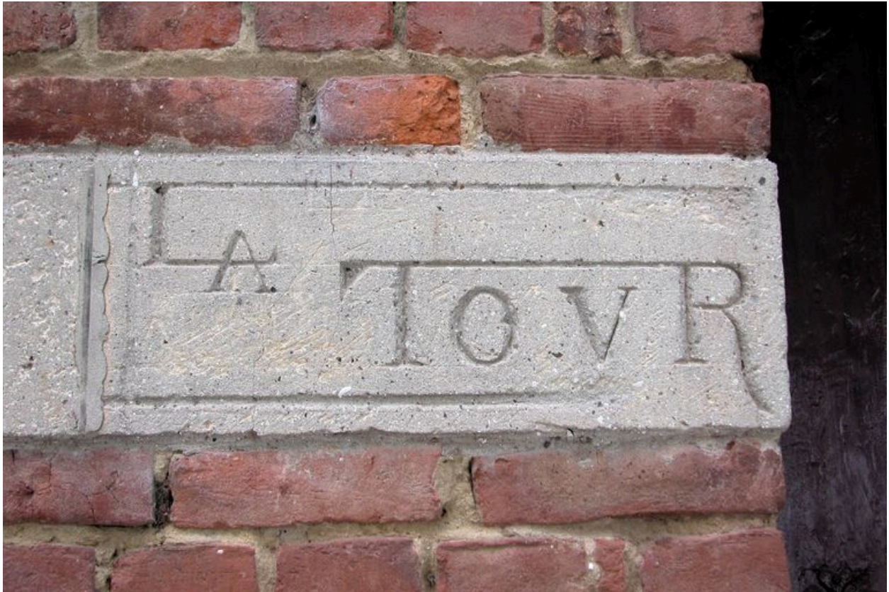
Détail de la pierre portant appellation.