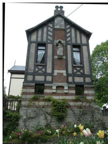
Élévation latérale gauche. IVR22_20048001430NUCA