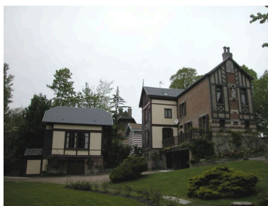
Vue d'ensemble de la villa et des communs, depuis le jardin.