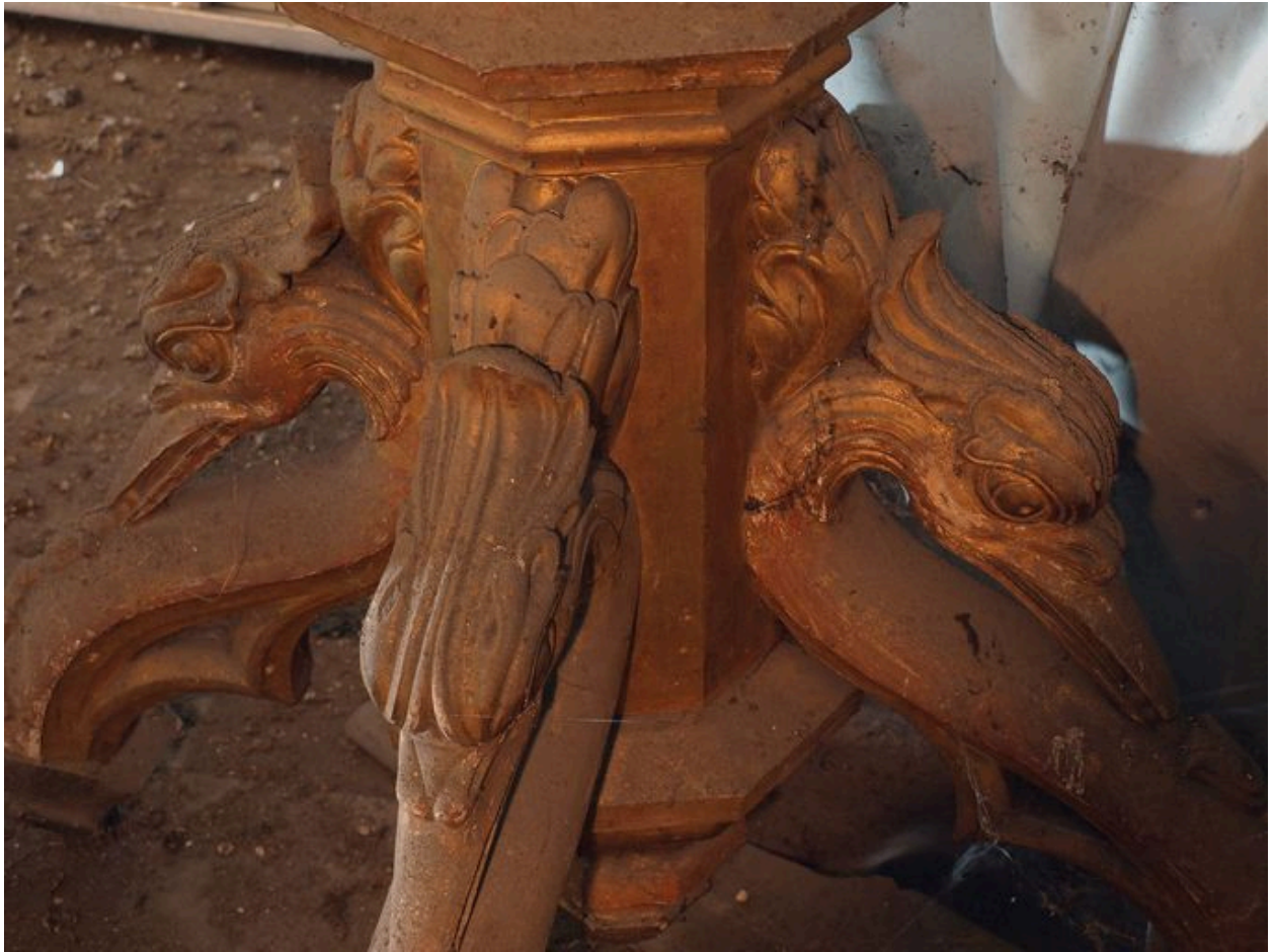
Vue de détail, pied