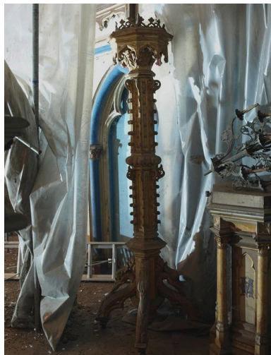
Vue générale IVR31_20106202055NUCA