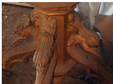
Vue de détail, pied