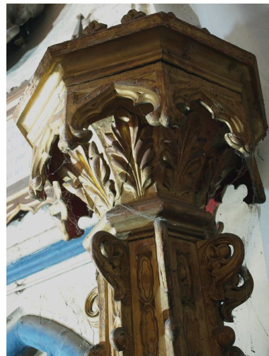
Vue de détail, partie supérieure IVR31_20106202056NUCA