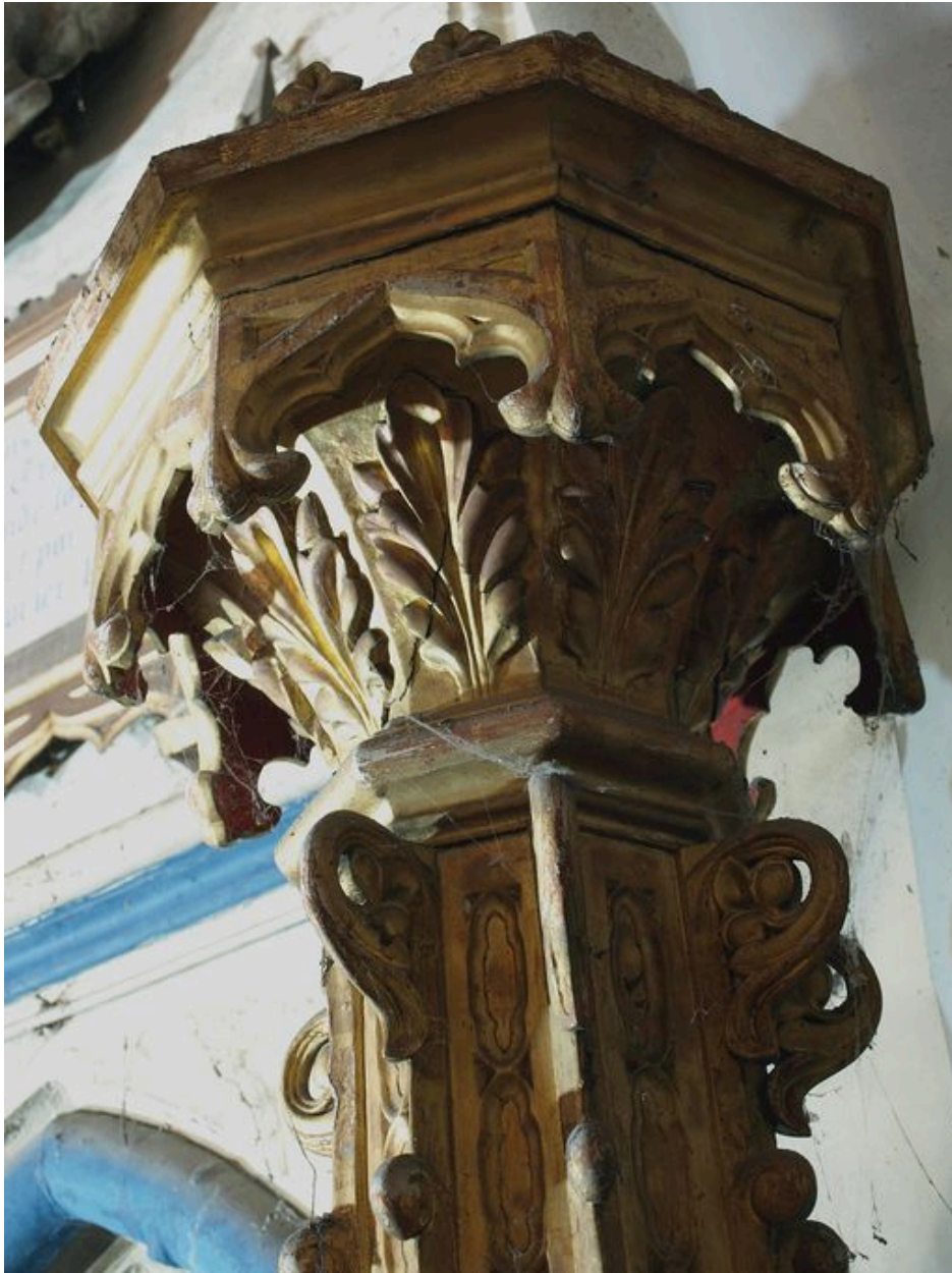
Vue de détail, partie supérieure