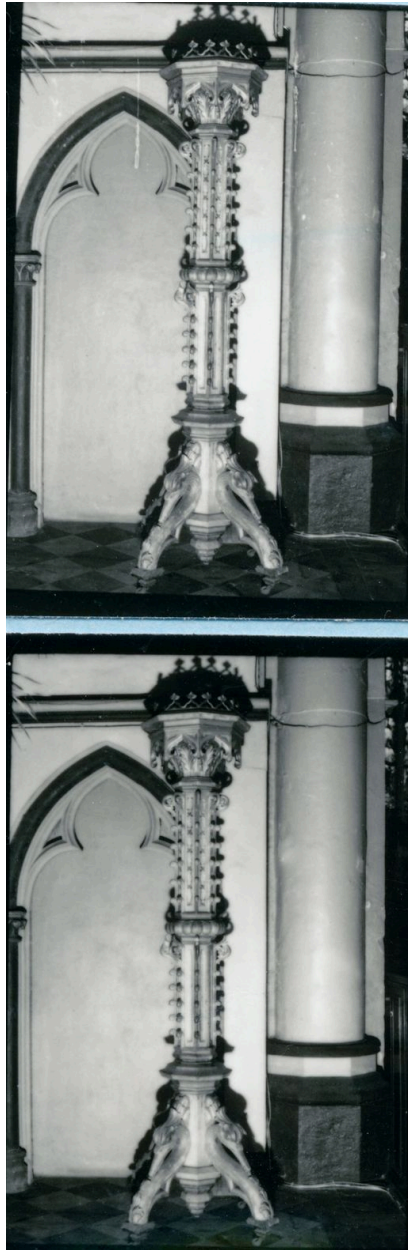
Vue générale