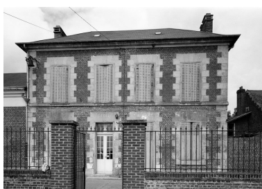
Elévation antérieure.