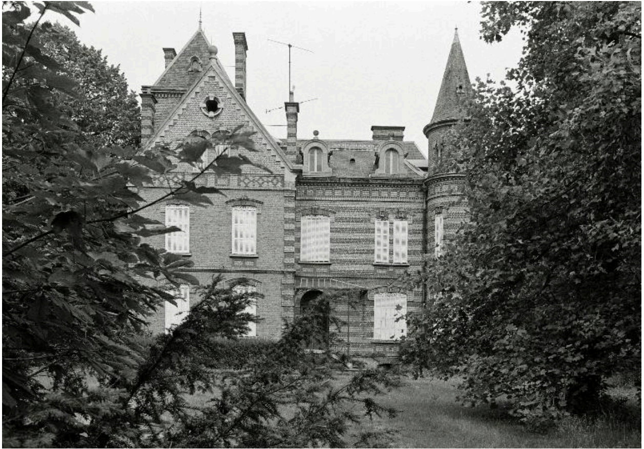
Elévation postérieure de la demeure, en 1990.