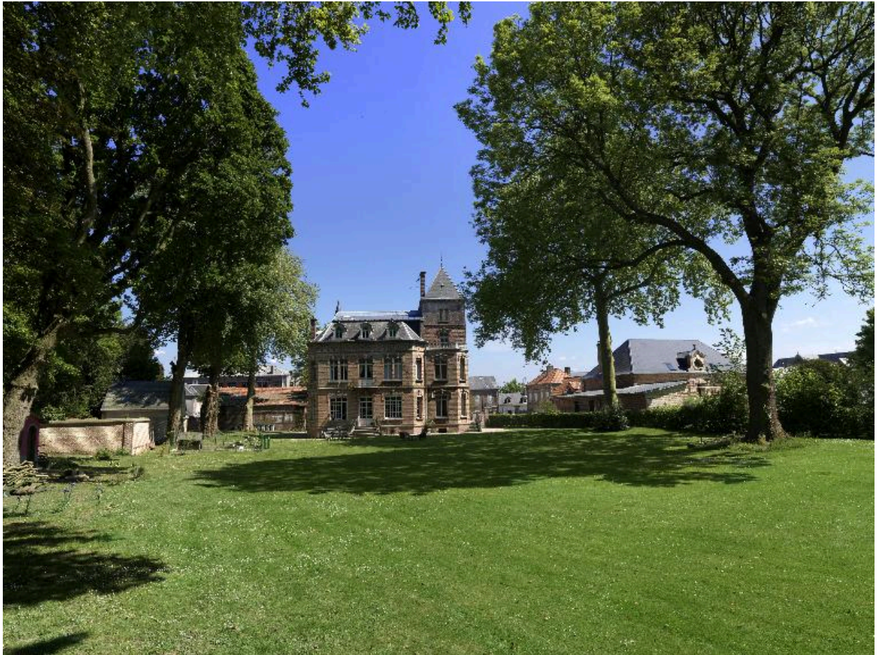
Vue du parc et de la façade postérieure.