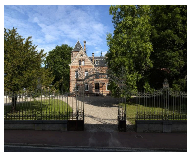
Vue depuis la rue Henri-Barbusse.