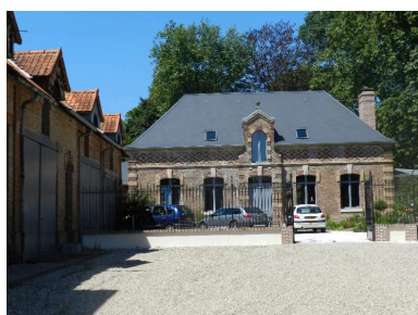
Les communs. IVR22_20128015617NUC1A