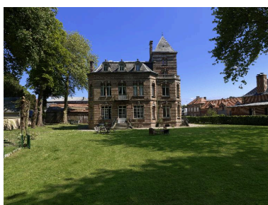
Façade postérieure.