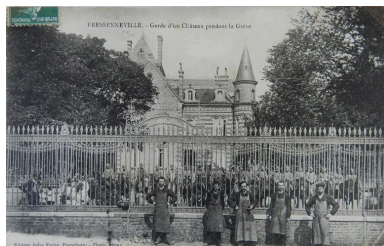
La maison patronale de Julien Riquier pendant la grève de 1906.