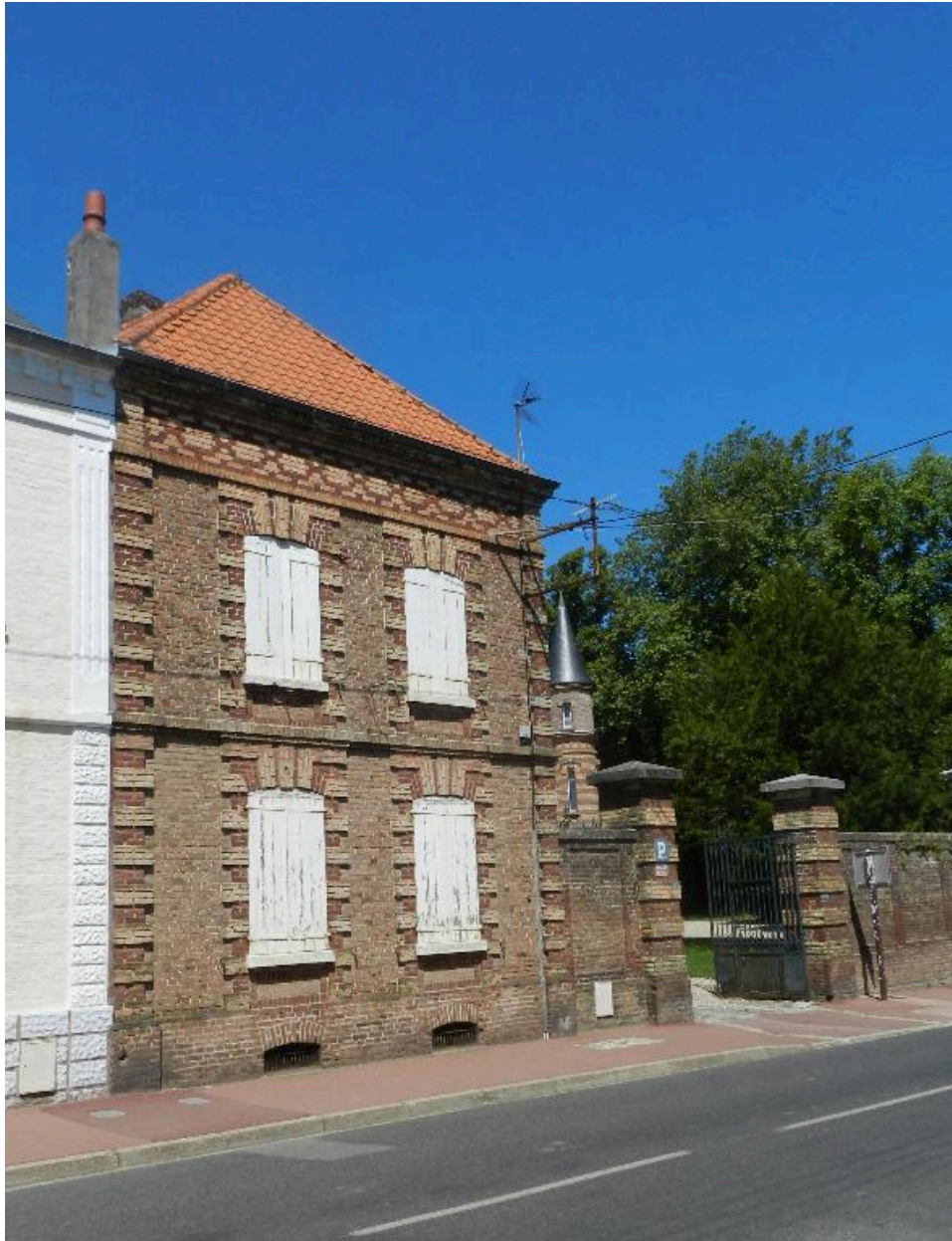
Les communs et le portail.