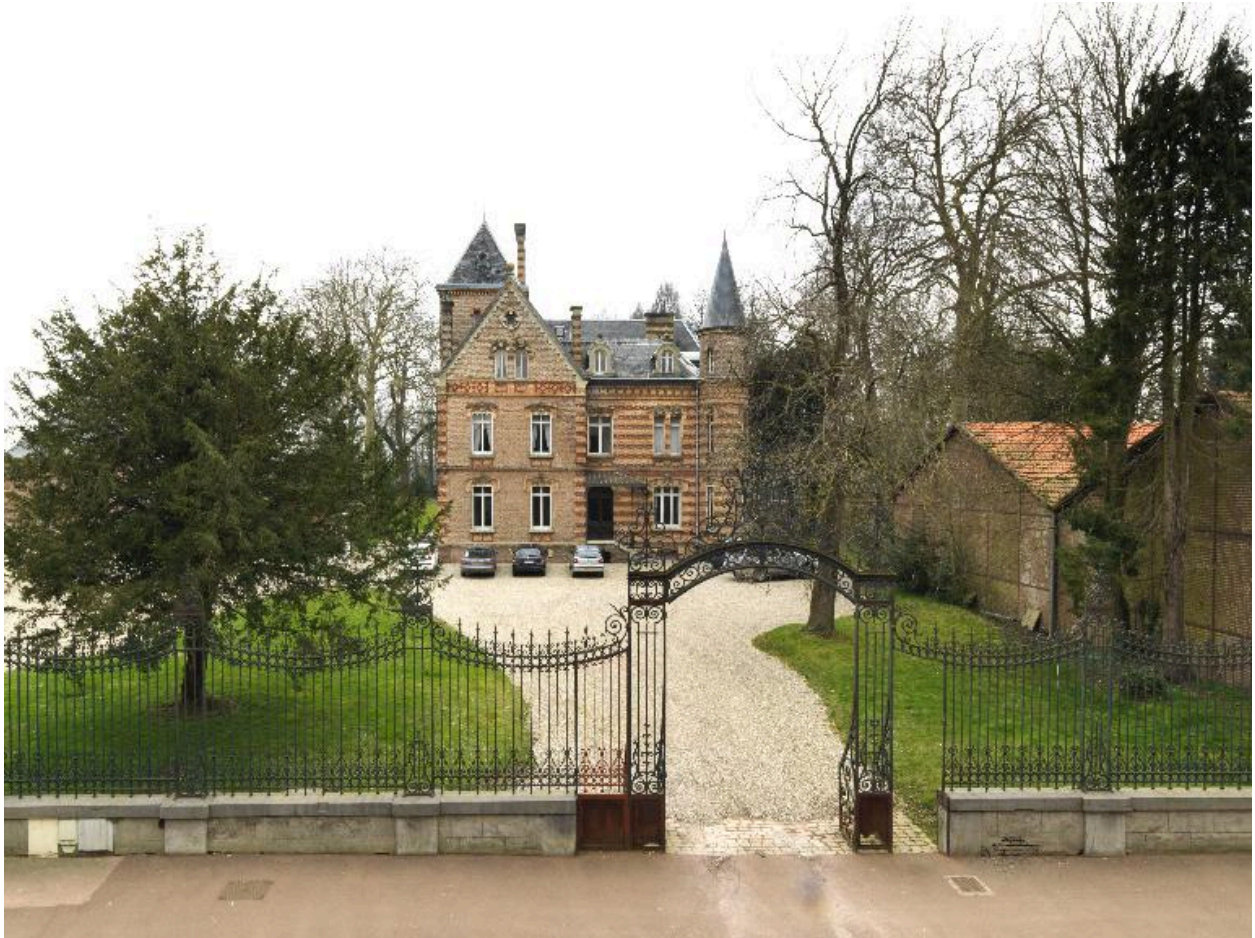
Vue générale depuis l'usine.