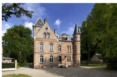
Façade antérieure. IVR22_20158000551NUC2A