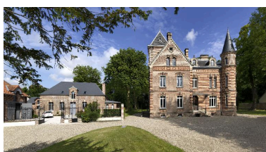
Vue d'ensemble. IVR22_20158000552NUC2AQ