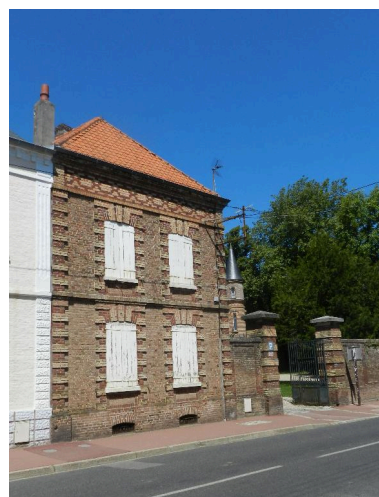
Les communs et le portail. IVR22_20128015616NUC1A