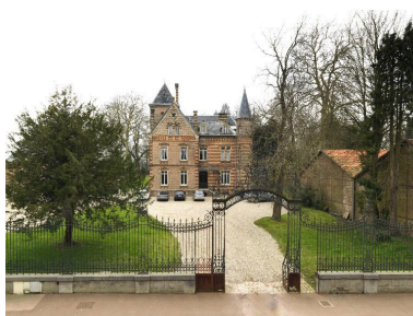
Vue générale depuis l'usine.