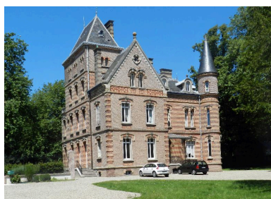
Vue générale. IVR22_20128005270NUCA