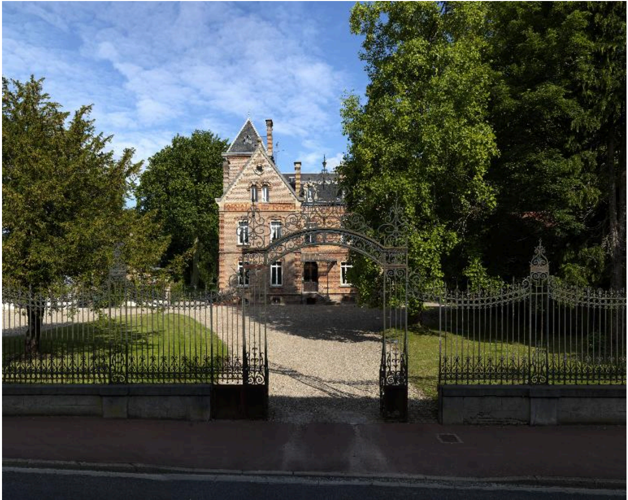
Vue depuis la rue Henri-Barbusse.