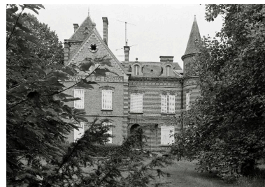
Elévation postérieure de la demeure, en 1990.